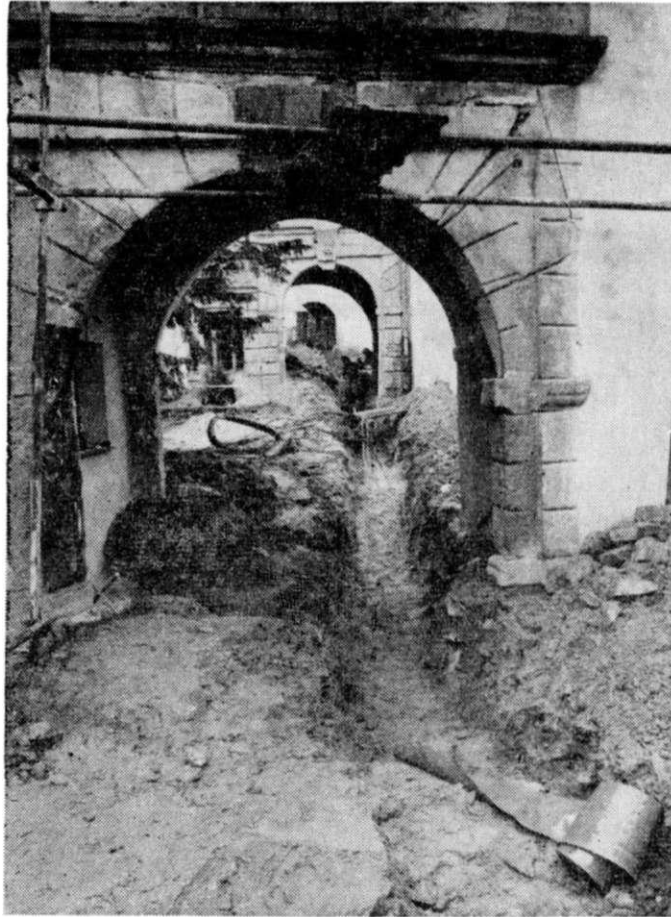
Obr. 1. Hrad Sovinec, výkop pro přípojku Inženýrských sítí provedený bez archeologického dohledá.

za první branou a zejména při pořizování zcela nevhodných cementových omítek. U poměrně dlouhého výkopu pro inženýrské sítě stavebník vůbec nezajistil záchranný výzkum, archeologický výzkum byl zahájen až v prostoru mezi velkou věží a obvodní hradbou vnitřního hradu (Kohoutek 1993). Hrad byl převeden ze správy okresního muzea na samostatnou organizaci Hrad Sovinec, avšak ta se fakticky nikdy neustavila a práce na hradě organizoval většinou přímo referát kultury okresního úřadu, nebo sám správce hradu.