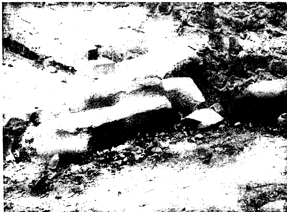
Obr. 2. Hrad choustník, architektonické články * předhradl. v pozadí je dobře patrné pokrytí koruny ědiva cementovou směsí. Foto J. Noll, 1993.

Odlišný charakter měla obnova a osudy jihočeského hradu Choustníka u Tábora. Hrad prodělal v 80. letech rozsáhlou obnovu, kterou projekčně i dodavatelsky zabezpečoval Jihočeský podnik pro údržbu památek Tábor, tedy organizace, která by měla být mimo vši pochybnost považována za povolnou k tomuto úkolu. K obnově bylo provedeno zaměření, v němž lze na první pohled najít chyby, vyplývající z jeho jen velmi průměrného řemeslného pro-