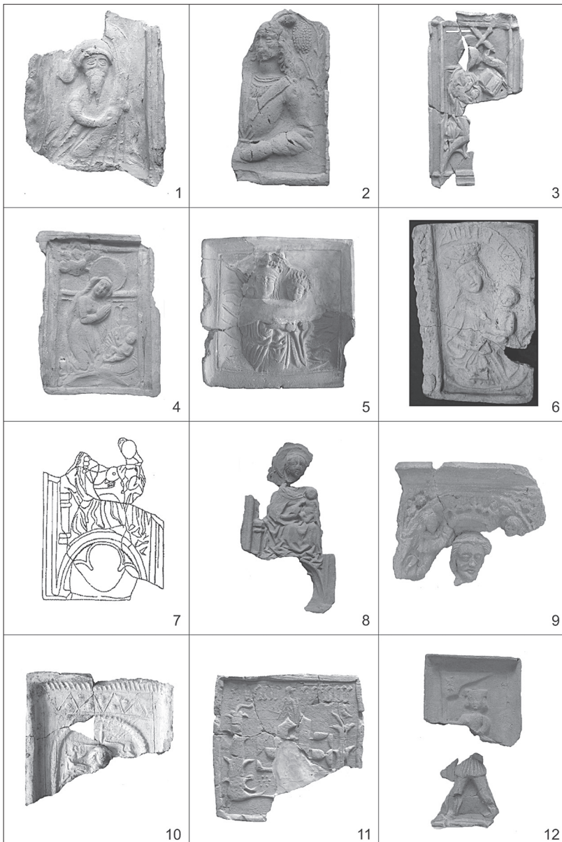
Tab. 1. Náboženské motivy: 1 - Neznámý prorok, Opava, Horní náměstí, 15/16. stol. (SZM); 2 - prorok Daniel, Jánský vrch u Javorníka, 15/16. stol. (VMJ); 3 - Zvěstování, Cvilín, 2. pol. 15. stol. (SZM); 4 - Panna Maria nad Ježíškem (Zbožná matka), Jánský vrch u Javorníka, 2. pol. 15. stol. (VMJ); 5 - Panna Maria s Ježíškem v aureole, Cvilín, 15/16. stol. (SZM); 6 - Panna Maria s Ježíškem, Starý Bohumín, poč. 16. stol. (Archaia, o. p. s. Olomouc); 7 - Panna Maria s Ježíškem (Královna nebes), Opava, Kolářská ul., 2. pol. 15. stol. (NPÚ, ú. o. p. v Ostravě); 8 - Panna Maria s Ježíškem (Královna nebes), Cvilín (SZM); 9 - Panna Maria korunovaná anděly (Královna nebes), 15./16. stol., Cvilín (SZM); 10 - Panna Maria - Ochránitelka, Ostrava, Masarykovo nám., 1. třetina 16. stol. (NPÚ, ú. o. p. v Ostravě); 11v Nápis „maria mater“, Cvilín, 2. pol. 15. stol. (SZM); 12 - sv. Václav, Cvilín, 15./16. stol. (SZM).