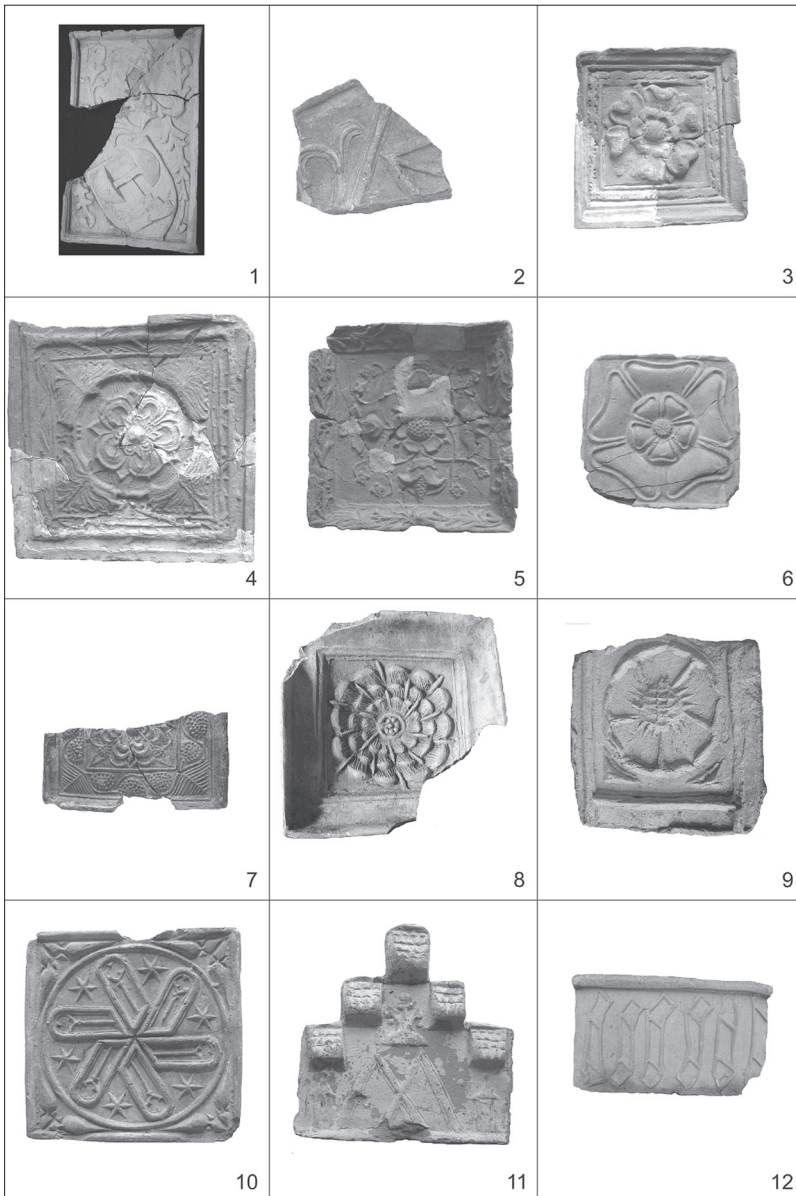
Tab. 4. Heraldické, rostlinné a architektonické motivy: 1 – Bělíkové z Kornic, první třetina 16. stol. (Archaia, o. p. s. Olomouc); 2 – Kravařové, Slezskostravský hrad, 2. pol. 15. stol. (MMO); 3 – Rozeta se šesti listy, Cvilín, 2. pol. 15. stol. (SZM); 4 – Rozeta se šesti listy, Cvilín, konec 15. stol. (SZM); 5 – Luční květy, Cvilín, 20.–30. léta 16. stol. (SZM); 6 – Rozeta s pěti listy, Jánský vrch u Javorníka, 15./16. stol. (VMJ); 7 – Rozeta rámovaná hrozny, Frýdek, poč. 16. stol. (MB); 8 – Rozeta se šesti násobnými listy, Opava, Drůbeží trh, 1. pol. 16. stol. (NPÚ, ú. o. p. v Ostravě); 9 – Rozeta s pěti listy na zlomku obkládací desky, Ostrava, Masarykovo nám., 1. pol. 16. stol.; 10 – Rozeta v podobě rotujících oken, Opava, Horní nám., 2. pol. 15. stol. (SZM); 11 – Římsový nástavec s pultovými stříškami s písmenem „M“, Jánský vrch u Javorníka, 15./16. stol. (VMJ); 12 – Imitace písma, Ostrava, Masarykovo nám., 15./16. stol. (NPÚ, ú. o. p. v Ostravě).

Taf. 4. Heraldik-, Pflanzen- und Architektur motive: 1 – Die Biliks von Kornitz, 1/3 16. Jhdt. (ARCH); 2 – Die Herren von Krawarn, Schlesisch-Ostrauer Burg, 2. Hälfte 15. Jhdt. (MMO); 3 – Sechsbliättrige Rosette, Cvilín / Schellenburg, Lobenstein, 2. Hälfte 15. Jhdt. (SZM); 4 – Sechsbliättrige Rosette, Cvilín / Schellenburg, Lobenstein, Ende 15. Jhdt. (SZM); 5 – Wiesenblumen, Cvilín / Schellenburg, Lobenstein, 20er–30er Jahre 16. Jhdt. (SZM); 6 – Fünfblättrige Rosette, Johannesberg bei Jauernig, 15./16. Jhdt. (VMJ); 7 – Von Trauben umrahmte Rosette, Friedeck-Mistek, Anf. 16. Jhdt. (MB); 8 – Rosette aus sechs Doppelblättern, Troppau-Geflügelmarkt, 1. Hälfte 16. Jhdt. (NPÚO); 9 – Fünfblättrige Rosette auf dem Plattenfragment einer Ofenverkleidung, Troppau-Masarykplatz 1. Hälfte 16. Jhdt.; 10 – Rosette in Form von rotierenden Fenstern, Troppau-Oberring, 2. Hälfte 15. Jhdt. (SZM); 11 – Simsaufsatz mit Pultdächelchen mit Buchstabe „M“, Johannesberg bei Jauernig, 15./16. Jhdt. (VMJ); 12 – Schriftimitation, Ostrau-Masarykplatz, 15./16. Jhdt. (NPÚO).