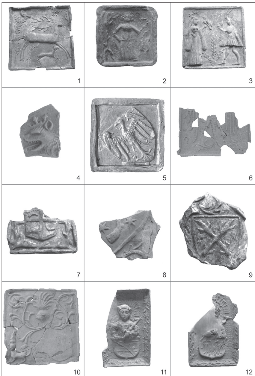
Tab. 3. Žánrové a heraldické motivy: 1 – Štvanice, Cvilín, 2. pol. 15. stol. (SZM); 2 – dívka s věnečkem, Opava, Horní nám., 14./15. stol. (SZM); 3 – Galantní scéna, Cvilín, 2. pol. 15. stol. (SZM); 4 – Lev, Cvilín, 2. pol. 15. stol. (SZM); 5 – Orlice, Opava, Drubeží trh, konec 14. – poč. 15. stol. (NPÚ, ú. o. p. v Ostravě); 6 – Orlice, Cvilín, 2. pol. 15. stol.; 7 – Znak krnovského knížectví, konec 15. – poč. 16. stol. (SZM); 8 – Znak Krnova, Cvilín, 2. pol. 15. stol. (SZM); 9 – Berkové z Dubé, Cvilín, 2. pol. 15. stol. (SZM); 10 – Prázdný štít s běsem, Jánský vrch u Javorníka, 2. pol. 15. stol. (VMJ); 11 – Wettinové, Cvilín, 20.–30. léta 16. stol.; 12 – Dvouhlavý orel, Cvilín, 20.–30. léta 16. stol. (SZM).

Taf. 3. Genreszenen und heraldische Motive: 1 – Treibjagd, Cvilín / Schellenburg, Lobenstein, 2. Hälfte 15. Jhdt. (SZM); 2 – Mädchen mit Haarkranz, Troppau-Oberring, 14./15. Jhdt. (SZM); 3 – Galante Szene, Cvilín / Schellenburg, Lobenstein, 2. Hälfte 15. Jhdt. (SZM); 4 – Löwe, Cvilín / Schellenburg, Lobenstein, 2. Hälfte 15. Jhdt. (SZM); 5 – Adler, Troppau-Geflügelmarkt, Ende 14. – Anf. 15. Jhdt. (NPÚO); 6 – Adler, Cvilín / Schellenburg, Lobenstein, 2. Hälfte 15. Jhdt.; 7 – Wappen des Herzogtums Jägerndorf, Ende 15. – Anf. 16. Jhdt. (SZM); 8 – Wappen von Jägerndorf, Cvilín / Schellenburg, Lobenstein, 2. Hälfte 15. Jhdt. (SZM); 9 – Die Berkas von Dubá, Cvilín / Schellenburg, Lobenstein, 2. Hälfte 15. Jhdt. (SZM); 10 – Leerer Wappenschild mit Teufel, Johannesberg bei Jauernig, 2. Hälfte 15. Jhdt. (VMJ); 11 – Die Wettiner, Cvilín / Schellenburg, Lobenstein, 20er–30er Jahre 16. Jhdt.; 12 – Doppelkopfadler, Cvilín / Schellenburg, Lobenstein, 20er–30er Jahre 16. Jhdt. (SZM).