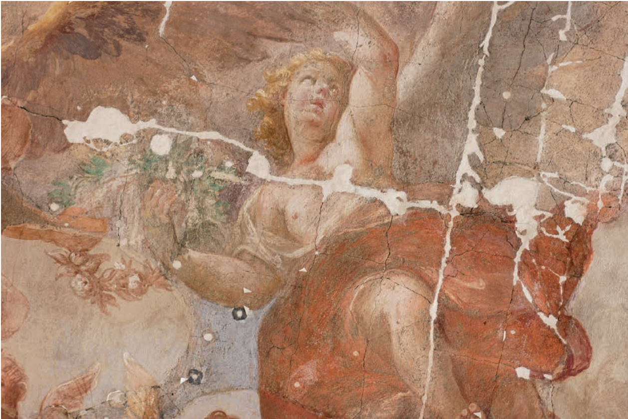
11 – Anton Hertzog (zugeschrieben) – Franz Anton Danne, Aufnahme Marias in den Himmel , Deckengemälde (Detail), um 1734/1735. Wien, Jesuitenkolleg, ehemaliger Theatersaal

Mischtechnik aus Fresko und Secco. Die Zone der Quadraturmalerei weist im Gegensatz zum zentralen Figurenfeld Gravierungen auf. 47