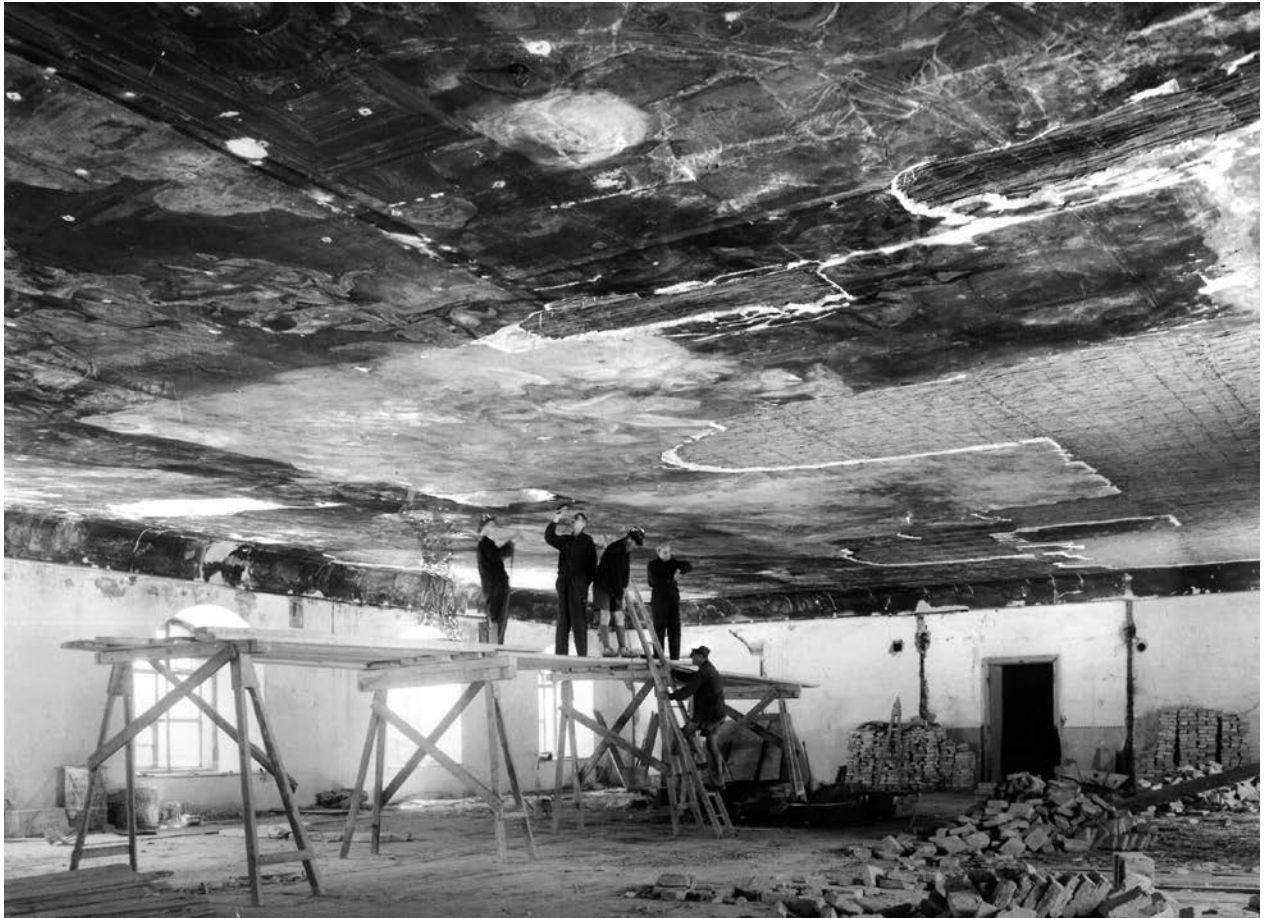
3 – Untersuchung des Freskos im ehemaligen Theatersaal des Jesuitenkollegs Wien, Fotografie, 1948.

bei der Ausführung des Heiligen Grabes im Zisterzienserkloster in Zwettl zum Tragen kam. Es muss jedoch bedacht werden, dass die konkrete Arbeitsweise und Händescheidung der Galli Bibiena und ihrer Werkstatt, sowie die Komplexität ihrer Auftragsdelegation und Arbeitsteilung noch nicht ausreichend erforscht werden konnten. 19