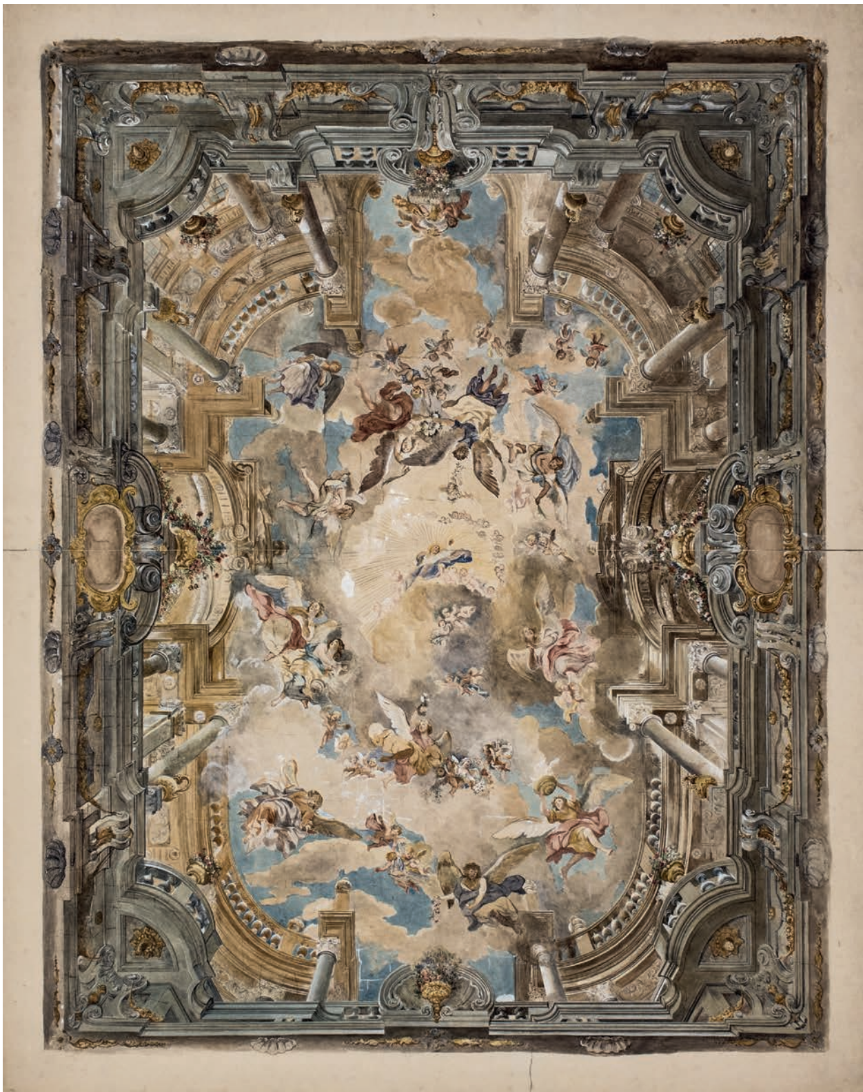
2 – Gustav Hartinger, Deckenfresko im Jesuitentheatersaal , Aquarell, 1896. Wien, Kupferstichkabinett der Akademie der bildenden Künste, Inv.-Nr. HZ 21218