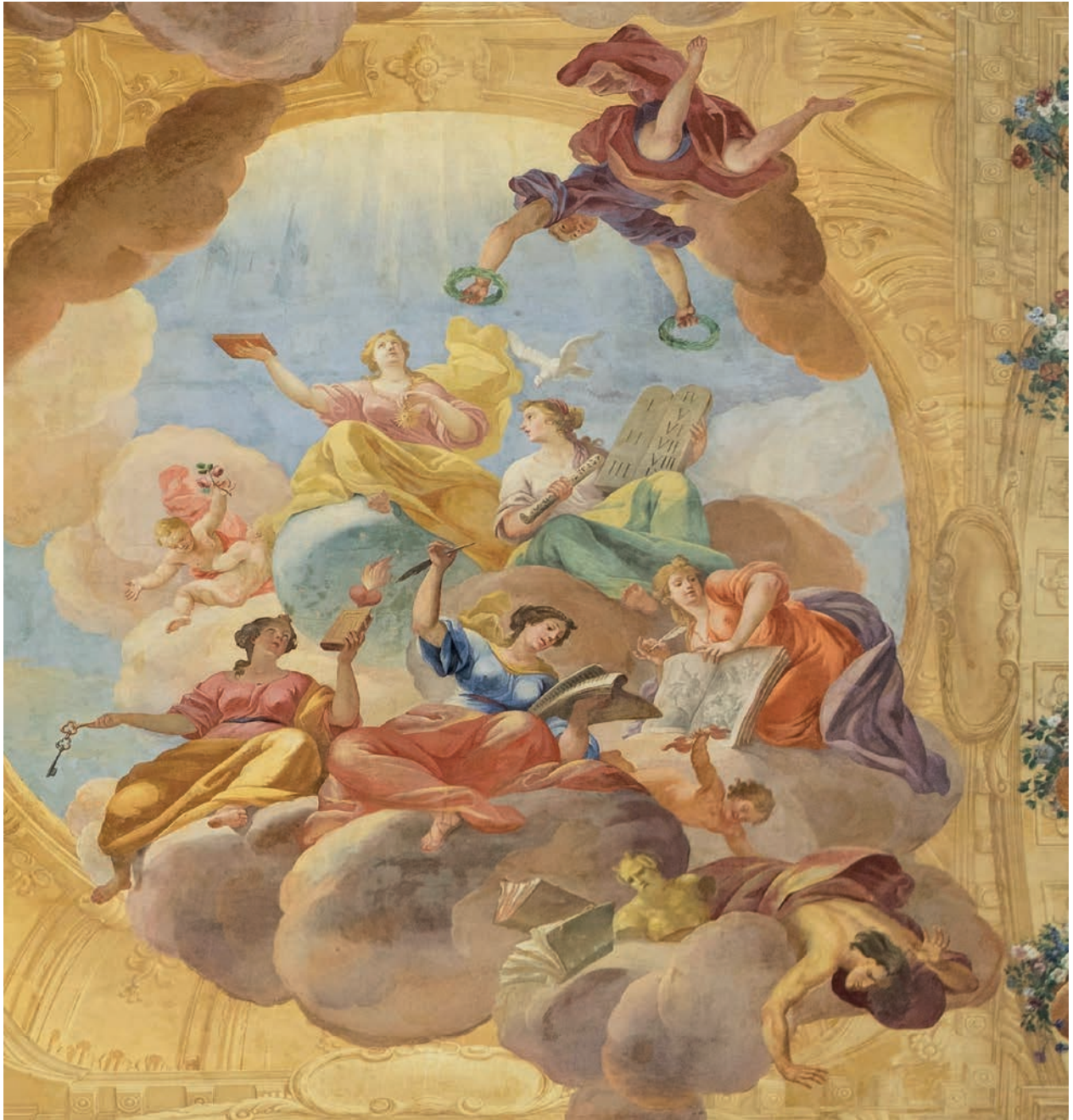
7 – Anton Hertzog – Franz Anton Danne, Allegorie der Wissenschaften , Deckengemälde (Detail), 1734. Wien, Jesuitenkolleg, ehemaliger Bibliothekssaal

einer – auf die jeweils nächstgelegene Jahreszeit bezogenen – repräsentativen Tätigkeit, beispielsweise einer Jagd oder einer Schlittenfahrt, nachgehen. Das Mittelfeld gibt den Blick in das blaue Himmelsfeld mit Wolken frei, in welchem sich Allegorien der Jagd, der Landwirtschaft und des Theaters finden. Bezüglich des Themenkonzeptes lassen sich in der Literatur verschiedene Lesarten finden, welche sich in ihren Deutungen primär in der Interpretation der zentral positionierten Figur mit dem Hirsch unterscheiden: So wird diese beispiels-