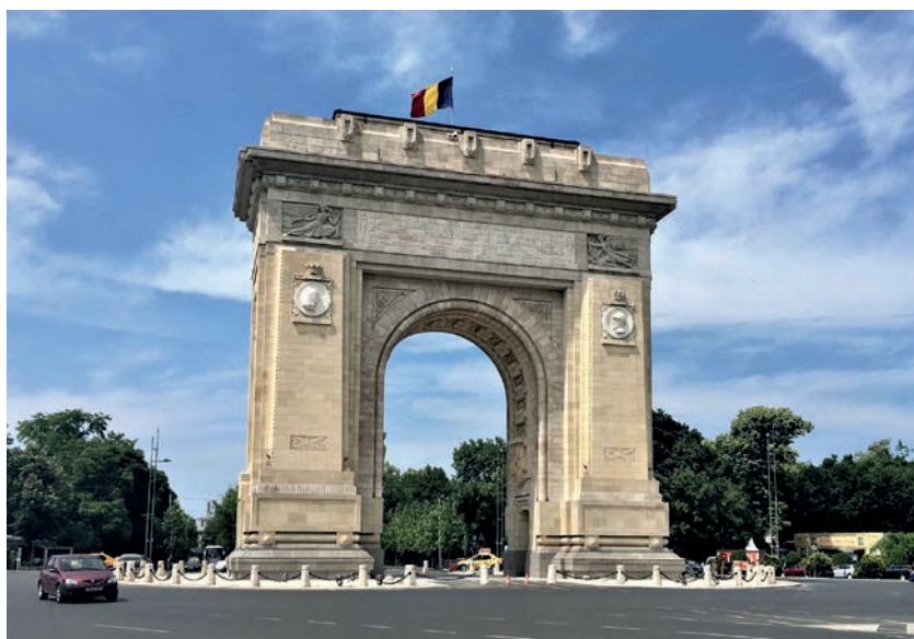
Vítězný oblouk v Bukurešti.

lety vyhlášeno připojení Sedmihradska k Rumunsku, měl symbolizovat integraci regionu do rumunského státu, ale stal se tak i symbolem regionálních rozporů. 27