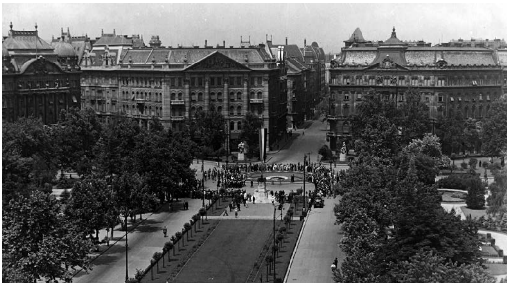
Revizionistický památník na Szabadság tér v Budapešti (detail). Zdroj: Fortepan / Pálkás Zsolt, 1938.

ností meziválečného Maďarska, což posilovaly ze zmíněných důvodů elity, ale i statisíce Maďarů, které byly nuceny opustit své domovy po roce 1918. 49