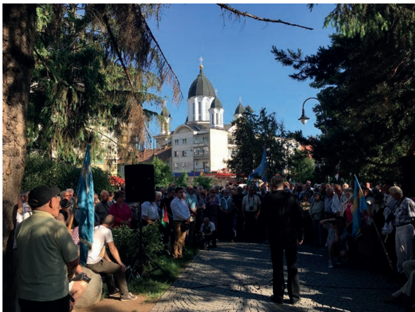
Komemorace výročí Trianonu ve Sfântu Gheorghe (Sepsiszentgyörgy, Rumunsko) v roce 2017.