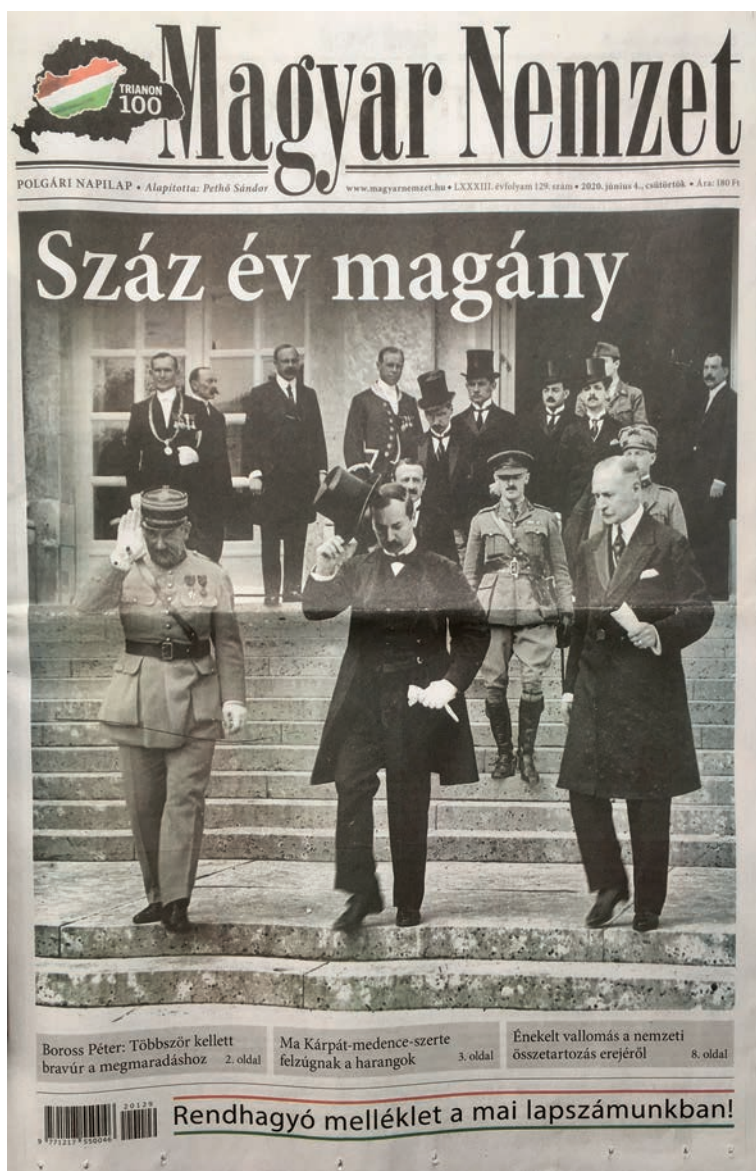
Titulní strana provládního deníku Magyar Nemzet ze 4. června 2020.

Orbánovy vlády. A ty byly dominovány už zmiňovanou snahou o užší regionální spolupráci.