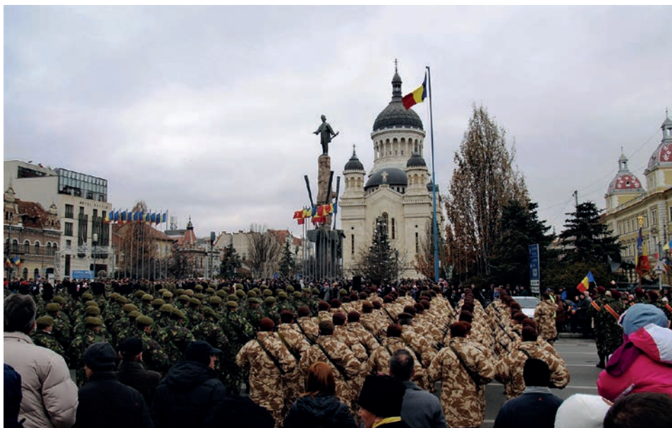
Oslavy rumunského státního svátku v Cluj-Napoce v roce 2014.

městech podobně: kolem 1. prosince má bukureštský parlament slavnostní zasedání, v samotný výroční den se po vojenské přehlídce a proslovech pořádají různé kulturní akce, ohňostroje a tančí se tradiční rumunská „hóra“. Centrální oslavy jsou v Bukurešti (pod vítězným obloukem) a v Alba Iulii (v prostorách a v okolí pevností).