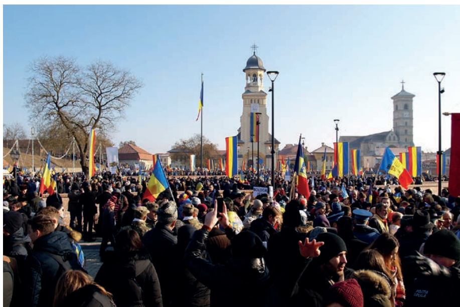
Oslava stého výročí „Velkého sjednocení“ v Alba Iulii 1. prosince 2018.

existence 83 a zdůraznil dědictví ideálů, hodnot a vizí těch, kteří se podíleli na sjednocení Rumunů. Za „nejkrásnější duchovní dědictví“ 84 pak pokládal to, že „Velké sjednocení bylo ve skutečnosti velké a hluboké sjednocení všech Rumunů kolem společné snahy, pro jejíž uskutečnění nebyla žádná oběť příliš veliká“. 85 Poté zmínil mimo jiné podporu tradičních partnerů Rumunska, wilsonovské principy, důležitost jednoty, soudržnosti a blízkosti přátelských demokratických a civilizovaných národů. Nakonec poukázal na kontinuitu mezi „hodnotami, které stály u základu uskutečnění sjednocení a těmi, ve které pevně věříme dnes“ a jež činí z 1. prosince nejen rumunský, ale i evropský svátek. 86