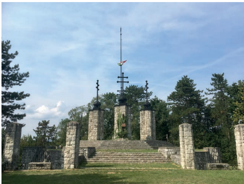
Trianonský památník v Zebegényi z meziválečného období, dokončený v roce 2000.

nacionalismu získalo zpět svou původní podobu i funkci mnoho starých památníků, navíc byla po celém Maďarsku postavena řada nových (i když často nevalné umělecké úrovně). 65