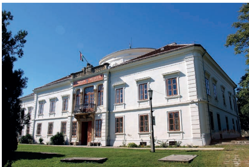
Muzeum Trianonu ve Várpalotě.

volbách v roce 2010. Jedním z prvních kroků nové legislativy byl zákon, jímž se 4. červem stal „národním pamětním dnem“ nazvaným „den národní soudržnosti“. Text zákona – kromě vyjádření zájmu o „vzájemné pochopení a spolupráci mezi národy žijícími spolu v Karpatské kotlině“ – mluví o trianonské mírové smlouvě jako o „mírovém diktátu“, o „jedné z největších historických tragédií Maďarů“, kdy cizí mocnosti nespravedlivě a nehodným způsobem rozštěpily historické Uhersko a maďarský národ, což vedlo k dodnes nevyřešeným politickým, hospodářským, právním i duševním problémům. Zákonem dále parlament deklaruje, že „každý příslušník a každá komunita maďarství je součástí jednotného maďarského národa a jeho soudržnost nad státními hranicemi je realitou“. 63 Výročí Trianonské mírové smlouvy má tedy každý rok připomenout obyvatelstvu Maďarska, že přes politické hranice tvoří s Maďary v zahraničí jednotný a nedělitelný maďarský národ. Nejde o státní svátek, ale ani o smuteční den; ve veřejnosti se formou proslovů a školních akcí, článků a dokumentárních pořadů v médiích připomíná rozpad Uherska, kontroverzní trianonská smlouva a okolnosti, které tuto křivdu dodnes reprodukuje (tj. nevyřešená situace maďarských menšin v sousedních zemích). Ke komemoraci Trianonu dochází i v sousedních státech s maďarskou menšinou – hlavně tam, kde Maďaři tvoří lokální většinu, jako například v sikulském regionu.