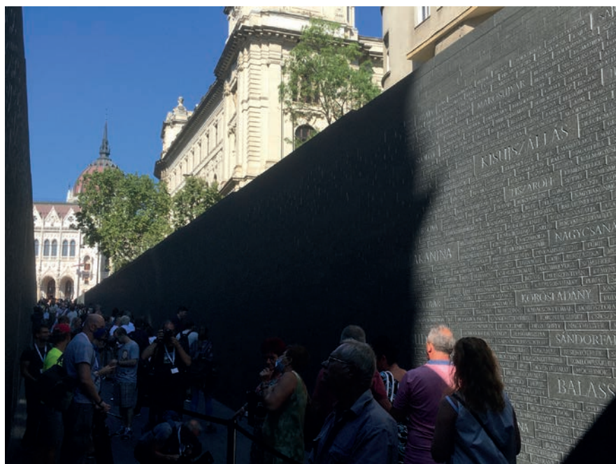
Odhalení památníku Trianonu (národní soudržnosti) v Budapešti 20. srpna 2020.

ság“), čímž se zmocněncem vlády pro koordinaci výročí stala známá konzervativní historička Mária Schmidt spolu s ministrem lidských zdrojů Miklósem Káslerem. 94