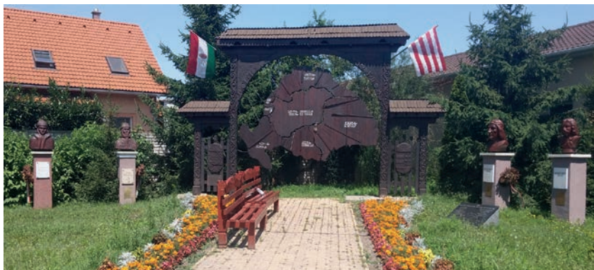
Trianonský památník ve Vecsési z roku 2006.

habilitace Trianonu ve veřejném prostoru“. 64 Do poloviny prvního desetiletí 21. století bylo rekonstruováno jen několik trianonských památníků, ale po rozmachu maďarského