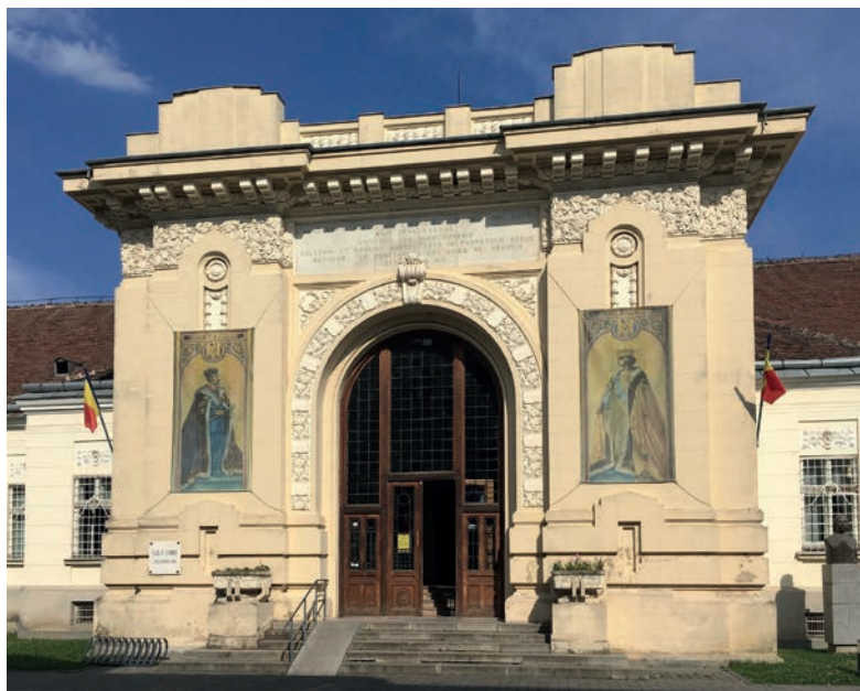
Vchod do sálu sjednocení v Muzeu sjednocení v Alba Iulii.

a články byly zveřejněny v místním nebo centrálním tisku. 37 O růstu významu výročí svědčilo i obnovení a reorganizace komplexu „Muzea sjednocení“ v Alba Iulii v roce 1968. 38 Vedle regionálních dějin se stálá expozice zaměřila na historii celého „rumunského prostoru“ a hlavní osou jejího narativu se stal boj Rumunů za národní jednotu. Důležitou kapitolu zde tvořila efemérní vláda knížete Michala Chrabrého, „prvního sjednotitele rumunských zemí“ 39 ve Valašsku, Sedmihradsku a Moldavsku zároveň, pak národní hnutí v 19. a 20. století a nakonec „Velké sjednocení“ z roku 1918. 40 Tento pohled na rumunské dějiny značně poznamenal identitu generací, které vyrostly v tomto období a jejichž aktivní léta pak spadala na léta po pádu komunismu.