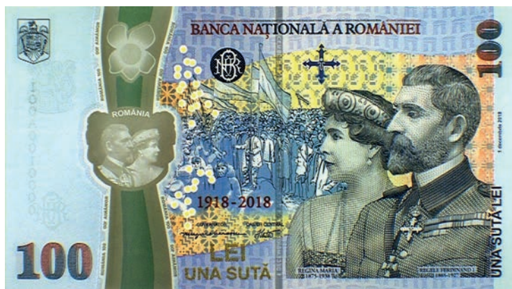
Výroční bankovka Rumunské národní banky.

https://bnr.ro/Bancnota-aniversara-pentru-colec%C8%9Bionare-dedicata-implinirii-a-100-de-ani-de-la-Marea-Unire-de-la-1-Decembrie-1918-18833.aspx .