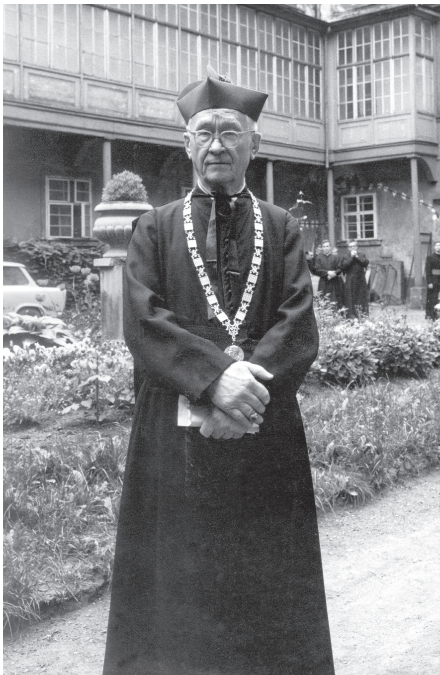
Obr. 38: Čestný doktor teologie Dominik Pecka (10. června 1969)