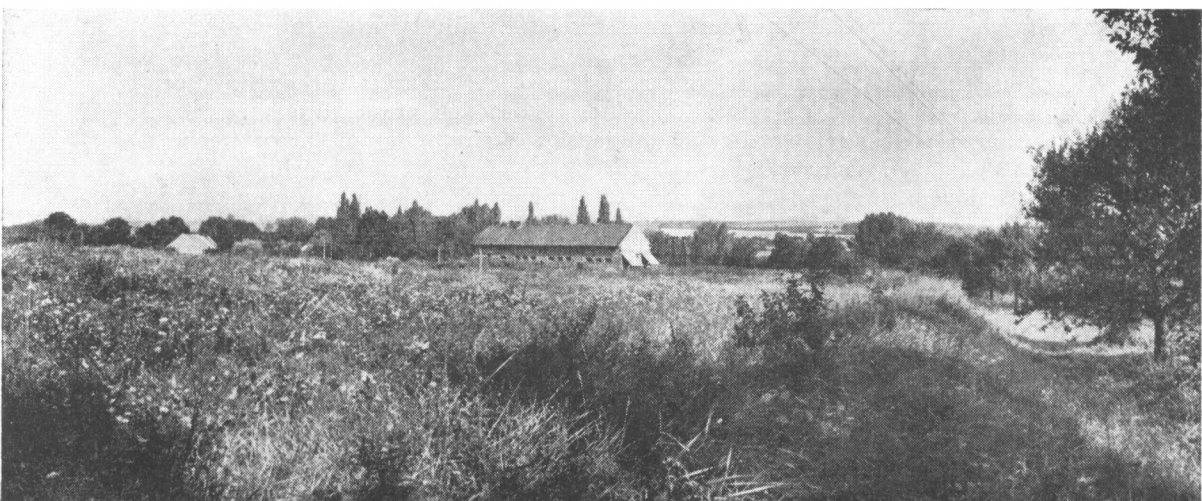
Obr. 2. Bylany (okr. Kutná Hora). Plocha raně středověkého sídliště v kontaktu s dnešní vesnicí Bylany (v pozadí). Pohled od J na hranu omezující plochu sídliště od V.