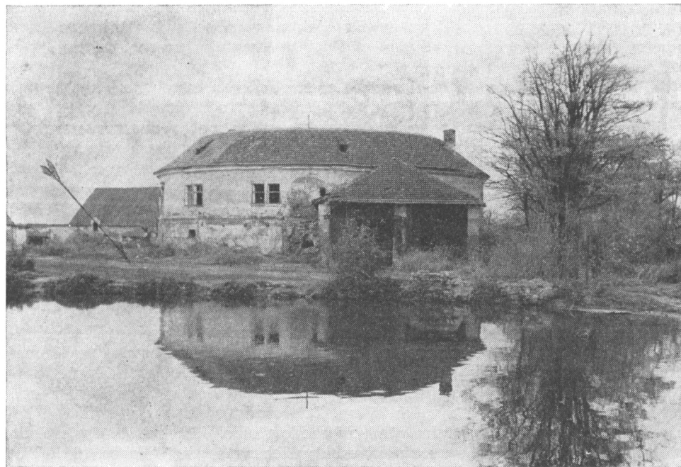
Obr. 2. Praha IV – Chodov. Stavba zámečku – přestavěné tvrze od jihozápadu.

Při tvrzi byl proveden průkop (sonda X a XI) a směrem k rybníku s. XV, XVII a XXIV. Objevily se základy zděné ohrady, zachované do výšky 110 cm. Ohradni zeď vycházela od tvrze k severozápadu a po 12,70 m se lomila a směřovala na sever k vepřínu. Pod svrchní částí zdi se objevuje starší fáze stavby, která má v severní polovině schůdek o šířce 30 cm. Horní zdivo tvořící pás