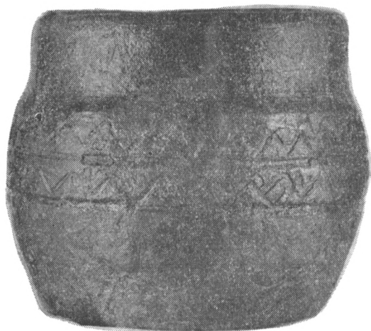
Obr. 3. Zbýšov (okr. Brno-venkov), zaniklá středověká osada Studýň. Nádoba s válcovitým okrajem z narušeného objektu.

Velké záchranné výzkumy přinášející mnoho nových poznatků o topografii raněstředověkého hradiště s podhradím, jež přerostlo ve významné středo-