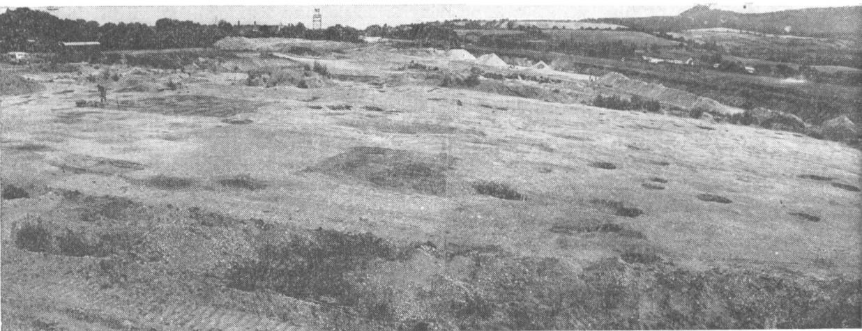
Obr. 2. Dolní Věstonice (okr. Břeclav). Pohled na plochu ve štěrkovně Ingstavu odkrytou v roce 1977. Okraj slovanského sídliště se nacházel v levém zadním rohu plochy.