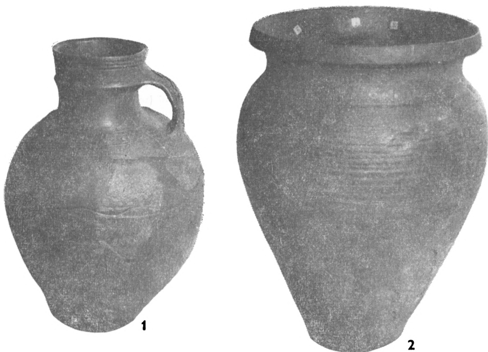
Obr. 3. Přibice. Džbán a hrnec.

Stratigrafická situace na výzkumu se jevila následovně: Pod asi třiceticentimetrovou vrstvou ornice (zahrádka) se nacházela vrstva navážky mocná 30 až 50 cm sestávající z písku, cihel, kamenů a úlomků keramiky. Pod navážkovou vrstvou byl objeven písčité rostlý terén do něhož byla zahlobubena jáma, jejíž půdorys nebylo možno zjistit. Zásyp jámy tvořily vrstvy různě zbarvené hlíny. Do hloubky 220–240 cm od povrchu to byly hlíny hnědých odstínů, ale hlouběji až ke dnu převažovala černá hlína s kousky mazanice. Vrstvy byly