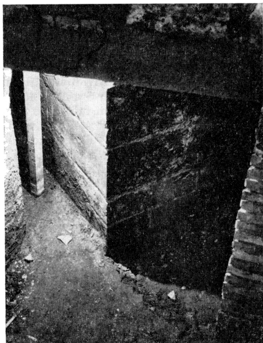
Obr. 3. Pohled na spodní část kvádrového pilíře dřevěného mostu, dnes přístupnou ze sklepa domu čp. 379/I. (č. 016 plán domu v plánu č. 1 v tomto sborníku.) Pro Janu Vodičkovou foto Zdeněk Helfert 1971.

vzniku není známo. Tomek uvádí vznik asi k roku 1362, Lorenc v rozpětí mezi léty 1359 až 1361. (Tomek I., 1866, s. 124. Tomek-Dějepis II, 1871, s. 137. Ruth, 1903, s. 603. Lorenc 1973, s. 124, 125). Lorenc publikuje též v cit. díle rekonstrukci původního půdorysu i řez basilikou.