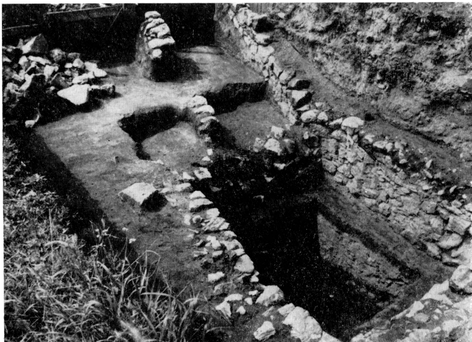
Obr. 3. Spodná časť architektúry vo východnej časti hradu.