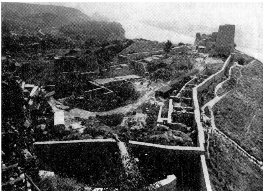
Obr. 2. Stredný hrad.