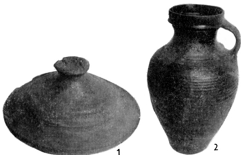
Obr. 3. Vranovice, zaniklá osada Teplany. Poklička (v. 80 mm) a džbán (v. 348 mm) z objektu 14.

Keramika tohoto horizontu byla vesměs vyráběna z jemně zrnitého materiálu s příměsí jemněji nebo hruběji drčené slídy. Jemně plavený materiál byl použit jen u trojnožek a tuha byla přidávána jen do keramické hmoty velkých zásobnic. Zatím exaktně není ověřen způsob výroby nádob a pokliček. Přestože na dnech chytí stopy po odříznutí domnívám se, že keramické tvary většinou byly tvářeny na rychlorotujícím hrnčířském kruhu. Výzdoba keramiky je velmi chudá a omezuje se v podstatě na šroubovici, vlnici a vypnuliny. Barva nádob je černá až šedočerná nebo hnědočerná.