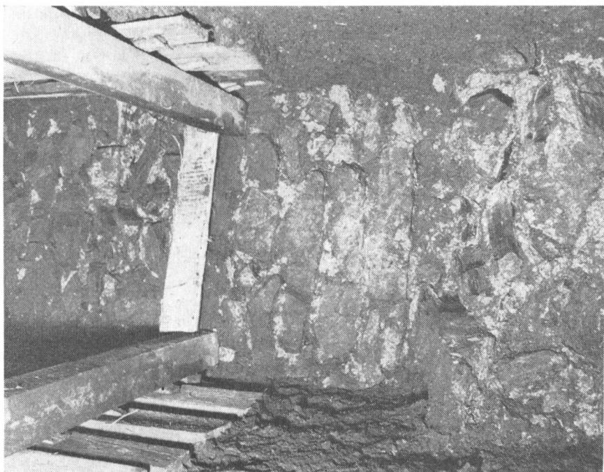
Obr. 4. Olomouc – dómské návří 1974: Vnitřní strana hradební zdi u román- ské věžové vřě (Sonda 15/74). Pod rozpěrou zbytek nadzemního licovaného a pod ním základového rozšířeného zářva předgotického původu. Nad roz- pěrou hrubě základové zářvo novější hradby, datované prázdkým grošem Ja- na Lucemburského.