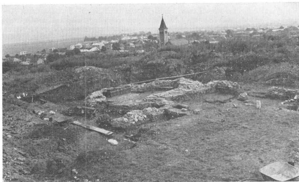
Obr. 2. Pohľad na rotundu.

pustiť, že mnohé práce a výrobky, bez ktorých sa nezaobíde každodenný život, si robili i sami príslušníci komunity (frátri). V materiálnej kultúre, ktorej zvyšky sme získali treba vidieť prejav kultúrnych prúdov od 12. až do konca 16. storočia. Získané výrobky a ich fragmenty dokazujú svojou technológiou výroby i umeleckým vkusom, že boli na úrovni zodpovedajúcej celému vtedajšiemu daniu na území Slovenska a v širších dimenziách celého Uhorska, či už ide o keramiky, kovové výrobky, kostené pamiatky a iné, ktoré sme na výskume získali.