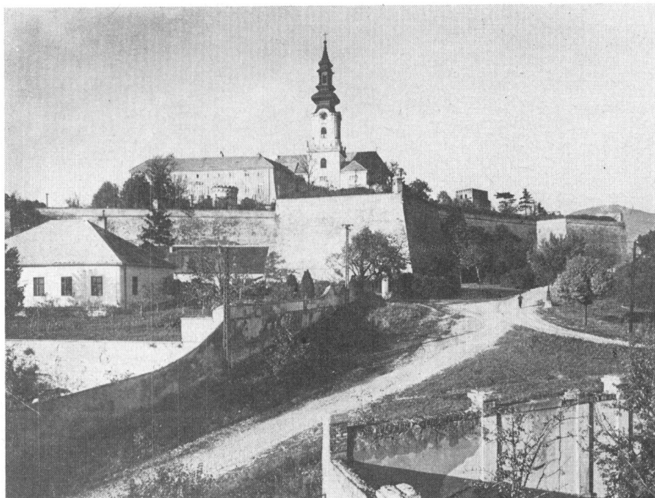
Obr. 1. Pohľad na areál nitrianskeho hradu s dominujúcou vežou. Foto 1955, archív ŠÚPS.

Napriek tomu, že k Nitre sa viaže z 9. storočia pochádzajúci najstarší údaj o existencii kostola na našom území, dodnes ho nevieme bezpečne lokalizovať. Z architektúr zachovaných na hrade je zatiaľ najstaršia známa stavba tzv. Pribino-