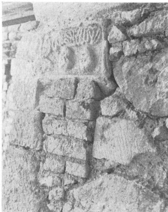
Obr. 2. Severovýchodné nárožie veže so sekundárne zamurovanou reliefnou hlavou z 11. storočia.

Pri plošnom odkryve sme zistili existenciu značného množstva sekundárne použitých kamenných profilovaných článkov, ktoré pochádzali zo starších stavebných etáp. V týchto troch postupne budovaných stavbách, sme našli profilované neraz i polychromované kamene renesančné, zo 16. storočia, gotické zo 14. ev. zač.