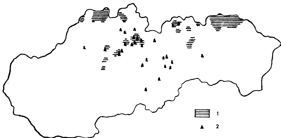
Mapa 2. Zvláštne formy tradičného domu na Slovensku. 1 – dom s bočnou komorou vedľa izby, 2 – dom s predelenou komorou na dva priestory.

Pražák spája prvú formu s novovekou valašskou kolonizáciou. Predpokladá, že ide o slovanský typ, ktorý táto kolonizácia priniesla na územie Slovenska zo slovanského východu (Pražák 1958, 332). Je pravdou, že ide o slovanský typ