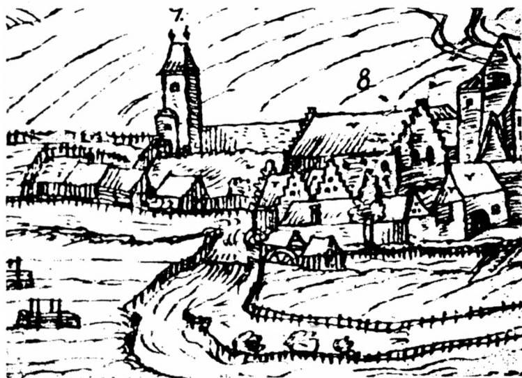
Obr. 3. Hospodářský dvůr v areálu plaského kláštera na vedutě J. Willenberga z poč. 17. století.

Domnívám se, že tento typ dvora, dokumentovaný prameny písemnými, archeologickými i ikonograficky, představuje ve 14. století universální režijní zařízení, jehož podoba se neváže na určitou vrchnost. Územní rozšíření dvora s propugnaculem by si zasloužilo podrobnější studium, zatím na základě ojedinelých analogií (Wiswe 1953, 79—81; Scholkmann 1978, obr. 57a) můžeme říci, že jeho výskyt zahrnoval kromě Čech i různé oblasti Německa. V Čechách je tento typ dvora doložen ve 14. a 15. století. Vzhledem k tomu, že ve své hotové podobě se představuje již na přelomu 13. a 14. století, lze vznik tohoto dvora předpokládat dříve. Jak hluboko do 13. století jej můžeme posunout, zatím není jasné. Horní hranice výskytu sledována nebyla.