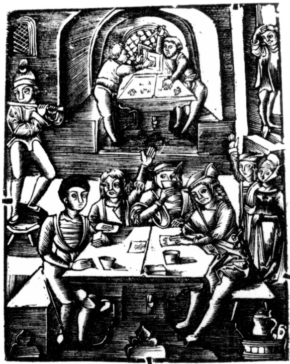
Obr. 6. Zábava v krčmě, dřevoryt z traktátu Pán rady, r. 1505, foto NK Praha.