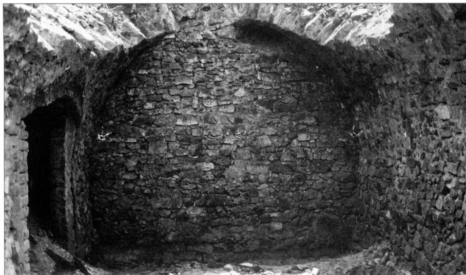
Obr. 3. Sklep z obj. čp. 15, ul. V Sadech, Praha 6-Bubeneč, foto M. Fokt.