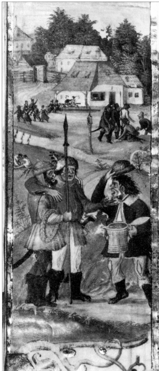
Obr. 10. Venkovan nese nádobu s víčkem, vyobrazení ze Žlutického kancionálu, okolo r. 1558, bez. sign., fol. 271b, PNP Praha, foto M. Fokt.

O důležitosti piva i pro další skupiny obyvatel svědčí samostatně vedený písemný materiál úřední povahy, totiž zachovaný pivní rejstřík z pol. 16. století z kláštera premonstrátů na Strahově (Pařez 1994, 104).