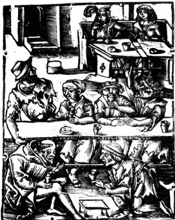
Obr. 5. Popíjející v krčmě, dřevoryt z traktátu Pán rady, r. 1505, foto NK Praha.