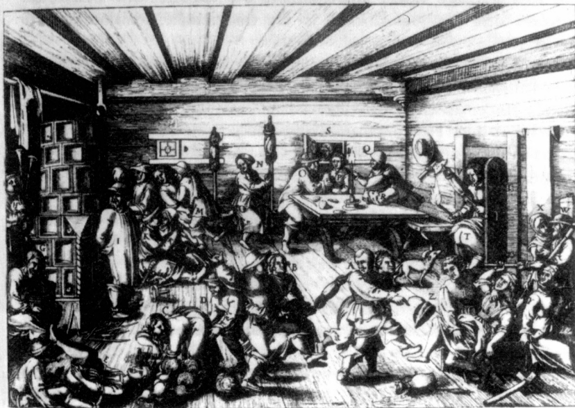
Obr. 7. Satira ze 16. století od H. S. Behama na necudné činnosti v přádelně a přástevně, evokující život v krčmě, podle R. van Dülmena 1990, foto M. Fokt.

Na výjevu z poč. 16. století vidíme v obyčejné krčmě nábytek lavicového typu a prostých stoliček vedle stolů s jednoduchou trnoží i poněkud složitěji vyřezávanou silnou nosnou spodní částí (obr. 5, 6).