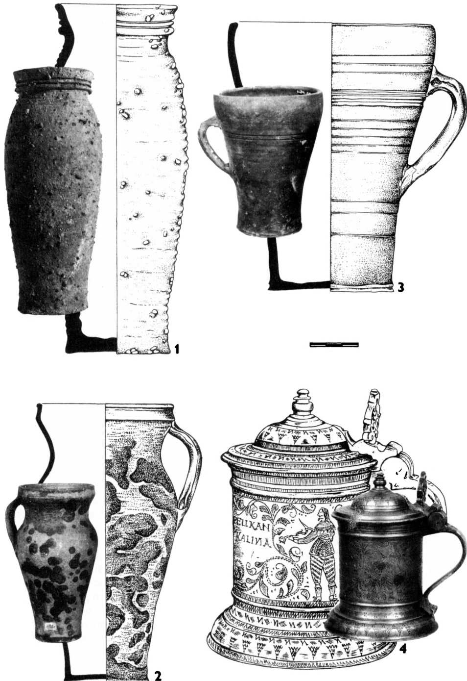
Obr. 9. Typy picích nádob: 1 – Loštický pohár, pol. 15. stol., i.č. 111 636, MMP; 2 – „Pražský“ pohár s uchem, konec 14.–pol. 15. stol., i.č. 4820, MMP; 3 – Pohár s uchem redukčního výpalu, 15. stol., PÚPP (Dragoun 1997, obr. 4); 4 – Čínová holba, pol. 17. stol., i.č. 3860, MMP; kreslí H. Pospíšilová a B. Neuberg, foto M. Fokt. (Uvedené měřítko odpovídá pouze kresbám.)