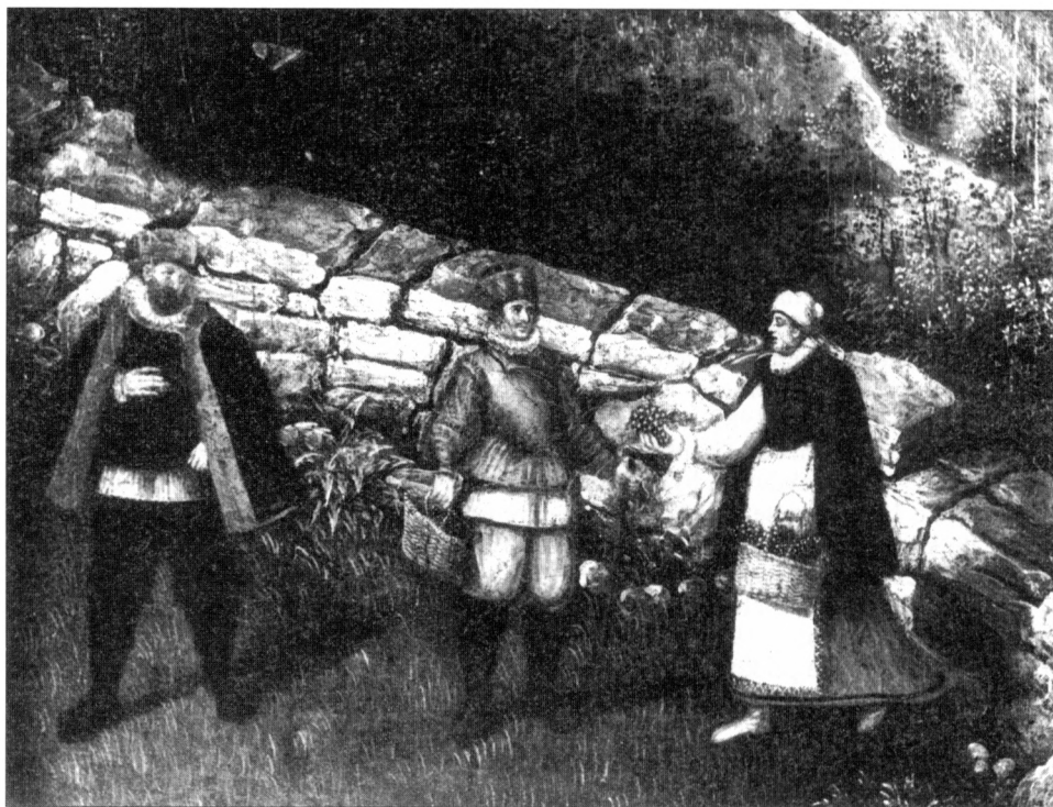
Obr. 1. Pražští vinaři, detail z Valckenborchova panoramatu Prahy, 1580, i.č. 20 685 MMP, foto M. Fokt.

V 16. a 17. století se prosazovaly stále více krčmy spojené pevně s určitou usedlostí, které měly povinnost mít v zásobě vždy pivo, a závazek čepování při změně držitele přejímal nový hospodář. Tento požadavek krčmářské povinnosti se zaváděl dlouho a ještě v 18. století byl součástí kontraktu. Vybíráme příklad z Neústupovského panství, kde musel krčmář „... piva přinejmenším jedno vědro ve forotě míti... “ (Fid. Neústupov, dominiální kniha č. 11, 1774–1806, SOA v Praze).