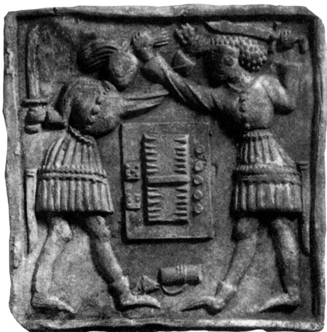
Obr. 8. Vyobrazení rváčů na dobře zachovaném kachli ze Sušice, podle Z. Smetánky 1968, foto M. Fokt.

alegoricky, ale výstižně bývá znázorněno na známé kachlové ikonografii z Prahy (Richterová 1982) či např. ze Sušice (Smetánka 1968; Hazelbauer 1992) (obr. 8). Mezi nejčastější hry v krčmě lze jednoznačně uvést hru v kostky, pak vrhcáby a v karty o peníze (Richterová 1983; Svátek–Štáhlavský 1989; Hájková 1997). Další hru zachycenou v Malostranském graduálu z r. 1572 (cf. obr. 4), představují patrně kuželky. Kuželky jsou připomínány již v 1. pol. 16. století, konkrétně r. 1529, kdy se v Letopise měšťana Nového Města pražského popisuje, že „...po sv. Vítě (19. června)... udeřil hrom na klášter sv. Barbory v Praze. Co zasáhl, to vše zbořil a vyrazil, že v zemi jako kule kuželková díry byly...“ (Zilynskij 1984, 66).