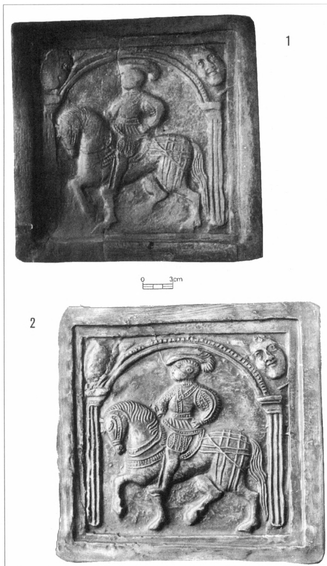
Obr. 2. Kamnářská matrice z města Horažďovice, okr. Klatovy. Originální historický kamenný kachel, vyrobený z matrice. Hrad Rabí, okr. Klatovy (1). Novodobý ideální a částečně upravený sádrový pozitivní otisk z matrice (2).

né z jednoduše kanelovaných sloupků, na které shora nasedá zdvojený půlkruhový oblouk s prostou ozdobou ve tvaru drobného promačkávání. V jednom z horních rohů plochy (druhý se nezachoval) je zobrazena velká lidská hlava s usmívajícím se obličejem. Tato strana matrice má černou barvu, pouze její menší části jsou světle hnědé, jak to odpovídá základní barvě její vypálené keramické hmoty (obr. 1:1).