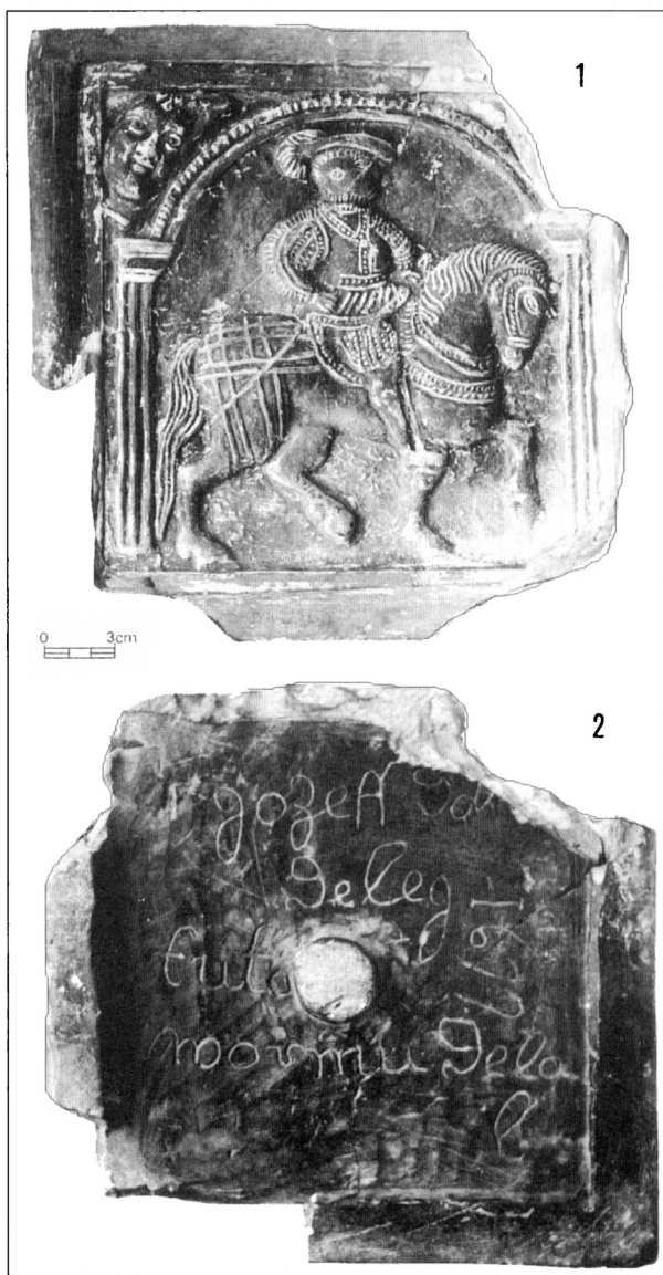
Obr. 1. Kamnářská matrice z města Horažďovice, okr. Klatovy. Přední negativní reliéfní plocha (1), zadní plocha s opěrným systémem a rytým nápisem se jménem hrnčíře a datací (2).

motné matrice. Zcela unikátním artefaktem je z tohoto hlediska kachlová matrice, zachovaná prakticky v celém rozsahu, doplněná signaturou svého výrobce a údajným datem své výroby.