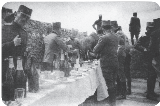
12. Důstojnický život v zázemí na konci roku 1917.