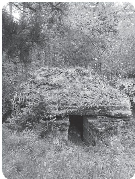
14. Bulharský betonový srub na svazích Pelisteru na kótě 1250 m. n. m.

Maročtí spahiové a další africká jízda z francouzských koloniálních sborů se poté významenali ještě během průlomu soluňské fronty, kdy v roli předvoje srbské druhé armády dorazili do Skopje a překvapili tamní soustředění bulharských a německých vojsk (Olejnikov 2002 b).