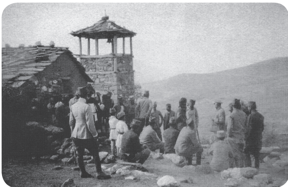
9. Štáb Dunajské divize u kostelíku v Gruništi 31. 12. 1917.