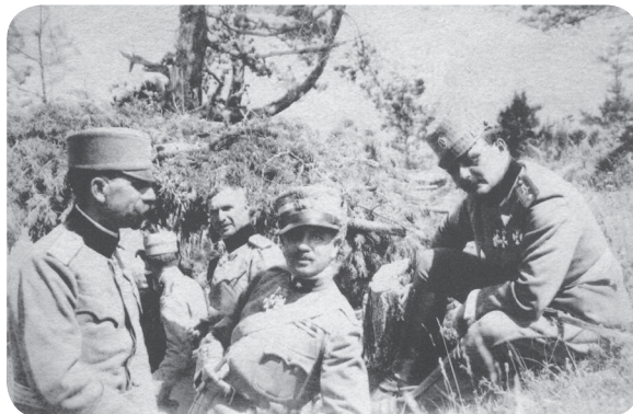
13. Srbští důstojníci na pozorovatelně řeckého krále Alexandra I.

nakonec neodolaly bulharskému protiútoků a byly nuceny se stáhnout do výchozího postavení (Simić 2008:11).