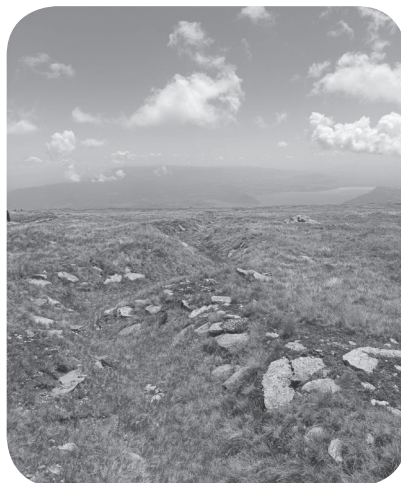
5. Spojovací zákop pod vrcholem Kajmakčalanu. V pozadí je vidět Ostrovsko jezero.