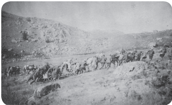
16. Baterie 75mm děl vyvážená na postavení před útokem na Dobro polje, kde byl učiněn zásadní krok k průlomu Soluňské fronty.