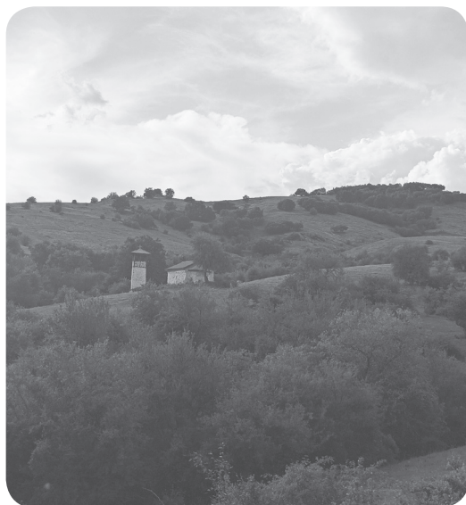
10. Kostelík v Gruništi dnes.

odeslán z fronty k rekonvalescenci na ostrov Korfú, viděl cestou přes Řecko vlaky s řeckými dobrovolníky: „...potkávali jsme cestou transporty řeckého vojska; vojáků jsme však neviděli, protože byli transportováni v zaplombovaných vozech dobytčích, aby se cestou do Soluně nerozběhli. V Řecku nebylo totiž chuti do války a tato nálada přenesla se samozřejmě i na vojsko; aby nenastala revolta, použily vojenské úřady tohoto opatření. Jen ve větších, předem určených stanicích, byly vozy odplombovány, mužstvo pod dozorem spojeneckých četníků vypuštěno po částech k vykonání potřeby, znovu naloženo a zaplombováno. Pak se pokračovalo v jízdě. Odvody byly prováděny násilím, poněvažž dobrovolně se hlásilo a nastupovalo velmi málo branců; mnoho jich před odvodem prchlo do hor, kde na ně byly pořádány přímo hony“ (Švyhnos 1935: 87–88).