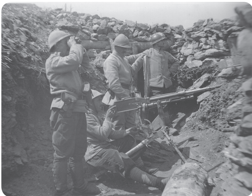
11. Srbští kulometčíci třetího pluku šumadijské divize na postavení v horách Nidže. Kulomet je francouzské výroby Saint-Etienne vz. 1907. Fotografie z publikace Drašković 2014.