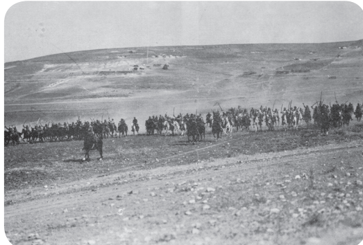
17. Útok srbské jízdní divize při pronásledování bulharské armády po průlomu Soluňské fronty.

O tom, jak vypadal běžný zákopový život, si můžeme udělat představu ze vzpomínek českých účastníků soluňské fronty: