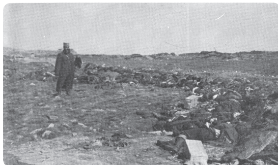
4. Generál Jiří Lazič po bitvě na vrcholu Kajmakčalanu.