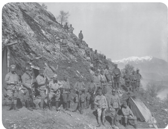
8. Posádka jednoho z postavení 10. pěšího pluku Šumadijské divize v části pohoří Nidže zvané Veternik.

a tímto vítězstvím snad přimět i kolísající Řecko, aby se naopak přidalo na bulharsko-německou stranu. Hned 17. srpna tedy první bulharská armáda „preventivně“ udeřila s velkou přesilou na levé křídlo fronty, hájené srbskou třetí armádou, a také na slabý východní úsek od Dojranského jezera na jihovýchod, obsazený francouzsko-britskými silami, které se předtím v ofenzívě mezi 9. a 16. srpnem pokusily právě u Dojranského jezera o průlom fronty.