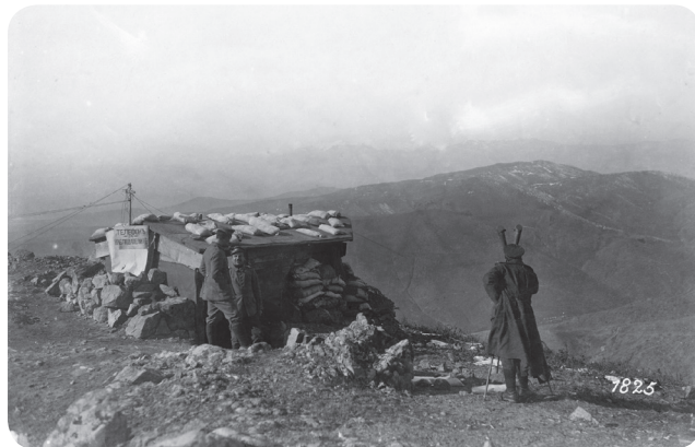
2. Bulharská pozorovatelna v postavení nad Dojranským jezerem v březnu 1917. https://commons.wikimedia.org/wiki/File:Doiran_Front.jpg .

Vuka s 2 250 muži, složený z komitů a bývalých rakousko-uherských vojáků (včetně českých), kteří po svém zajetí přešli na srbskou stranou, popř. se do oddílu začlenili ti, kteří na počátku války pracovali nebo žili v Srbsku a rozhodli se pro srbskou opci, jeden prapor pak byl tvořen dobrovolníky z Černé Hory a Hercegoviny. Dobrovolnický oddíl byl součástí třetí armády. Není bez zajímavosti, že dobrovolnický oddíl přešel Albánii z celé armády nejorganizovaněji a bez zásadních ztrát a jako jediný byl schopen bez větší regenerace dalších akcí (Sekulić 2007; Houžvic 1928: 99–135). Dohromady čítalo srbské vojsko 152 000 mužů (Radojević – Dimić 2014: 191), podle jiných informací 147 000 mužů, včetně 23 000 mužů týlového zabezpečení. Do řecké Makedonie byli na francouzských lodích převezeni mezi 14. dubnem a 16. květnem 1916 (Zorić 2018: 11). Z této masy vojáků bylo však