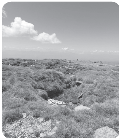
6. Dělostřelecká postavení na hřebeni pod Kajmakčalanem.