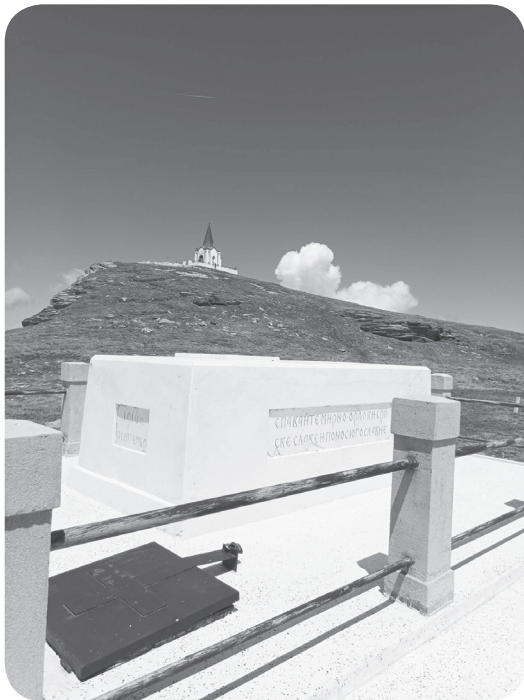
3. Krypta (kostnice) padlých při bojích o Kajmakčalan 1 .