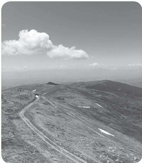
7. Stará vojenská cesta na hřebeni pod vrcholem Kajmakčalanu.