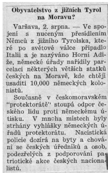
Obr. 3: Článek z československého zahraničního tisku (Svornost, Chicago) z 3. 8. 1939 informující o usazení jihotyrolských Němců na jižní Moravě.