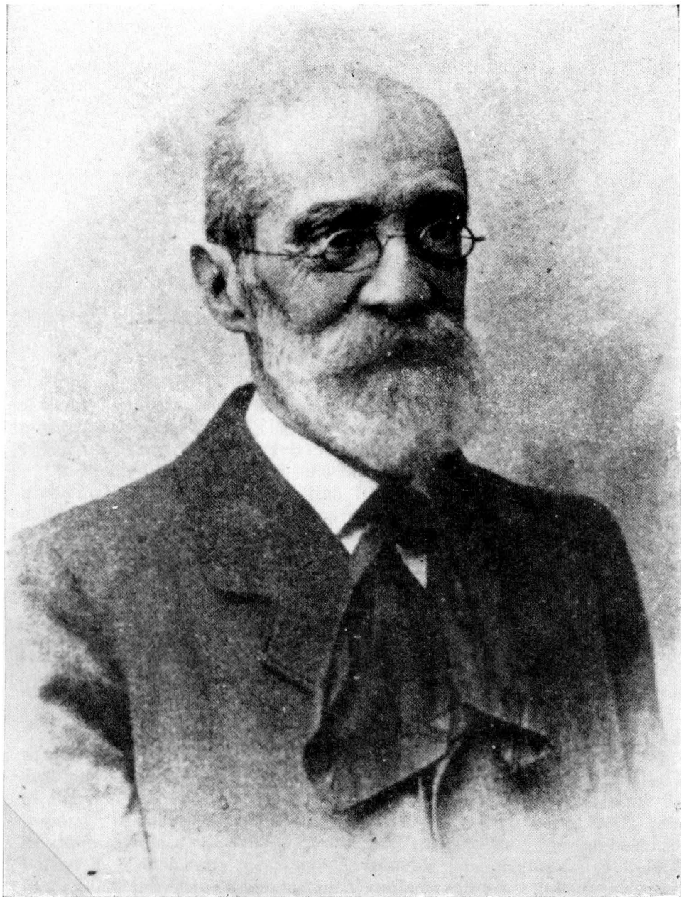
EMILIO TEZA (1831—1912)