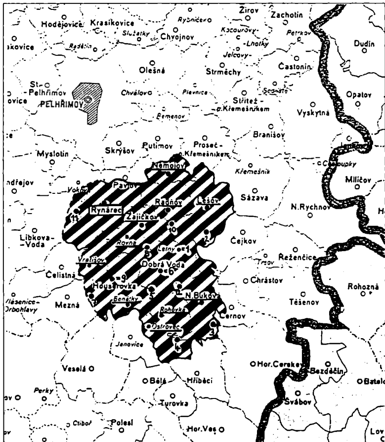
Mapka č. 1 – legenda: