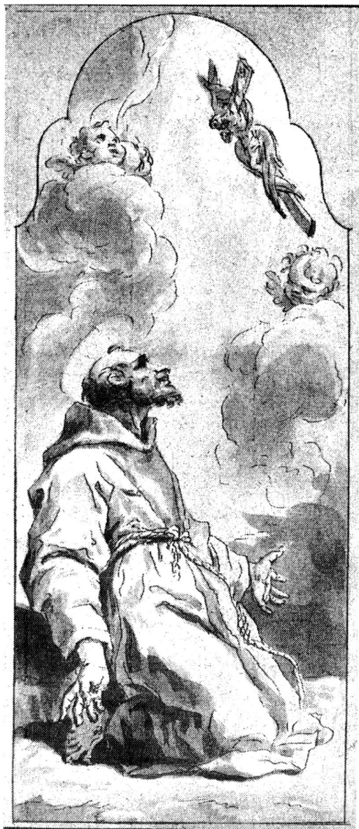
1. Michelangelo Unterberger, Stigmatizace sv. Františka z Assisi . Moravská galerie Brno. Michelangelo Unterberger, Stigmatization of St. Francis . Moravská galerie Brno.