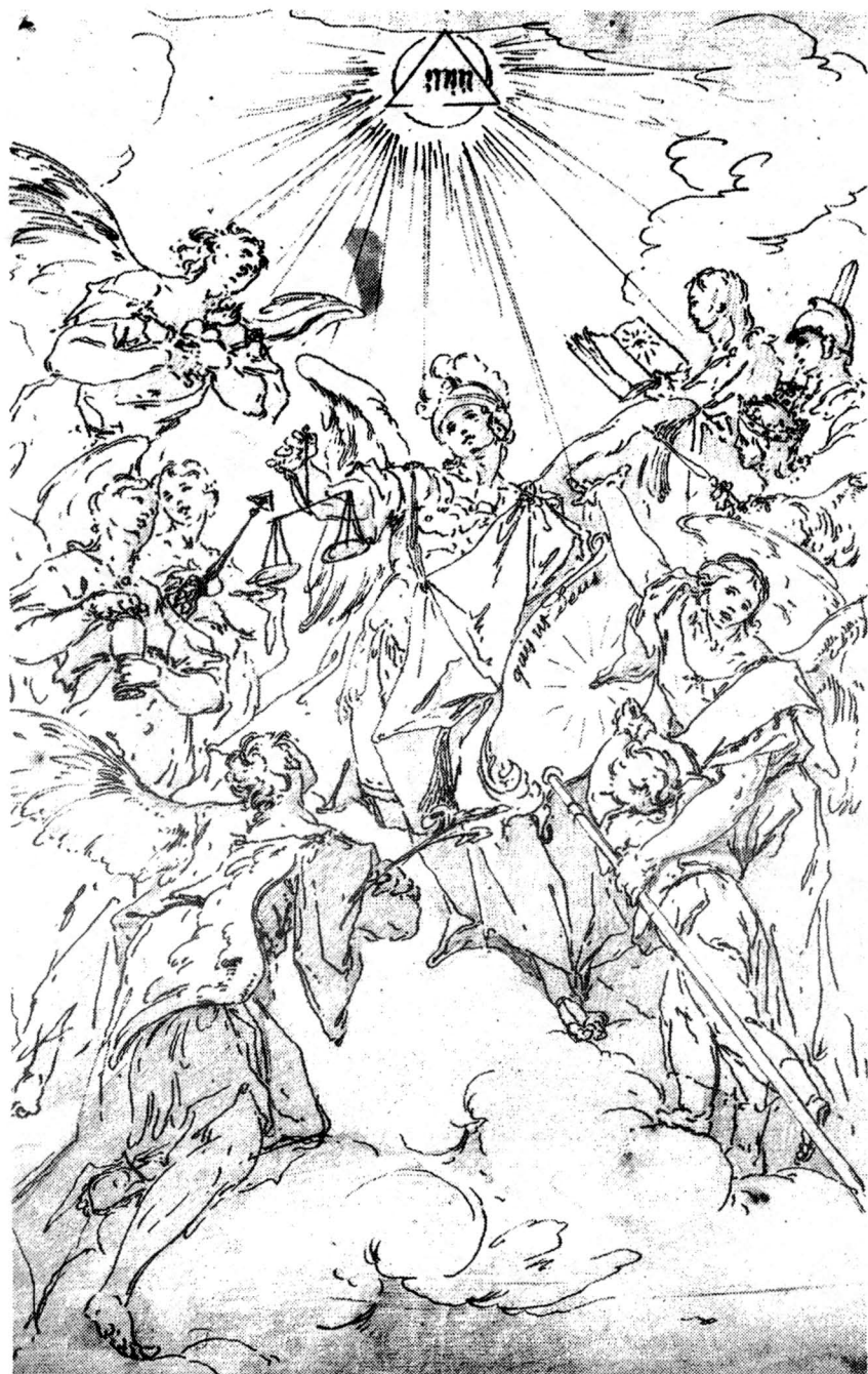
5. Paul Troger — následovník, Sv. Raffael, Michael a Gabriel . Národní galerie v Praze. Follower of Paul Troger, Archangel Raphael, Michael and Gabriel . Národní galerie v Praze.