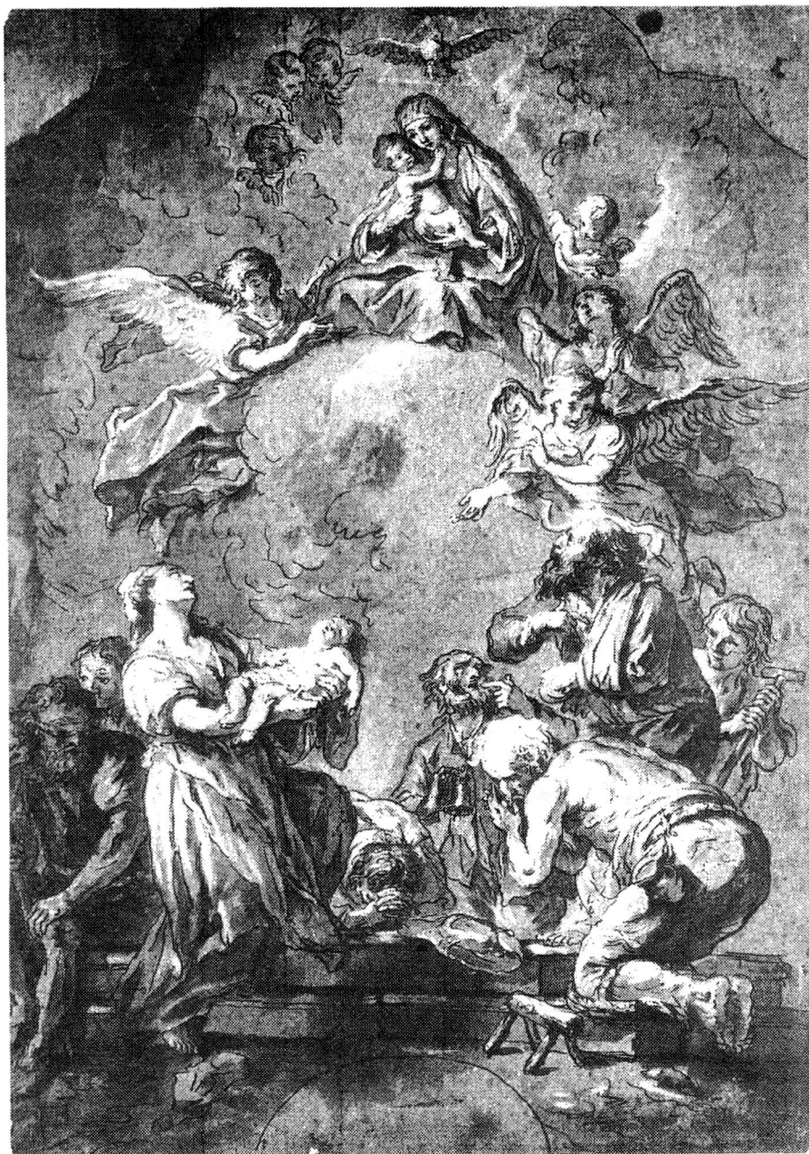
4. Franz Xaver Wagenschön, Adorace P. Marie Pomocné (podle obrazu Johanna Martina Schmidta, zv. Kremerserschmidt). Moravská galerie Brno.

Franz Xaver Wagenschön after Johann Martin Schmidt, called Kremser Schmidt, Adoration of Madonna from Passau . Moravská galerie Brno.