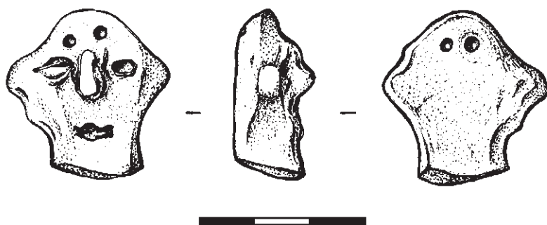
Obr. 2. Brodek u Prostějova – „Hůrka“. Fragment antropomorfní plastiky. Kresba D. Švalbachová.