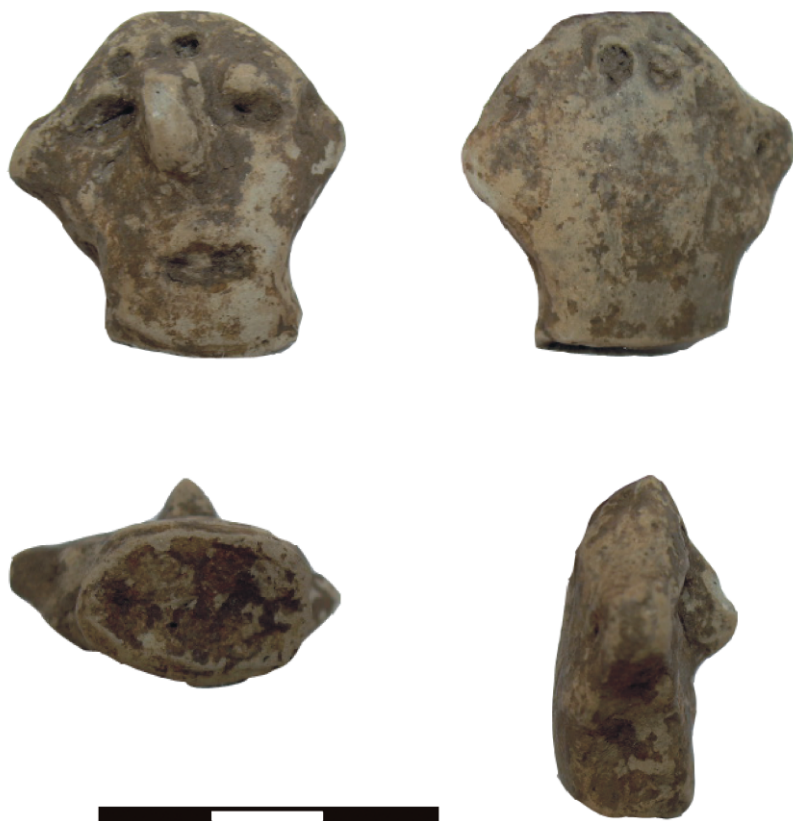
Obr. 3. Brodek u Prostějova – „Hůrka“. Fragment antropomorfní plastiky LnK.