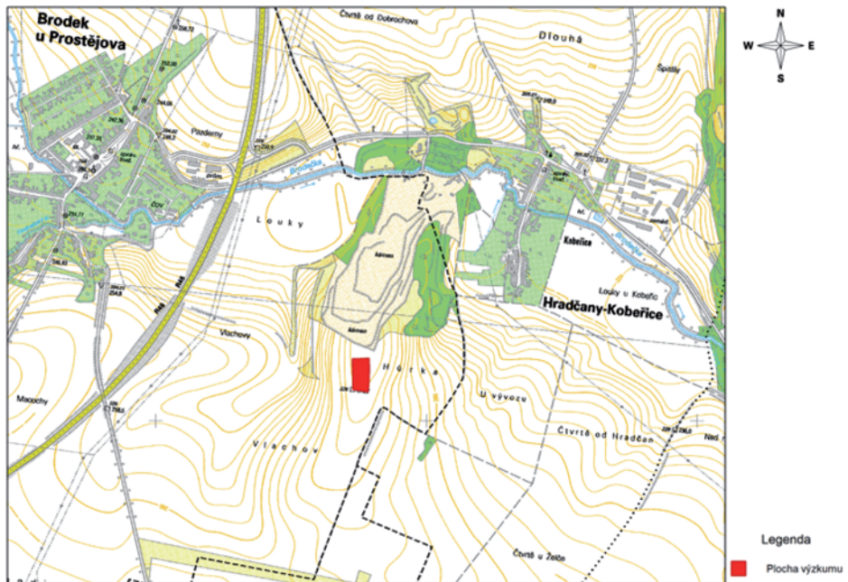
Obr. 1. Brodek u Prostějova – „Hůrka“. Poloha lokality (podle P. Dreslera).

V roce 2005 byl pod vedením T. Berkovce z Archeologického centra Olomouc proveden záchranný archeologický výzkum v Brodce u Prostějova, v trati „Hůrka“ (obr. 1). V jednom ze sídlištních objektů patřících kultuře s lineární keramikou (LnK) byl nalezen fragment antropomorfní plastiky (obr. 2, 3). V článku se budu zabývat tímto konkrétním nálezem, pokusím se jej srovnat s podobnými plastikami nejen ze střední Evropy a zjistit tak možný původ brodecké plastiky.