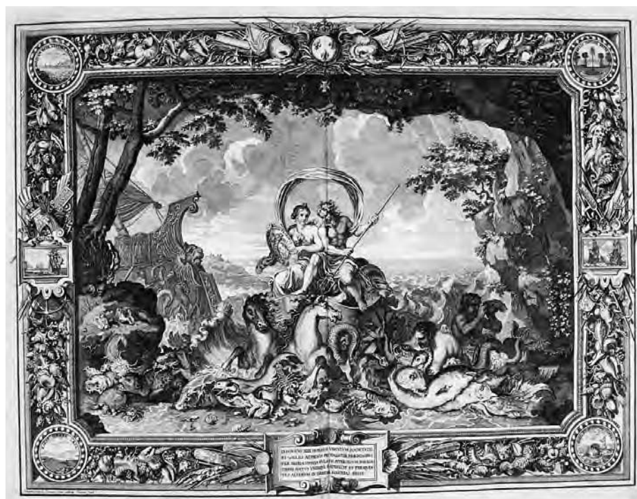
14 – Johanna Sibylla Küsel podle Sébastiena Le Clerca, Personifikace Vody . Johann Ulrich Krauss, Tapisseries du Roy [...] oder Königliche französische Tapezereyen [...] , Augsburg: Jacob Kopfmayer, 1690

oheň elementární (Jupiter) a oheň materiální (či pozemský – Vulkán). Zbraně, odkazující na válečnou symboliku, dotváří motiv sopky Etny, která má představovat osmanskou moc. Sopka kolem sebe šíří zkázu na okolní země, avšak jak dokládají zelené stromy kolem, vláda francouzského krále vše zlé obrací v dobré.