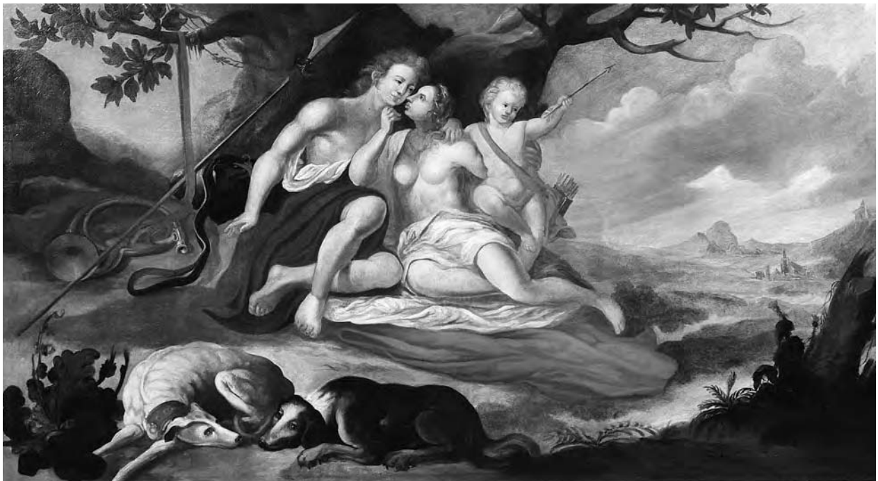
8 – Venuše a Adónis, počátek 18. století, státní zámek Milotice, svaz Lomnice

dobněji spojit s rodovým sídlem v Lomnici a lomnickou větví rodu, což podporují i inventární záznamy, popisující v několika místnostech větší množství obrazů, zapojených do paneláží. 28 Časově doba vzniku maleb zapadá do období života hraběte Antonína Amata Serényiho (1670–1738), [obr. 5] což podporuje i drobný detail na kompozici Atalanty a Hippome-