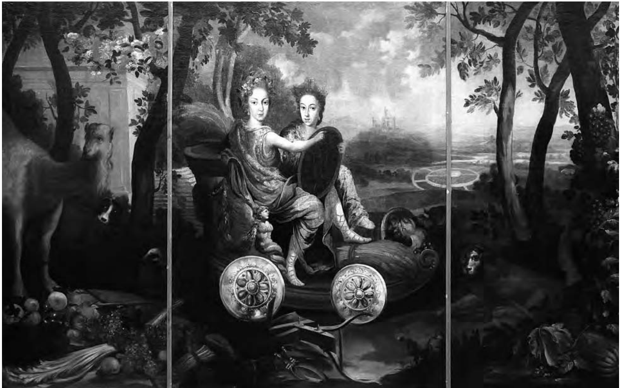
16 – Personifikace Země, po 1702. Státní zámek Mílotice, svaz Lomnice

válečnickou symbolikou, mohlo odkazovat na skutečnost, že byla matkou dvou nejvýznamnějších současných představitelů rodu, kteří se proslavili na bitevním poli jako velitelé císařské armády.