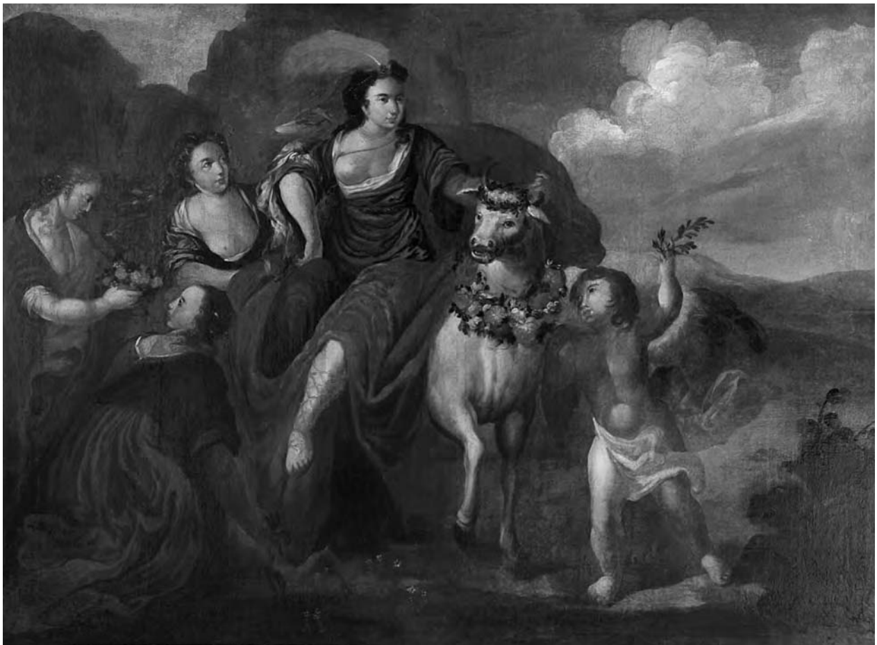
3 – Únos Európe, počátek 18. století. Státní zámek Lysice, svaz Lomnice

ruhodně přítomné v uměleckých objednávkách barokních Serényiů, kde se ve východiscích jejich mocenské reprezentace střetávala potřeba historické reflexe s aktuální závislostí na formách kulturní orientace habsburských politických a vojenských elit.