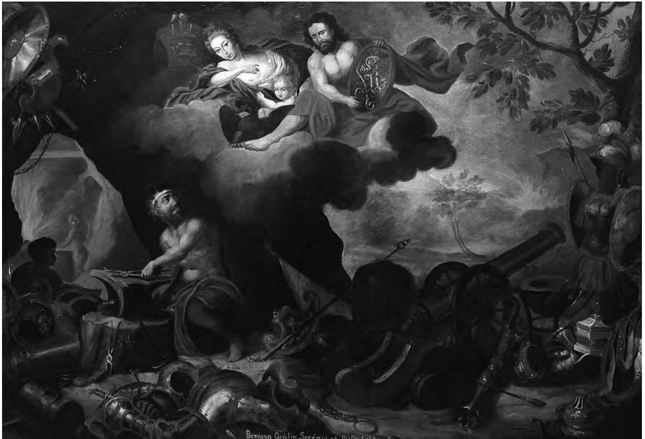
12 – Personifikace Ohně, po 1702, státní zámek Lysice, svoz Lomnice

royale des meubles de la Couronne). Výsledné tapisérie, vytvořené mezi léty 1666–1669 a objednané Ludvíkem XIV. pro královské apartmány ve Versailles se staly předlohou pro sérii grafických listů Sébastiena Le Clerca (1637–1714), [obr. 10, 13, 14, 17] kterou doplnil oslavný a vysvětlující text z pera André Félibiena (1619–1695). Text, vzešlý z prostředí Colbertem založené la Petite Académie , hodnotil celou ikonografickou koncepci královských tapisérií včetně připojených devíz a emblémů. Zkompletovaný svazek byl publikován opakovaně od roku 1670 pod názvem Tapisseries du Roy a nedlouho po francouzských edicích se dočkal svých reedic v augsburském vydavatelství Johanna Ulricha Krausse, kde byl původní text opatřen paralelním německým překladem (v Augsburgu vydán roku 1687 a 1690). Kopie původních rytin do německého vydání opatřila Johanna Sibylla Krauss, rozená Küsel. 31