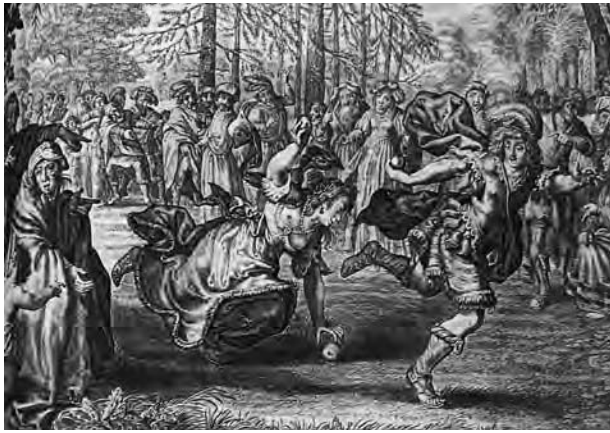
6 – Atalanta a Hippoménés . Pierre Du-Ryer, Les Metamorphoses d'Ovide en latin et en français divisées en XV. livres , Bruxelles: François Foppens, 1677