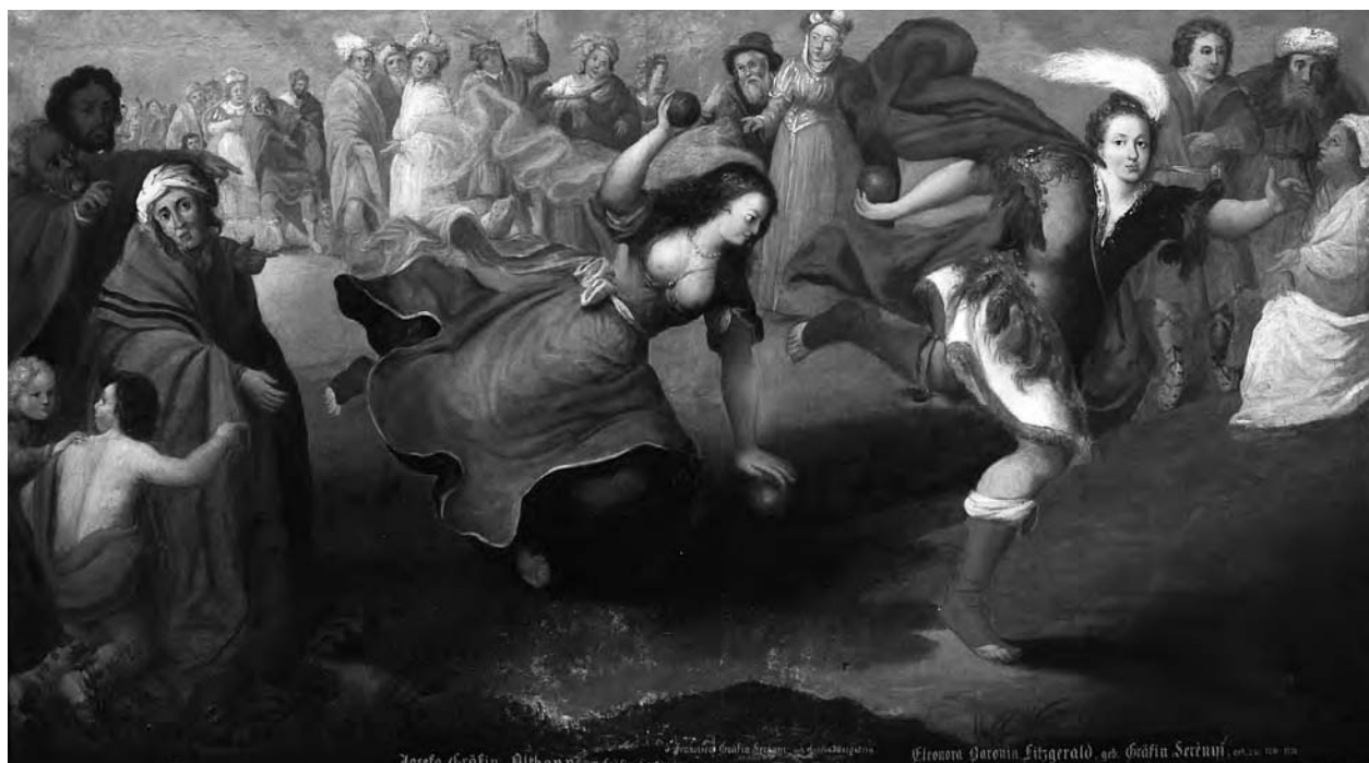
7 – Atalanta a Hippoménés, počátek 18. století. Státní zámek Lysice, svaz Lomnice

ohledání potvrzují nejen odlišná předlohová a ikonografická východiska, ale rovněž jejich pravděpodobné rozdílné objednatelské pozadí. První soubor se skládá z osmi kusů a námětově čerpá z textu Ovidiových Metamorfóz , konkrétně z knihy I. ( Zlatý věk , Gigantomachie ) [obr. 2] z knihy II. ( Únos Európe ) [obr. 3] z knihy III. ( Narcis ), knihy VIII. ( Théseus u Achelóa ), knihy X. ( Atalanta a Hippoménés [obr. 7], Venuše a Adónis [obr. 8]), a z knihy XIII. ( Paridův soud ). 25 Ovidiovské kompozice, jak ostatně dokládá jejich nepřilíš vysoká kvalitativní úroveň, nepřinášejí invenční zpracování, nýbrž se do detailu opírají o grafické ilustrace k Ovidiovým Metamorfózám . Z obrovské šire grafických cyklů k raně novověkým edicím Ovidiových Metamorfóz byly coby vzor pro serényiovské malby vybrány rytiny velkoformátového tisku Metamorfóz , vydaného Françoisem Foppensem v Bruselu roku 1677. Vydání obsahovalo vedle latinských veršů francouzský překlad a komentář z pera Pierra Du Ryera a v ilustrační složce celkem 123 grafik antverpských rytců Martina Bouche, jeho bratra Petra Pavla, Frederika Bouttatse, Petera Clouweta a Hendrika Abbé (kteří využili starších nevydaných předloh holandských umělců předešlé generace – Magdaleny de Passe, Cripsijna de Passe ml., Willema de Passe, Theodora Mathama a Frederika Bloemaerta. 26 [obr. 1, 4, 6, 9]