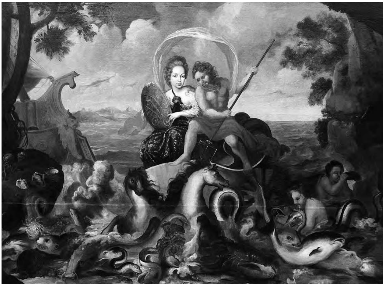
15 – Personifikace Vody, po 1702. Státní zámek Milotice, svoz Lomnice

couzskému dvoru je tu pochopitelně zcela potlačena, o čemž svědčí odstranění veškerých přímých narážek na osobu krále, tedy heraldických symbolů a emblémů, které byly součástí bohaté bordury tapisérií. Lze však předpokládat, že zachována zůstala obecná myšlenková konstrukce, akcentující reprezentaci a oslavu osoby objednavatele, což dokládají obsažené identifikační portréty a heraldická výzdoba štítů.