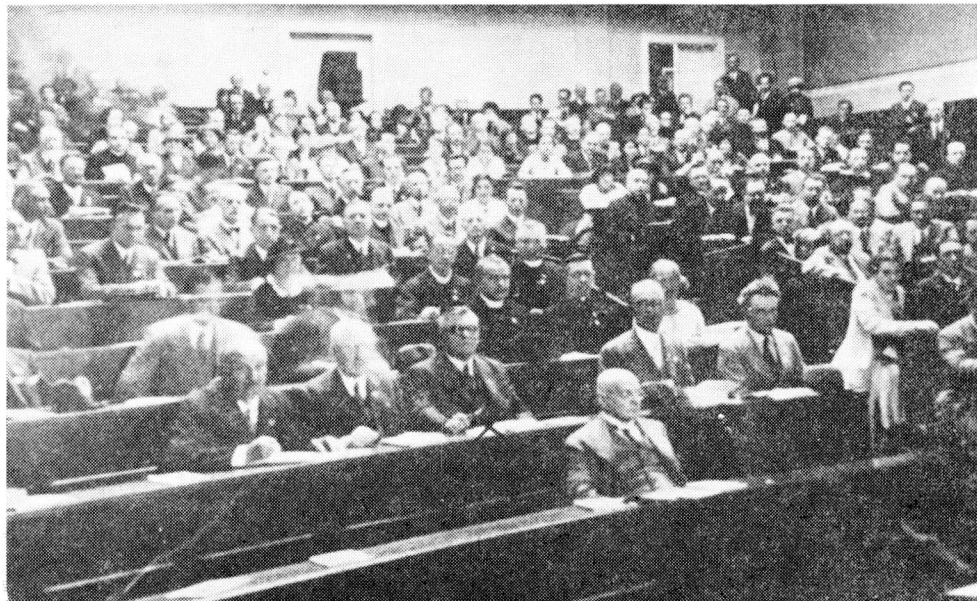
Obr. 4. Mezinárodní filozofický kongres v Praze v roce 1934