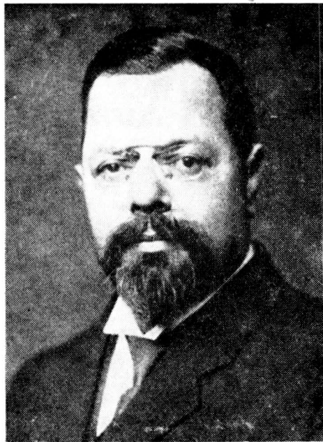
Obr. 14. Otakar Zich