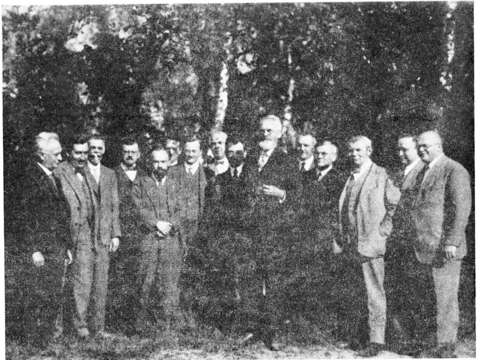
Obr. 3. Profesorský sbor filozofické fakulty Komenského univerzity v Bratislavě (30. léta)