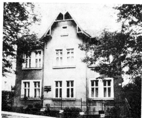
Obr. 11. Dům č. 8 na Lípové ulici v Brně (dnešní Tvrďého ulice)