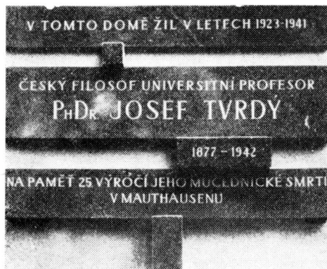
Obr. 12. Pamětní deska na domě č. 8 na Tvrďého ulici