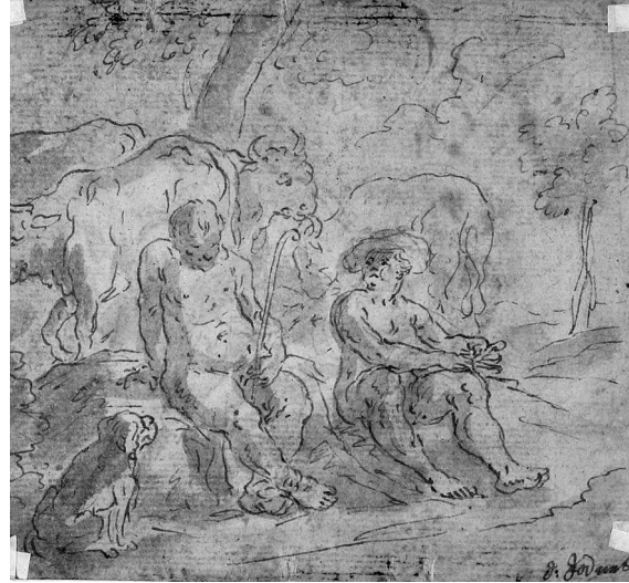
Abb. 10: Franz Xaver Wagenschön, Hirtenszene , Rückseite von Heilige Familie , Oberösterreichischer Privatbesitz.

greift Wagenschön hier, wie auch in vielen anderen Fällen, auf Rubens zurück, und er folgt seinem Vorbild vor allem in der formal weich fließenden Linienführung der Zeichnung, die durch die Lavierung noch eine zusätzliche malerische Note bekommt.