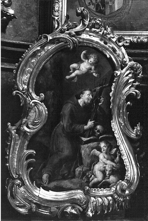
Abb. 17: Franz Xaver Wagenschön, Hl. Franz von Assisi, Wien, Paulanerkirche.