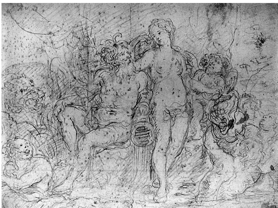
Abb. 12: Franz Xaver Wagenschön, Neptun und Amphitrite, Vorderseite, Linz, Nordico-Museum.