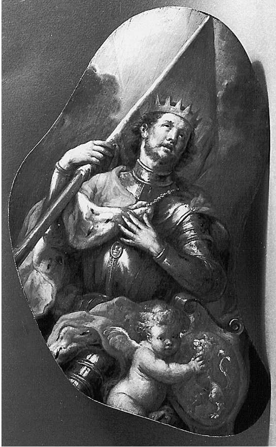
Abb. 19: Franz Xaver Wagenschön, Hl. Wenzel, Wien, Paulanerkirche.