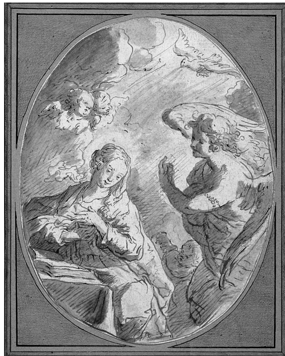
Abb. 8: Franz Xaver Wagenschön, Verkündigung an Maria , Oberösterreichischer Privatbesitz.

Schon Wurzbach weist auf Zeichnungen Wagenschöns hin, von denen mehrere auf der Kunstausstellung der k. k. Akademie der bildenden Künste im Jahre 1877 ausgestellt waren. 23 Außerdem erwähnt er auch Radierungen, von denen ungefähr zwanzig Blätter als bekannt galten. Die Zeichnungen Wagenschöns sind, wie auch seine Gemälde, weit verstreut und befinden sich u. a. in der Albertina und in der Graphischen Sammlung der Akademie der Bildenden Künste in Wien, im Museum der Stadt Linz, im Joanneum in Graz, im Museum der Bildenden Künste in Budapest, in der Nationalgalerie in Prag, im Kupferstichkabinett in Berlin, im Germanischen Nationalmuseum in Nürnberg und in