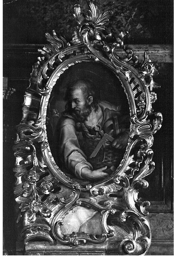
Abb. 16: Franz Xaver Wagenschön, Hl. Josef, Wien, Paulanerkirche.

von Padua, dem das Jesuskind erscheint, am rechten rückwärtigen Seitenaltar.