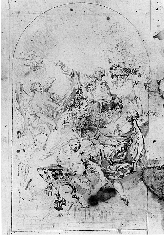
Abb. 5: Franz Xaver Wagenschön, Glorie des hl. Karl Borromäus , Nürnberg, Germanisches Nationalmuseum.

Germanischen Nationalmuseum in Nürnberg 20 ein Entwurf für ein nicht mehr erhaltenes Altarbild in Temeswar, denn der nur skizzenhaft angedeuteten Stadtkulisse am unteren Bildrand scheint ein barocker Kupferstich mit der Ansicht der Stadt Temeswar zugrunde zu liegen. Der hl. Karl Borromäus kniet auf einer Wolke, hält seine Hände ausgebreitet und blickt nach oben, von wo sich aus dem Himmel Lichtstrahlen auf sein Gesicht ergießen. Der Heilige wird von zwei großen Engeln flankiert, die in ihrer Art ganz charakteristisch für Wagenschön sind; gleiches gilt auch für die zwei schwebenden Engelsputten zu seinen Füßen. Auch diese Bildkomposition zeigt eine große Ähnlichkeit mit