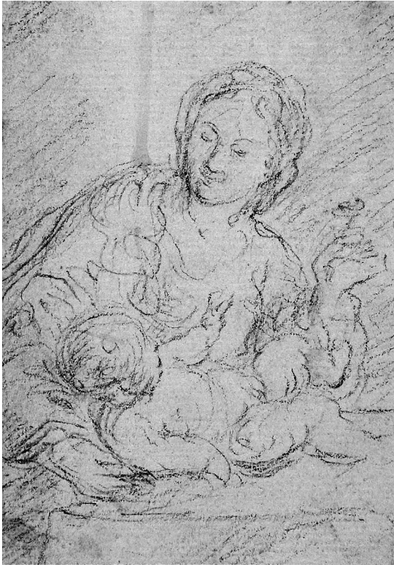
Abb. 11: Franz Xaver Wagenschön, Madonna mit Jesuskind, Oberösterreichischer Privatbesitz.