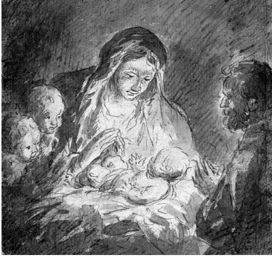
Abb. 9: Franz Xaver Wagenschön, Heilige Familie , Oberösterreichischer Privatbesitz.