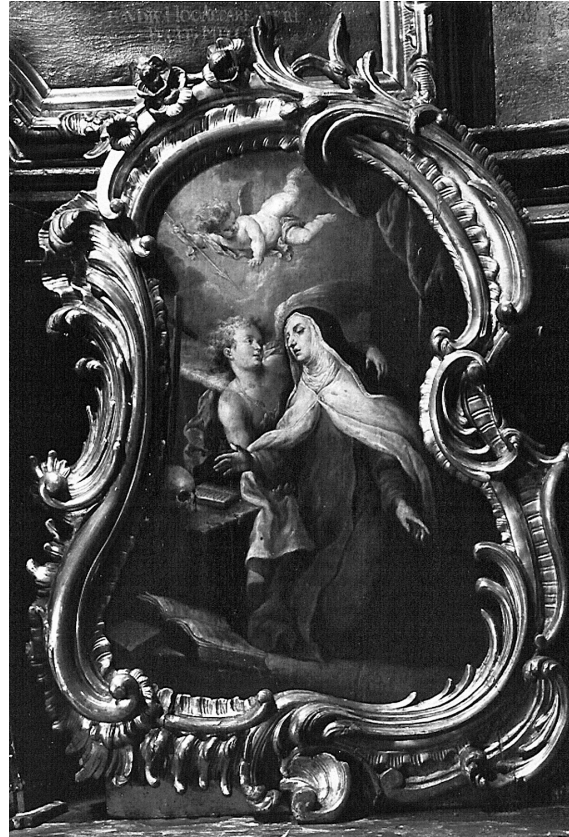
Abb. 18: Franz Xaver Wagenschön, Hl. Theresia von Avila, Wien, Paulanerkirche.

sie jener Gruppe von Kabinettbildern zuzurechnen, die Slavíček in einem seiner Wagenschön-Beiträge publiziert hat. 37 Die Bilder sind zwar alle aufgrund ihres Malstils zweifelsfrei als Werke Wagenschöns zu erkennen, aber auf einem Bild konnte, gleichsam als Bestätigung, doch auch das Monogramm des Künstlers festgestellt werden. 38