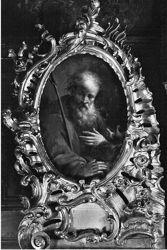
Abb. 15: Franz Xaver Wagenschön, Hl. Joachim, Wien, Paulanerkirche.