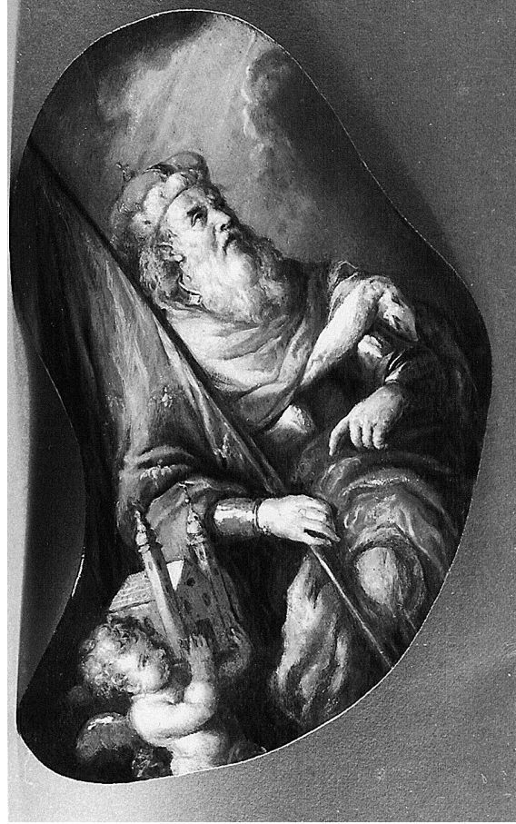
Abb. 20: Franz Xaver Wagenschön, Hl. Leopold, Wien, Paulanerkirche.

rer Entrückung zu halten. Über ihr schwebt noch ein Engelsputto mit dem brennenden Herzen in der einen und einem auf die Brust der Heiligen gerichteten Pfeil in der anderen Hand.