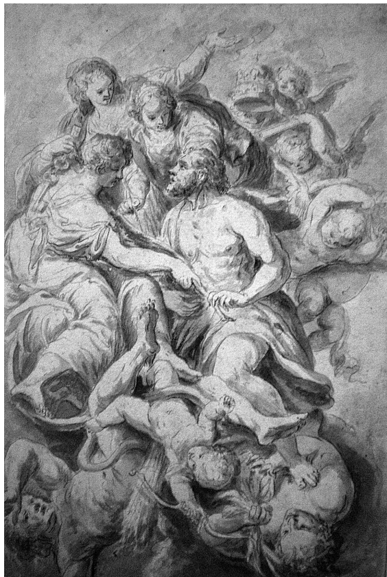
Abb. 7: Franz Xaver Wagenschön, Glorie des Apostels Petrus , Oberösterreichischer Privatbesitz.

Schon Wurzbach weist auf Zeichnungen Wagenschöns hin, von denen mehrere auf der Kunstausstellung der k. k. Akademie der bildenden Künste im Jahre 1877 ausgestellt waren. 23 Außerdem erwähnt er auch Radierungen, von denen ungefähr zwanzig Blätter als bekannt galten. Die Zeichnungen Wagenschöns sind, wie auch seine Gemälde, weit verstreut und befinden sich u. a. in der Albertina und in der Graphischen Sammlung der Akademie der Bildenden Künste in Wien, im Museum der Stadt Linz, im Joanneum in Graz, im Museum der Bildenden Künste in Budapest, in der Nationalgalerie in Prag, im Kupferstichkabinett in Berlin, im Germanischen Nationalmuseum in Nürnberg und in