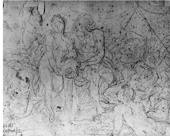
Abb. 13: Franz Xaver Wagenschön, Neptun und Amphitrite, Rückseite, Linz, Nordico-Museum.