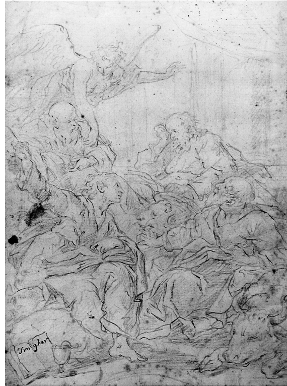
Abb. 6: Franz Xaver Wagenschön, Die vier Evangelisten , Entwurf für Gemälde in der Pfarrkirche von Wien-Mauer, XXIII. Bezirk. Landesmuseum Joanneum, Alte Galerie, Graz. Privatbesitz.

Germanischen Nationalmuseum in Nürnberg 20 ein Entwurf für ein nicht mehr erhaltenes Altarbild in Temeswar, denn der nur skizzenhaft angedeuteten Stadtkulisse am unteren Bildrand scheint ein barocker Kupferstich mit der Ansicht der Stadt Temeswar zugrunde zu liegen. Der hl. Karl Borromäus kniet auf einer Wolke, hält seine Hände ausgebreitet und blickt nach oben, von wo sich aus dem Himmel Lichtstrahlen auf sein Gesicht ergießen. Der Heilige wird von zwei großen Engeln flankiert, die in ihrer Art ganz charakteristisch für Wagenschön sind; gleiches gilt auch für die zwei schwebenden Engelsputten zu seinen Füßen. Auch diese Bildkomposition zeigt eine große Ähnlichkeit mit