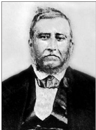
Иллюстрация 1 Джузеппе Де Рубертис

E Drinoff? Ni govere , ni piša! Što čini? Zaspel! Blago njemu! Kada mu pišaš, 39 potežimu uše! Zdravo