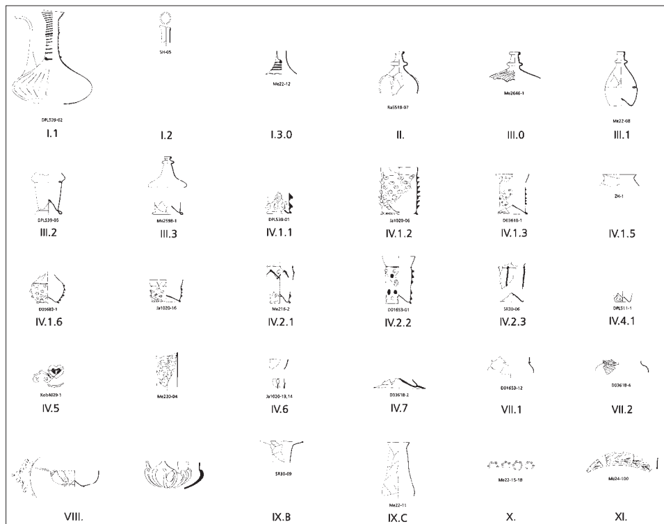
Obr. 2. Typy skla v období Přemyslovců. Zpracovala L. Sedláčková (Glass 2010, Table 1; doplněno podle Sedláčková 2003 a Sedláčková 2005).