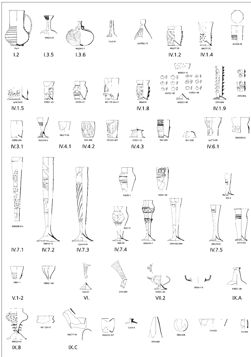
Obr. 5. Typy skla v době Matyáše Korvína a za Jagellonců. Zpracovala L. Sedláčková (Glass 2010, Table 4).