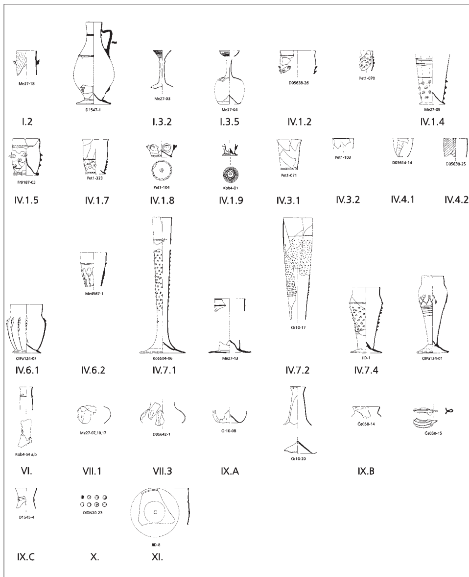
Obr. 4. Typy skla v době husitské a pohusitské. Zpracovala L. Sedláčková (Glass 2010, Table 3).