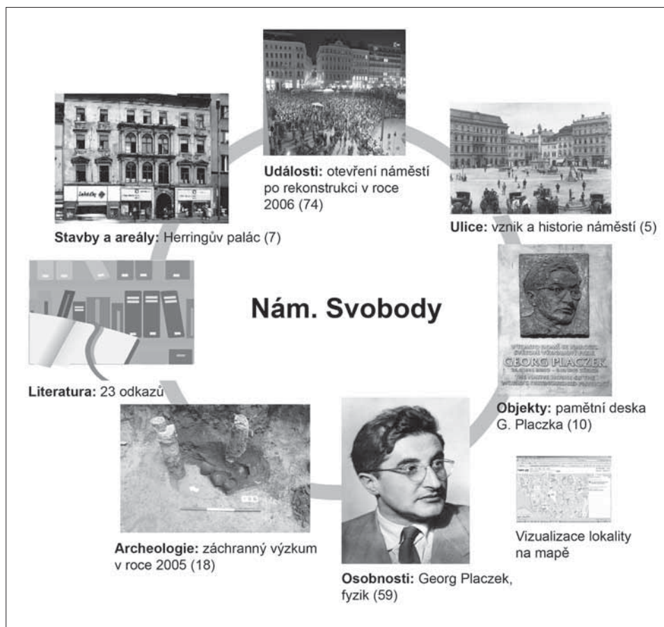
Obr. 3. Příklad provázání jednotlivých sekcí u jedné lokality (v každé sekci je vybrán jeden příklad, v závorce jsou celkové počty záznamů pro tento dotaz). Každá sekce obsahuje odkazy na další související sekce.

Archeologie Brna a Jihlavska je komplexně řešena v komunikačním modulu, na jehož programovém i obsahovém zadání participují všechny zapojené instituce. Archeologické lokality jsou zde charakterizovány ve třech identifikačních úrovních – prostorové, časové a věcné. Základní jednotkou prostorové identifikace v intravilánu je parcela, doplněná v extravilánu o název tratí, ve vyšších úrovních se připojují ulice, místní názvy a městské části. Jako časový identifikátor slouží chronologická řada pravěkých kultur s navazující periodizací středověku a raného novověku. Věcné identifikátory se váží k terénním situacím zjištěným archeologickými výzkumy na straně jedné a hmotné kultuře reprezentované náleзовými soubory na straně druhé. Samostatnou podskupinu pak