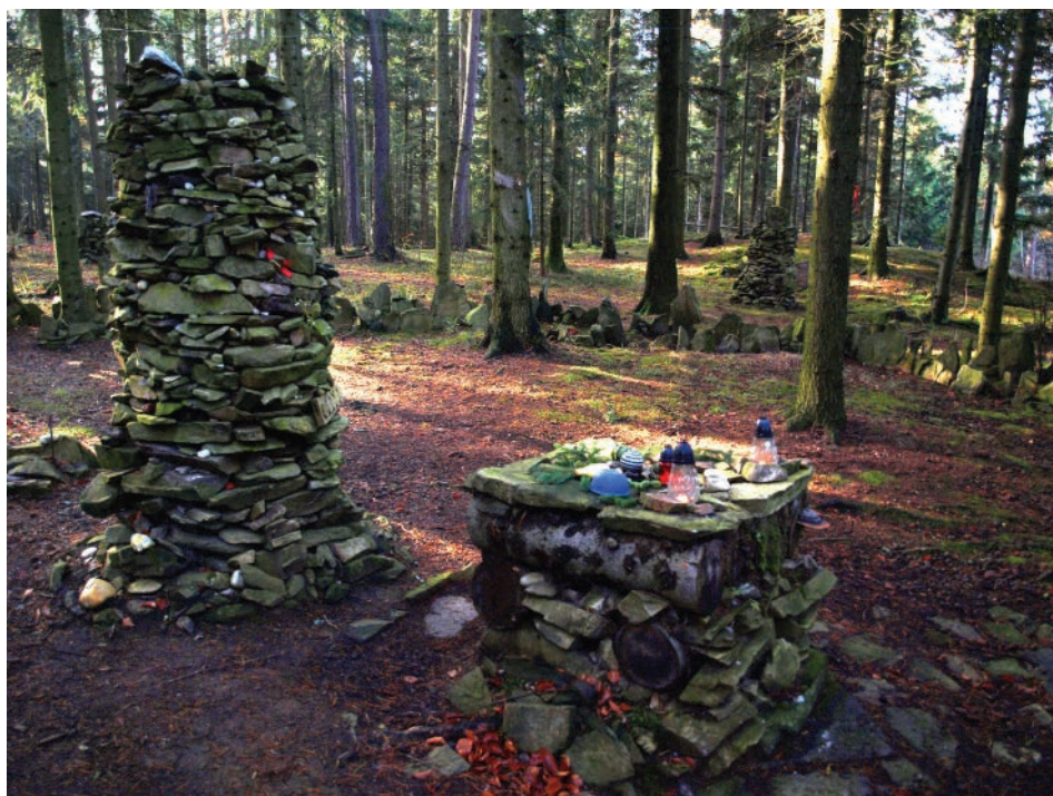
Obr. 3. Obětní oltář a sloup uvnitř kamenného kruhu na lokalitě u Třisova.

Dva soustředné kamenné kruhy, z nichž větší dosahuje průměru cca 12 m, vznikly v roce 2007 na návrší nad obcí Třisov. Vnější kruh má jeden vstup, vnitřní má vstupy čtyři. Cesta vedoucí ke kruhu je rovněž lemována vztyčenými kameny.