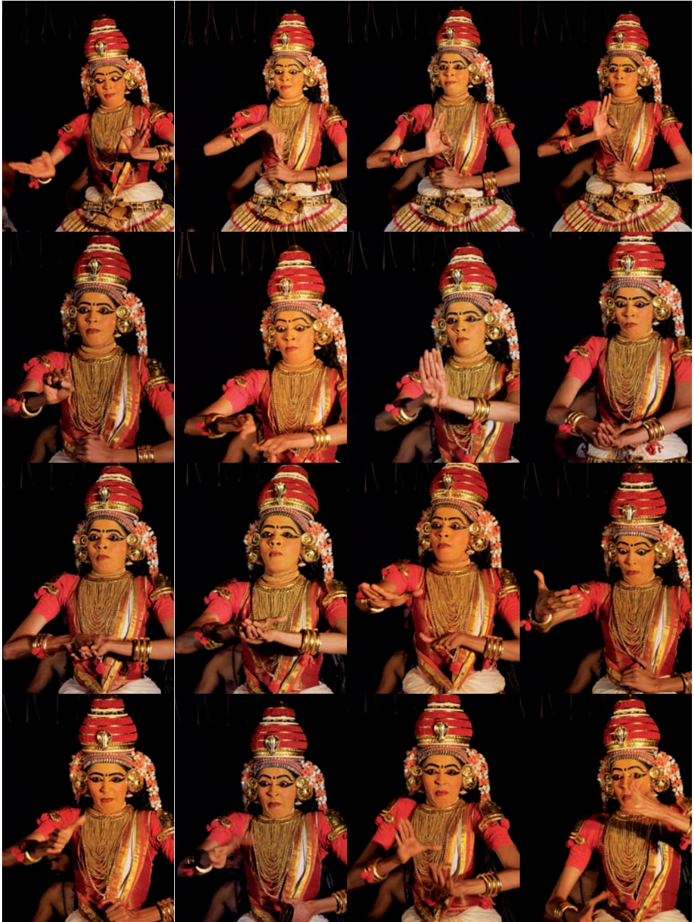
Kúdíjättam – sekvence muder 81–96