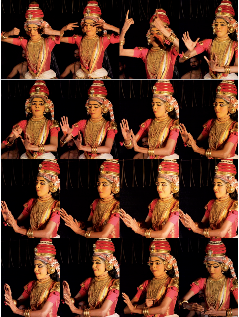
Kúdíjĕttam – sekvence muder 1–16