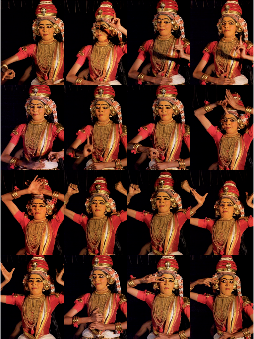
Kúdíjattam – sekvence muder 33–48