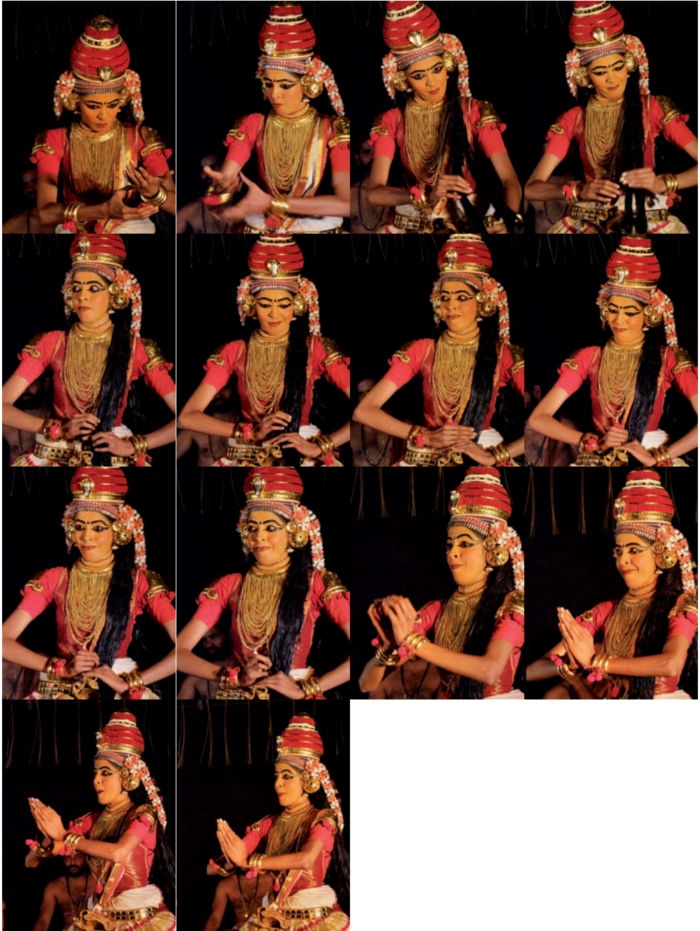
Kúdíjättam – sekvence muder 113–126