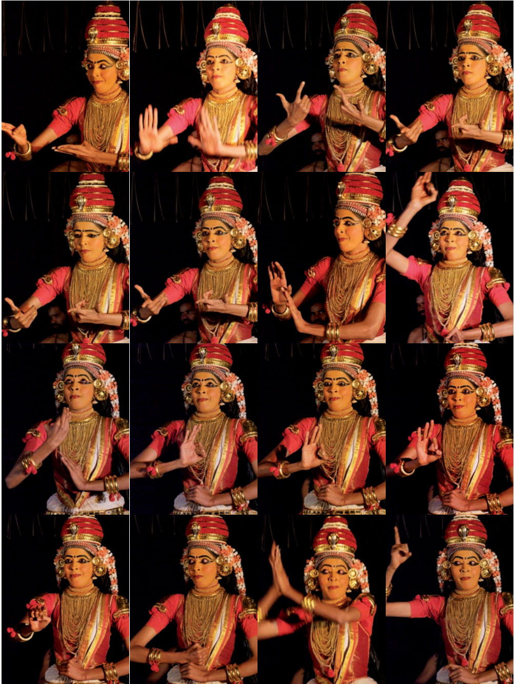
Kúdíjättam – sekvence muder 17–32