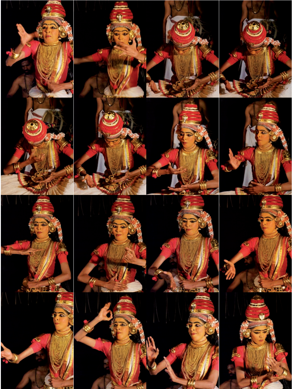
Kūḍijāttam – sekvence muder 97–112