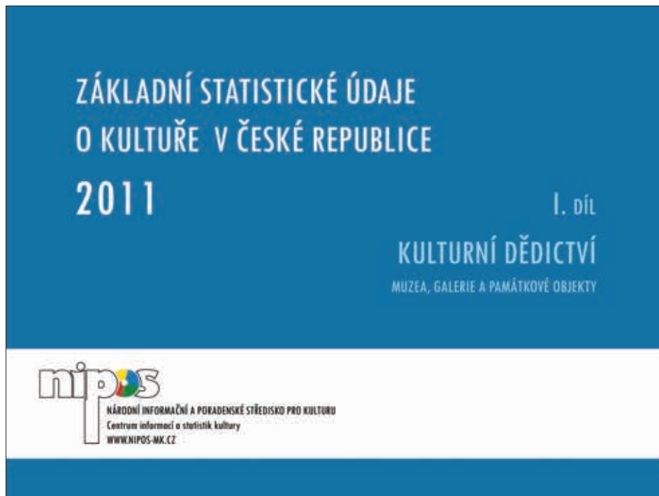
Obr. 2: Obálka příručky Základní statistické údaje o kultuře v České republice (za rok 2010).

ale v podrobnějším, později publikovaném přehledu jsou tyto nezveřejnitelné statistické jednotky uvedeny v anonymizované podobě a skutečné pořadí se pak může, někdy i zásadně, lišit.