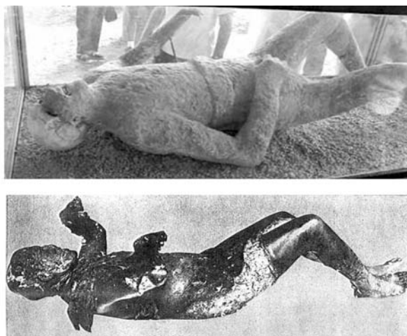
Obr. 16. „Boxerská“ poloha těla. A. Výlitek dutiny po těle z Pompejí, B. Forenzní případ (PROKOP 1966).

Mrtvoly bývají do rakve uloženy převážně s rukama sepnutými nad břichem. Působením vysoké teploty dochází k odpaření vody, následkem čehož se stahují svaly a šlachy. To vyvolá pomalé nadzvednutí paží v ramenním kloubu, mnohdy až