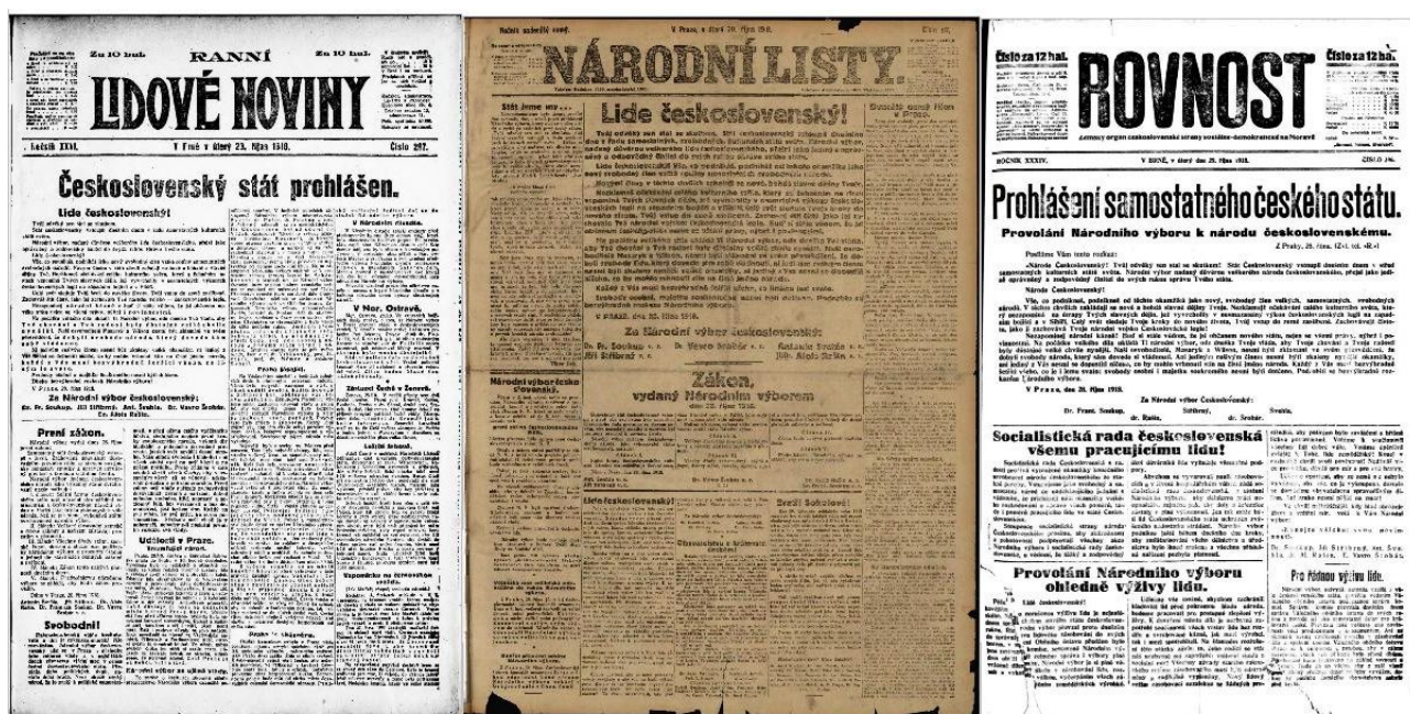
Obr. 1: Ukázka titulních stran starých novin (29.10.1918)

Žádoucí pro archivaci je skenování do formátu bezztrátového tiffu s barevnou hloubkou 24 bitů a s rozlišením minimálně 300 DPI (u novin s drobným písmem je vhodné použít 400 DPI). Následná úprava obrazu zahrnuje otočení, ořez, vyrovnaní řádků a případnou úpravu barevnosti, odstranění šumu, vylepšení kontrastu a jasu apod. Veškerá úprava je důležitá pro následnou výrobu OCR, protože čím je sken kvalitnější, tím větší je úspěšnost rozpoznání znaků. Dle národních doporučení je obraz zkonvertován do formátu JPEG2000 a to jak pro archivní kopii, tak pro uživatelskou kopii. 8 Periodika, u kterých proběhlo ochranné reformátování v minulosti pouze metodou mikrofilmování, se z důvodu náročné přípravy a stavu dokumentů skenují z mikrofilmů speciálním mikrofilmovým skenerem.