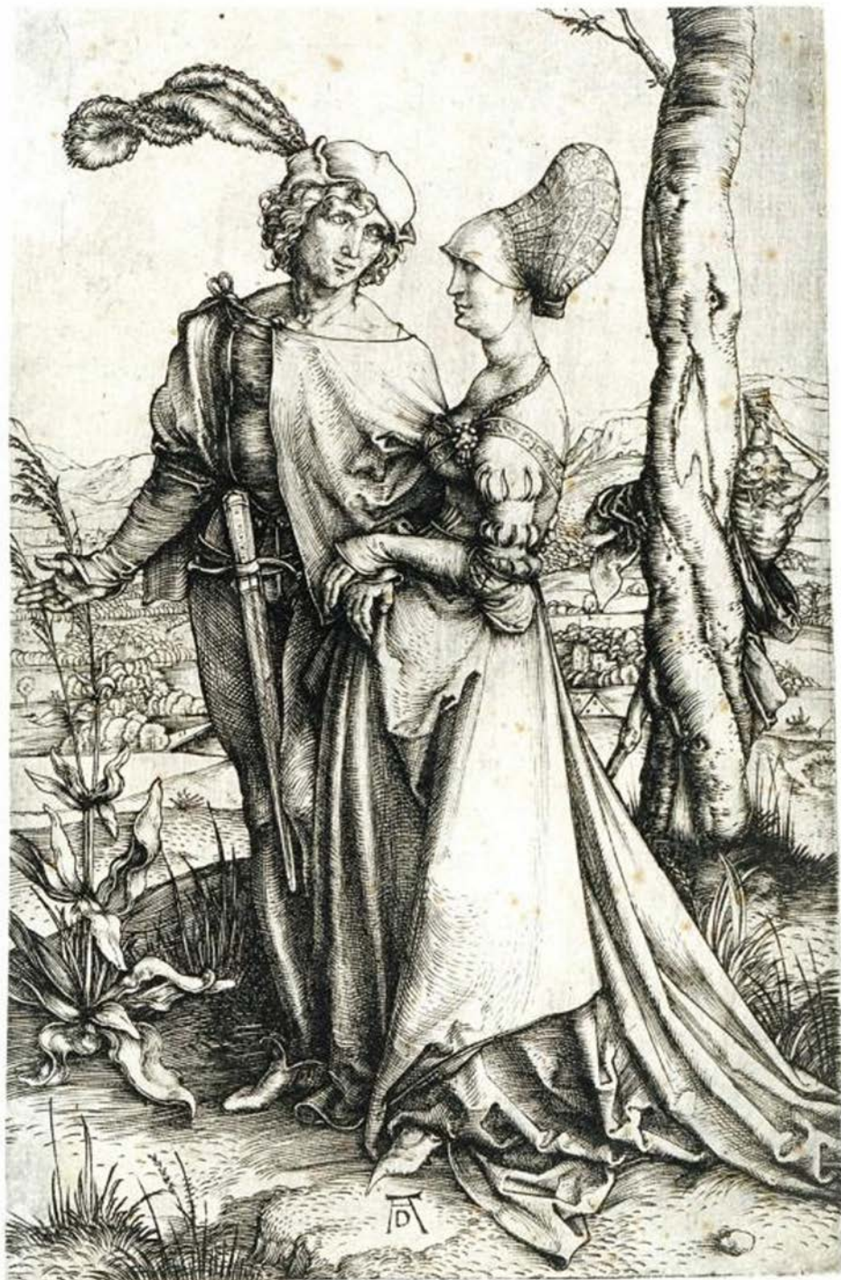
Obr. 10. Albrecht Dürer – Pár na prechádzke sledovaný smrťou. Podľa Dürera 1498.