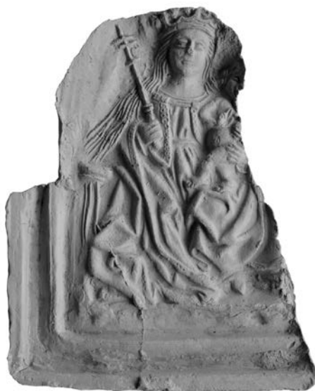
Obr. 3. Košice, Dominikánske nám. 11. Odtlačok formy s výjavom Korunovanej madony s dieťaťom. Kat. č. 2.