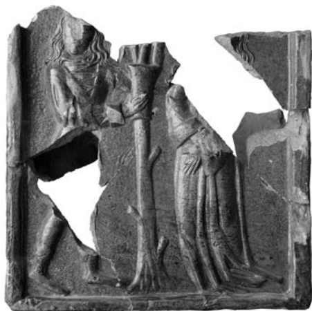
Obr. 6. Košice, Hlavná 16. Kachlica s motívom zasnúbenia. Kat. č. 6. Abb. 6. Košice, Hauptstraße 16. Kachel mit Verlobungsmotiv. Kat. Nr. 6.

Kachlica s dvojicou postáv, muža a ženy. Postava muža sa zachovala od hlavy po pás a od kolien po chodidlá, postava ženy od pása po chodidlá a pravá ruka. Vrchný odev ženy tvoria šaty, ich členenie od pása nahor sa nezachovalo. Rukávy sú dlhé, voľné, rozširujúce sa a ukončené širokou manžetou. Sukňa siaha až po zem a spolu s vlečkou je riasená do záhybov a zahaľuje topánky. Žena má voľne rozpustené zvlnené vlasy, siahajúce na chrbát. Mužov vrchný odev je vypasovaný kabát s „V“ výstrihom s ozdobným šnurovaním. Kabát je v páse pravdepodobne stiahnutý opaskom (prekryté rukou), od pása nadol je rozšírený a v záhyboch siaha tesne pod zadok. Rukávy sú dlhé, rovné. V časti od ramena po lakeť sú zdobené dlhým prestrihom. Ukončené sú manžetami, podobne ako ženské šaty. Spodný odev tvorí košeľa s oválnym výstrihom siahajúca až ku krku, čím vyplnía „V“ výstrih. Muž má priliehavé nohavice. Uzavreté topánky, siahajúce nad členky, sú ukončené manžetou. Rozpustené mierne zvlnené vlasy mu siahajú až po ramená. Muž pravdepodobne drží v ruke pohár v geste, akoby ho podával žene, čím dokresľuje dojem galantnej scény. Medzi oboma postavami vyrastá strom, ktorý by mohol byť symbolom vzrastu budúceho šťastia a naznačuje tak, že ide o motív zásnub (Loskotová–Menoušková–Pavlík–Vitanovský 2008, 58).