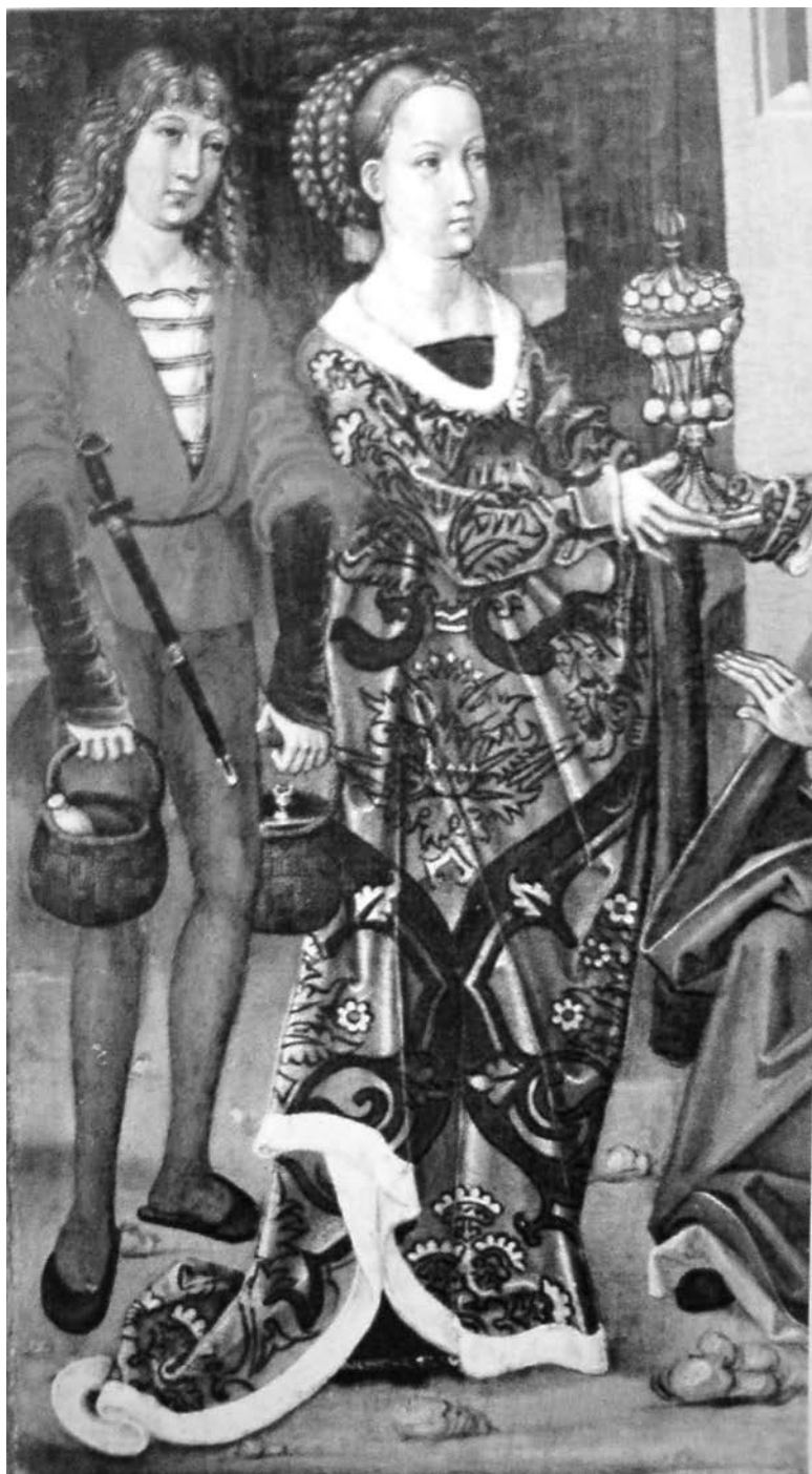
Obr. 12. Detail tabuľovej maľby z oltára v Kostole sv. Antona a sv. Pavla Pustovníka v Banskej Bystrici – Sásovej. Podľa Kučera–Kostický 1990, 136, obr. 247. Abb. 12. Detail eines Tafelbildes vom Altar in der St. Anton-und-Paul-Kirche in Banský Bystrica – Sásová. Nach Kučera–Kostický 1990, 136, Abb. 247.