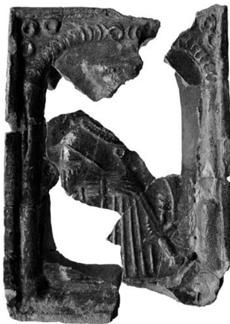
Obr. 8. Košice, Dominikánsky kláštor. Kachlica s vyobrazením Lukrécie. Kat. č. 13.

Postava z výjavu evokuje na prvý pohľad skôr muža, viac tomu napovedá i odev, ikonografia s proti sebe obráteným mečom však poukazuje na Lukréciu, prípadne na Dido, Vergiliovu kráľovnú Kartága, berúcu si život. Tvárová časť na kachlici chýba. Postava je mierne pootočená, zobrazená približne od výšky kolien. Odev tvorí hrubý kabát, zvaný giornea, alebo šuba s veľkým vyhnutým go-