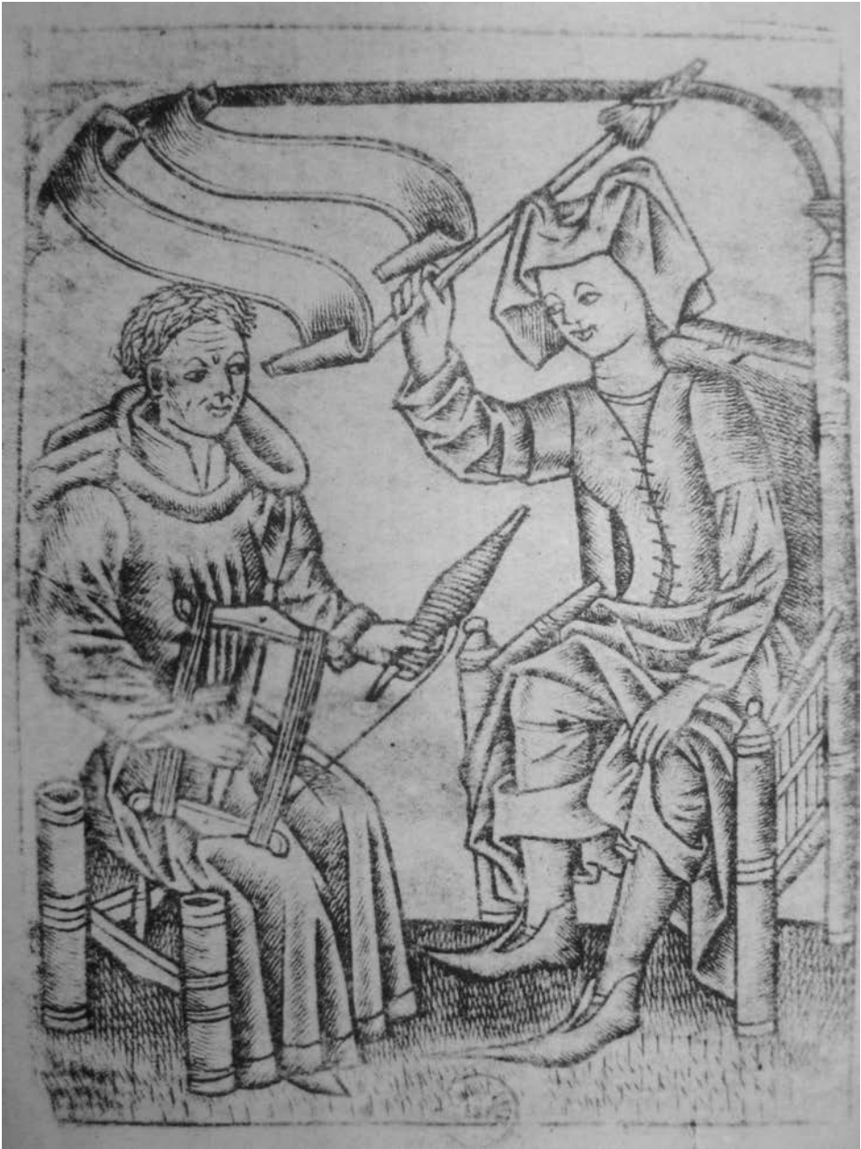
Obr. 1. Majster Olivovej hory (Meister des Ölbergs) – Svet obrátený naruby. Podľa Geisberg 1909, T 67. Abb. 1. Meister des Ölbergs – Verkehrte Welt. Nach Geisberg 1909, T 67.

sú spôsobené najmä ich jednoduchším prevedením na úkor niektorých detailov. Odevy voľne splývajú, majú menšie členenie, mužovi chýba opasok, žena má sukňu menej vyhrnutú, takže jej nevidieť spodné prádlo.