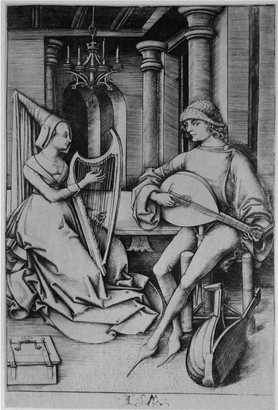
Obr. 7. Israhel van Meckenem – Hráč na lutnu a harfistka. Podľa Strauss 1981, 169. Abb. 7. Israhel van Meckenem – Lautenspieler und Harfenistin. Nach Strauss 1981, 169.