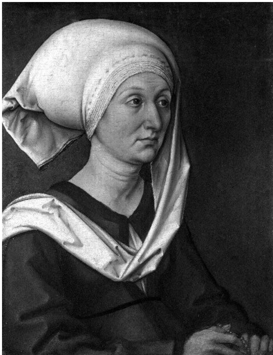
Obr. 13. Albrecht Dürer – Portrét matky, Barbary Holper. Podľa Dürer 1490.