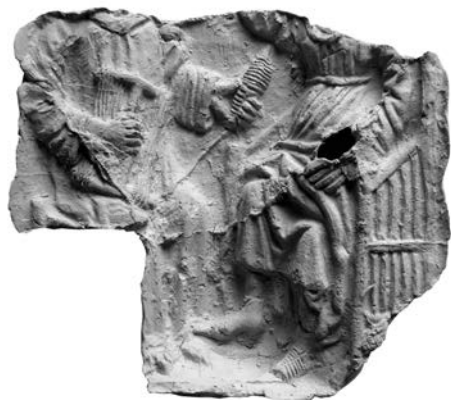
Obr. 2. Košice, Dominikánske nám. 11. Odtlačok formy s výjavom sveta obráteného naruby podľa grafickej predlohy Majstra Olivovej hory (Meister des Ölbergs). Kat. č. 1. Abb. 2. Košice, Dominikanerplatz. 11. Abdruck einer Kachelform mit Szene der Verkehrten Welt nach einer Grafikvorlage des Meisters des Ölbergs (Meister des Ölbergs). Kat. Nr. 1.

Odev svätca tvorí košeľovitá tunika splývajúca v záhyboch a siahajúca tesne nad členky. V páse je stiahnutá opaskom vykladaným drahokamami. Rovnako vykladané sú aj manžety tuniky. Cez plecia má prehodený plášť siahajúci po členky a zopnutý pod bra-