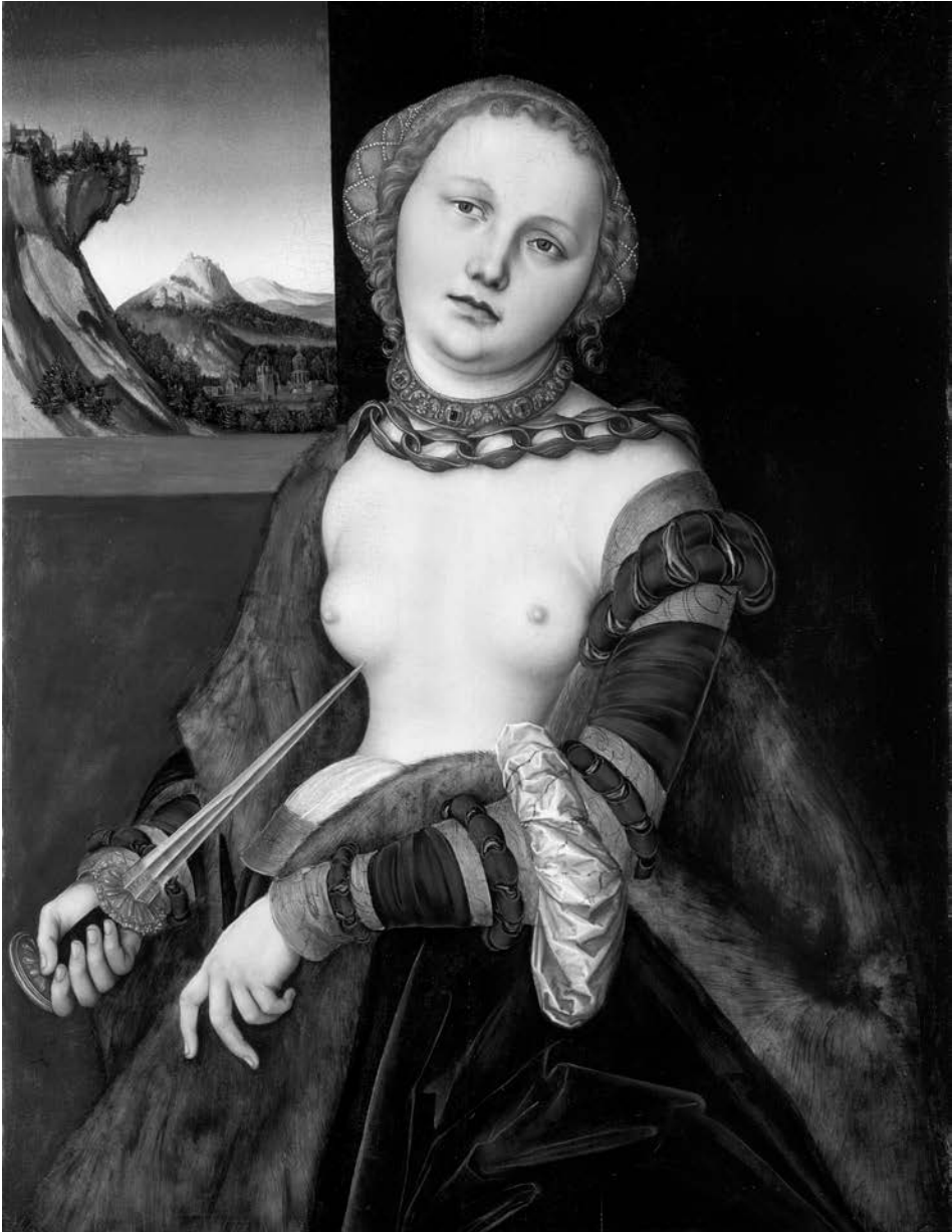
Obr. 11. Lucas Cranach st. – Lukrécia. Podľa Cranach 1530.