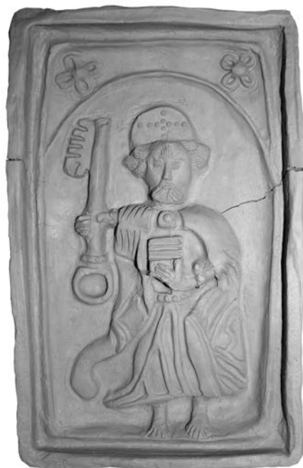
Obr. 4. Košice, Dominikánske nám. 11. Odtlačok formy s výjavom sv. Petra. Kat. č. 3.