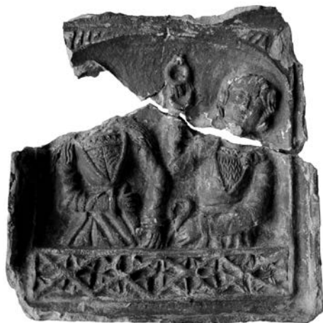
Obr. 5. Košice, Mäsiarska 57/A. Kachlica s motívom snúbeneckého páru. Kat. č. 5. Abb. 5. Košice, Fleischergasse 57/A. Kachel mit Brautpaar-motiv. Kat. Nr. 5.

Kachlica s dvojicou postáv, muža a ženy, a s motívom zásnub. Muž drží v pravej ruke venček. Žena má dvojdielne šaty z látky bez vzoru, živôtik s veľkým „V“ výstrihom lemovaným kožušinou alebo stuhami. Vo výstrihu vidieť ozdobnú náprsenku alebo predničku z dekoratívnej látky s veľkým vzorom, vertikálne delenú napoly, lemovanú rovnako ako výstrih. Rukávy sú dlhé, priliehavé, siahajúce po zápästia. Sukňa je riasená, doplnená opaskom. Košeľa má hlboký rovný výstrih. Viditeľný je z nej iba ozdobný lem tesne nad ukončením výstrihu šiat. Postava má voľne rozpustené vlasy, jemne zvlnené, siahajúce do polovice chrbta. Hlavu zdobí čelenka s hviezdou. 3 Postava muža má na sebe priliehavý kabát z látky bez vzoru s veľkým „V“ výstrihom lemovaným kožušinou alebo stuhami. Vo výstrihu je ozdobný náprsník z dekoratívnej látky s výrazným vzorom, odlišným od vzoru na náprsníku ženy. Rukávy sú dlhé, priliehavé, siahajúce po zápästia. Kabát je v páse stiahnutý opaskom a siahá pravdepodobne pod zadok, prípadne ku kolenám, ako voľne riasený. Z košele je viditeľný len ozdobný lem tesne nad ukončením výstrihu šiat. Muž nemá pokrývku hlavy, vlasy sú mierne zvlnené a zastrihnuté tak, že lemujú tvár. Architektonické rámovanie výjavu už má tvar veľmi štylizovanej renesančnej niky, no spodný okraj ešte tvorí prelamované gotické zábradlie.