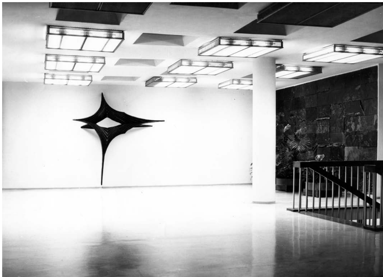
4 – Interiér haly Centropjektu Gottwaldov, 1969.

Zakládání komisí pro spolupráci výtvarníka s architektem navázalo na starší praxi. 42 Dosud není objasněno, zda tyto nejstarší komise fungovaly už od založení ČFVU a podniku Dílo, tedy od roku 1954. Nejstarší nalezené kontinuální zápisy z jednání komisí, vedené od roku 1956, můžeme sledovat v pražské pobočce archivního fondu ČFVU, ze zmínek víme, že schvalování v tomto roce probíhalo i v Ostravě, 43 kde od roku 1955 vhodnost monumentálních zakázek i jejich rozpočty řešil jiný subjekt než ČFVU, a to výbor krajského střediska Svazu československých výtvarných umělců. 44 Stejný orgán schvaloval realizace pro architekturu i v Brně. 45 Zápisy samotné umělecké komise ČFVU v Brně známe až z roku 1961, 46 kontinuálně se zachovaly od roku 1962. Tímto rokem začíná i série zápisů z gottwaldovské (zlínské) 47 a ústecké 48 pobočky, což zřejmě souvisí s uplatněním vyhlášky č. 149/1961, která dala činnosti uměleckých