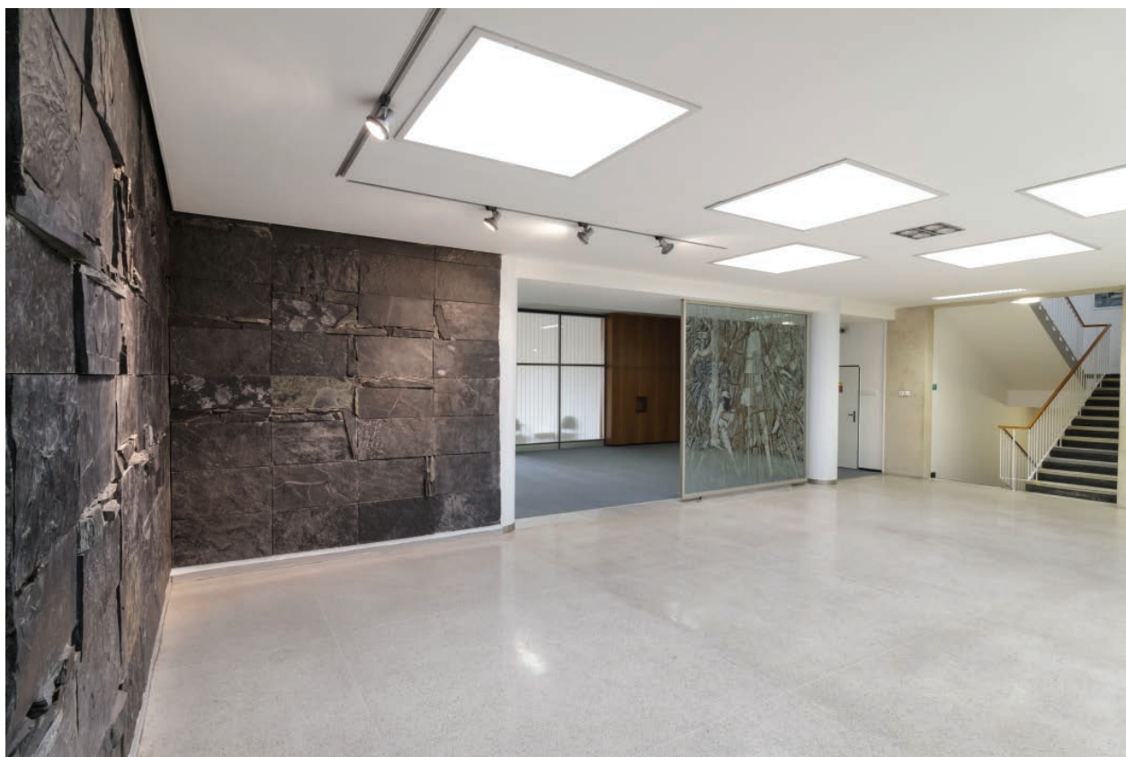
6 – Hala budovy Centroprojektu Zlín, 2016

Téměř veškerý materiál regionálních poboček byl v devadesátých letech 20. století svezen a uskladněn v Praze. V době likvidace podniku Dílo a přechodu ČFVU na Nadaci ČFVU byly archiválie údajně uloženy v několika pražských