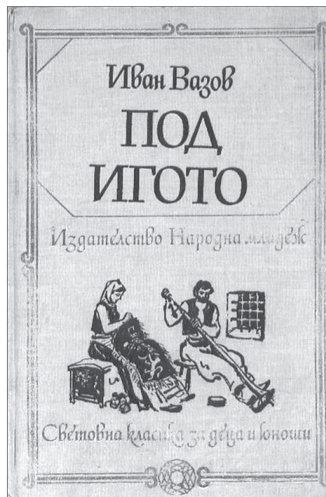
Stylizované motivy ze života porobeného bulharského národa na jednom vydání Vazovova Pod jařmem ze 60. let

V době sociálních sítí se tyto projevy lidové tvorivosti mohou přirozeně šířit rychleji, současně se však za těchto okolností stírají ve veřejném (vir-