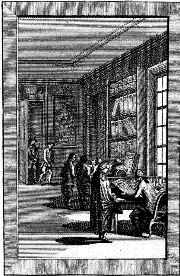
Abb. 1. Dominien. Kupferstich in Oktavformat. Joseph II. – Gesetze, Bd. 8 (1787), Titelblatt, nicht paginiert. 1

Das Titelblatt des achten Bandes der Josephinischen Gesetzsammlung versinnbildlicht grob Sinn und Zweck von Patenten und Verordnungen und damit auch die Quelle des „Gemeinwohls“ – nämlich die Arbeit von Untertanen. Die Abbildung zeigt eine Herrschaftskanzlei, deren halb geöffnete Tür die ganze Reihe von Untertanen ahnen lässt, die ergeben ihre Gelder mitbringen und ihre Pflichten bestätigen lassen: zwei Schreiber führen die wichtigsten Bücher des Dominiums: nämlich das Steuerbuch und das „Gabebuch“, also das Buch der Untertanen-Pflichten und -Abgaben. Beide Bücher sind symbolisch dargestellt, da sie in so einer Form nie bestanden hatten, der Zweck ist hier