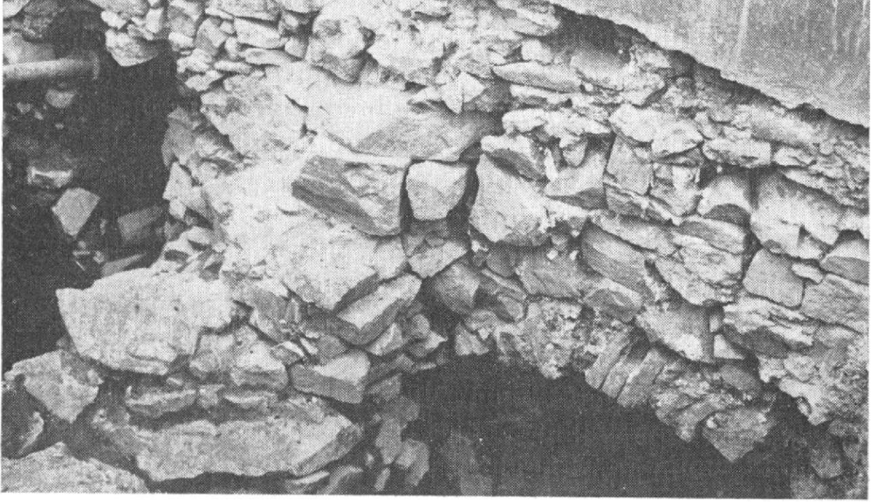
Obr. 3. Východná strana opevnenia Trojičného námestia.