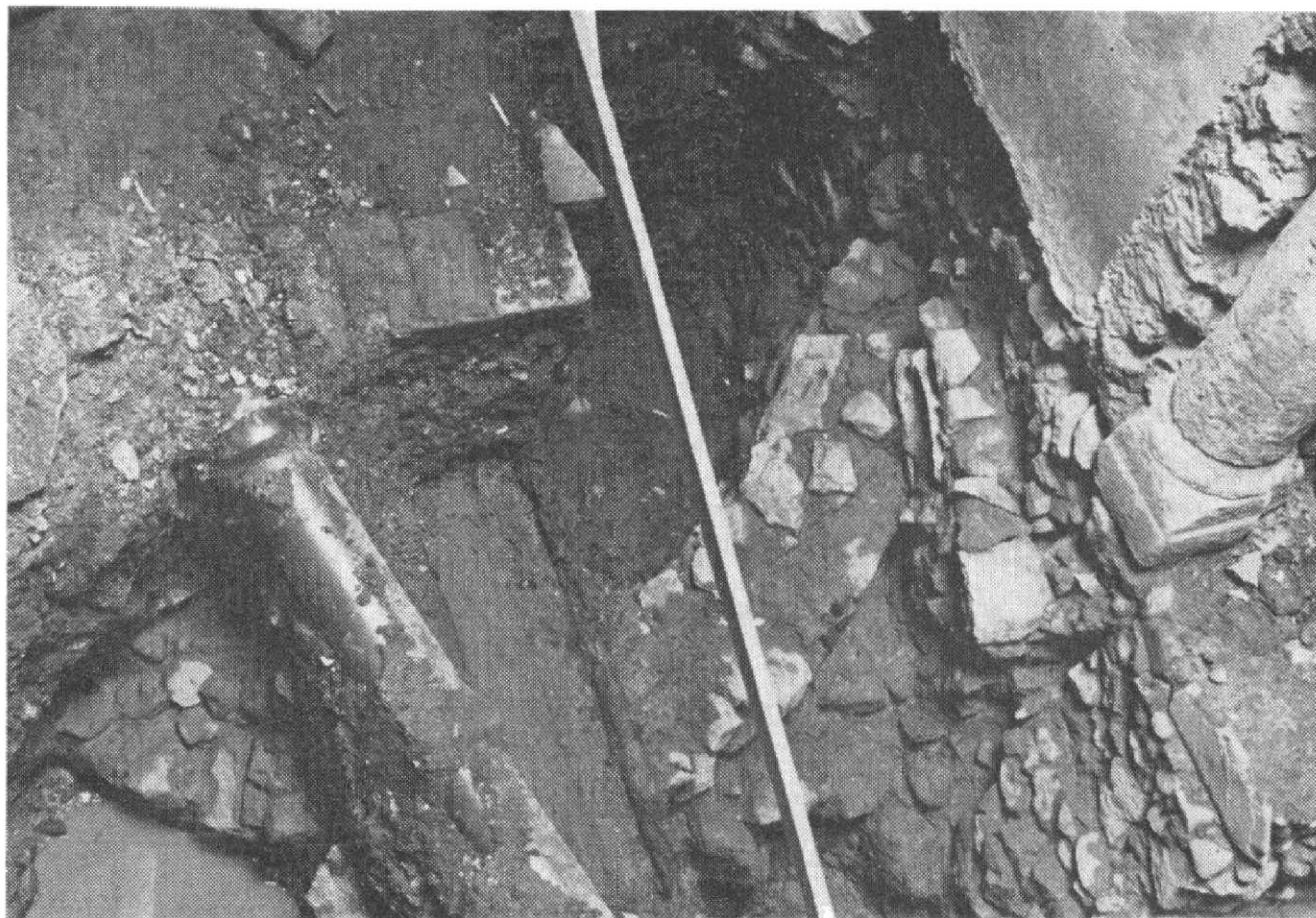
Obr. 2. Hutnícka pec v nádvorí objektu č. 20.