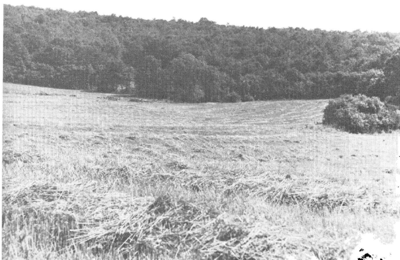
Obr. 1. Gemerský Sad – Somkút; pohľad na lokalitu.