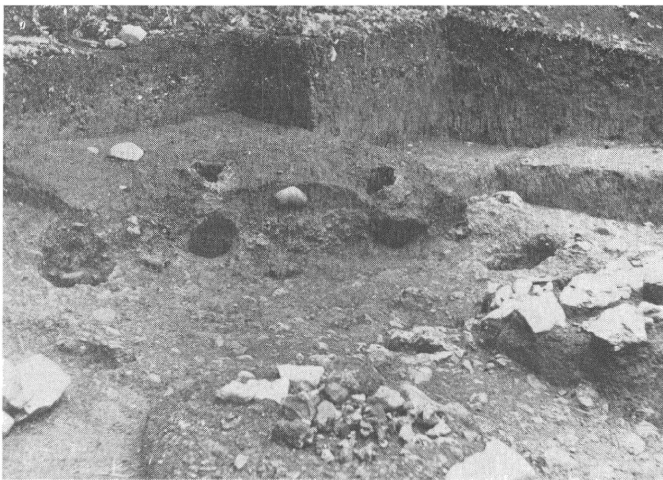
Obr. 2. Gemerský Sad – Somkút; objekt s dvomi pecami na tavenie železa.