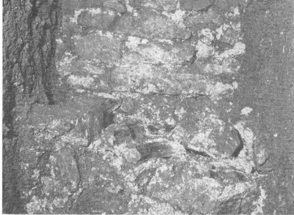
Obr. 4. Olomouc – dómské návrší 1974: Vnitřní strana hradební zdi u románské válcové věže (Sonda 15/74). Pod rozpěrou zbytek nadzemního lícovaného a pod ním základového rozšířeného zdiva předgotického původu. Nad rozpěrou hrubé základové zdivo novější hradby, datované pražským grošem Jana Lucemburského.