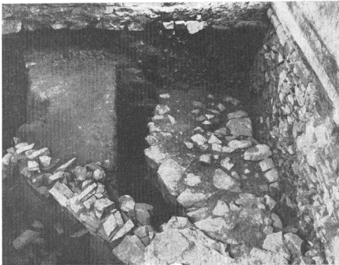
Obr. 2. Olomouc – dómské návrší 1984: Situace pod podlahou východního křídla býv. kapitulního děkanství (nyní Univerzita Palackého). Vpředu kamenná plenta na vnější straně mladohradištního valu. Vlevo zbytek hlinito-kamenitého tělesa valu. Vpravo obloukový zůvěr podélné orientované stavby (kaple sv. Máří Magdaleny?).