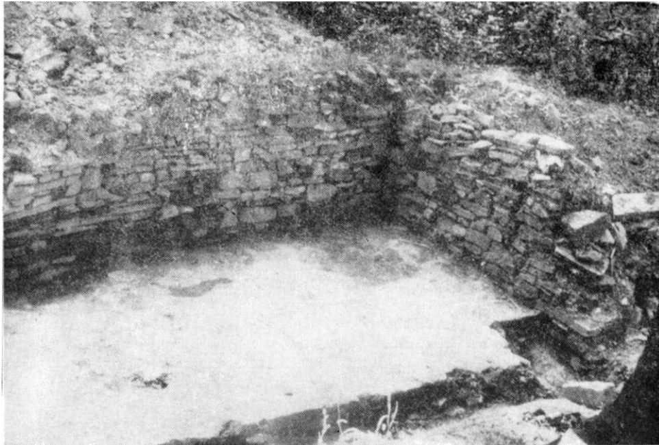
Obr. 1. DSO Liplna, jihozápadní roh věže.