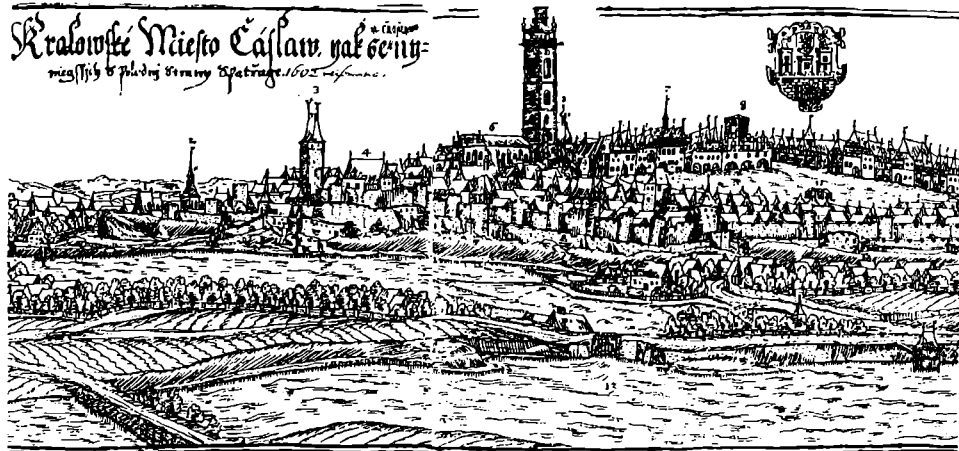
Obr. 3. Jan Willenberg, veduta města Čáslavi v pohledu od JZ, dat. 1602. Levá část.