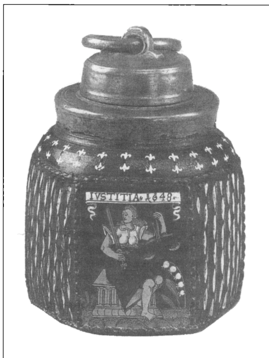
Obr. 6. Malbou zdobená raně barokní nádoba s vyobrazením světské Spravedlnosti (IVSTITIA), která ještě nese základní typické atributy staršího motivu „Vážení duší“ (meč, váhy) při Posledním soudu. Jižní Německo, 1648.

grafický kamnářský výzdobný prvek, který dosud nebyl popsán ani v domácí, ani zahraniční odborné literatuře. Je proto zajímavý z několika hledisek.