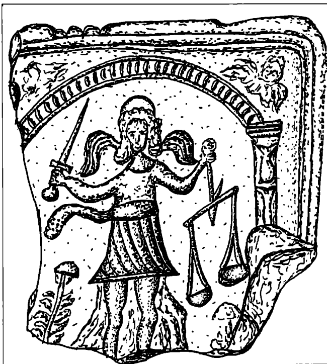
Obr. 2. Renesanční reliéfní kamnový kachel se zobrazením archanděla Michaela, vážícího duše při Posledním soudu. Neznámá lokalita na Pelhřimovsku. Okolo poloviny 16. stol.