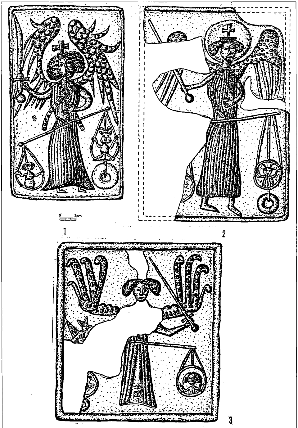
Obr. 1. Pozdně gotické reliéfní kamnové kachle se zobrazením archanděla Michaela, vážícího duše při Posledním soudu. Hrady v Pardubicích (1), v Polné (2) a Lukově (3). Vesměs druhá třetina 15. stol.