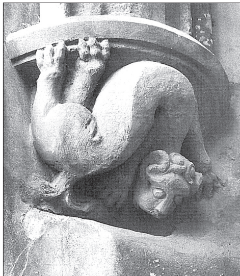
Obr. 2. Praha, katedrála sv. Víta – reliéf s kočkou, kolem 1380. Podle Petr Parlář 1999, 107.

Abb. 1. Prag, Veitsdom – Relief mit Kampf zwischen Katze und Hund, um 1380. In: Petr Parlář 1999, S. 100.