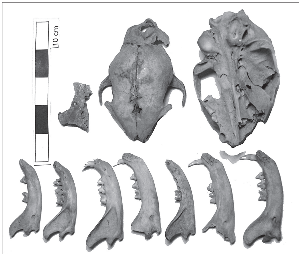
Obr. 6. Brno, Dům pánů z Lipé – nálezy kočičích lebek (novověk).