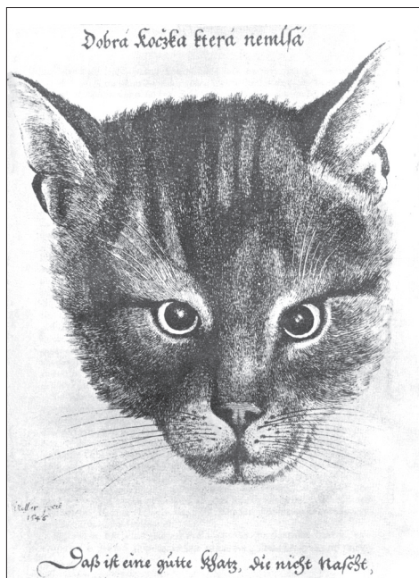
Obr. 4. Václav Hollar, Dobrá kočka která nemlsá, 1646. Podle Hollar 1969, obrazová část.

Obecně se má za to, že se do střední Evropy kočka šířila díky vojenským aktivitám starověkých Římanů. První nálezy domácích koček severně od Alp jsou datovány do laténu (např. Benecke 1994). Z území ČR pocházejí nejstarší nálezy od Vyškova na Moravě (doba římská, 2. století; Nývltová Fišáková–Šedo 2003) a z Března u Loun (období stěhování národů; Pleinerová 1966). V obou případech byly nalezeny více či méně zachované skelety svědčící o možném pohřbu zvířete. Minimálně u prvního z nálezů se jednalo o dovezené zvíře (ne o zvíře z místního chovu). Zdá se tedy, že počátek historie kočky domácí na území naší republiky, můžeme datovat do 2. století. Zatím však nelze zjistit, zda už v této době byla kočka na našem území chována. V raném středověku se kočka stala relativně běžnou součástí českých osteologických souborů. Ve společnosti byly kočky z počátku poměrně váženými zvířaty, jak naznačují pohřby jedinců nacházených na slovanských hradištích (Kratochvíl 1980). V následujících obdobích, a zejména pak v novověku, se početnost kočky na archeologických lokalitách dále zvyšuje.