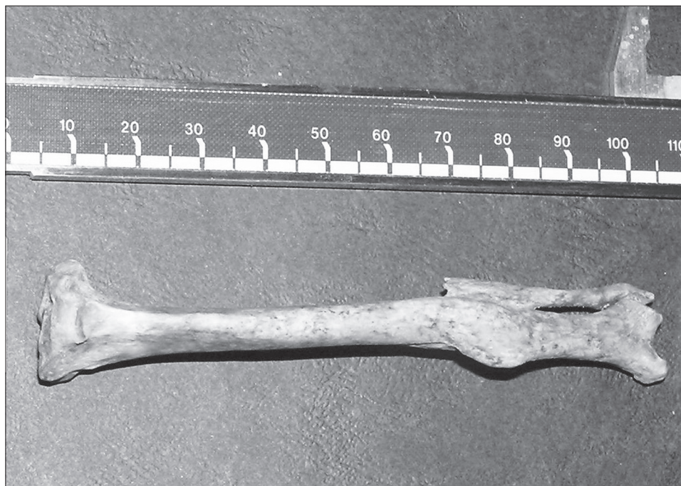
Obr. 5. Praha, nám. Republiky – kočičí kost holenní se zhojenou zlomeninou.