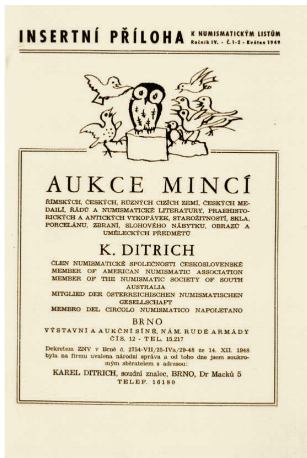
8 – Oznámení o aukci mincí, medailí, starožitností a uměleckých předmětů, květen 1949. Numismatické listy IV, č. 1–2