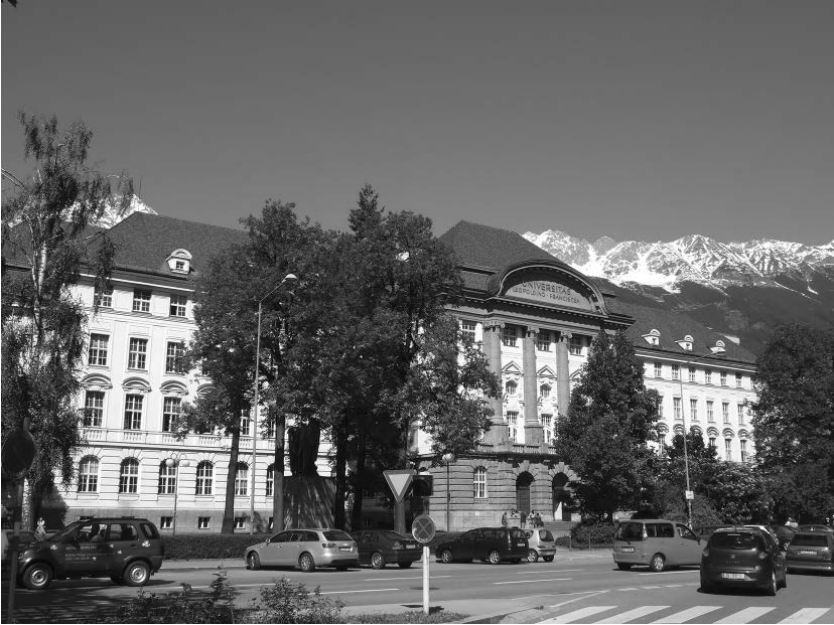
Abb. 12: Das Hauptgebäude der Leopold-Franzens-Universität in Innsbruck beherbergt u. a. auch das Universitätsarchiv.