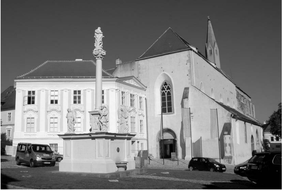
Abb. 11: Das Stadtarchiv Krems befindet sich im Komplex des ehemaligen Dominikanerklosters (Foto: Karl Bauer, Wikimedia Commons).

das Archiv zunächst noch mit der Registratur verbunden blieb. 38 In anderen Städten kümmerten sich zumeist Gymnasialprofessoren ehrenamtlich um das Stadtarchiv und/oder -museum. Es gab sogar Fälle, in denen Universitätsprofessoren oder Archivare der Zentral- oder Landesarchive das „Patronat“ über ein kleines Stadt- oder Marktarchiv übernahmen und dieses in ihrer Freizeit betreuten.