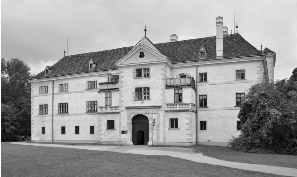
Abb. 19: Im Alten Schloss in Laxenburg bei Wien befindet sich seit 1970 ein Teil des Filmarchivs Austria (Foto: P e z i, Wikimedia Commons).

verhältnismäßig spät ein Filmarchiv eingerichtet. Das Österreichische Filmarchiv (heute Filmarchiv Austria) wurde 1955 gegründet; 1964 folgte zusätzlich das Österreichische Filmmuseum. 82