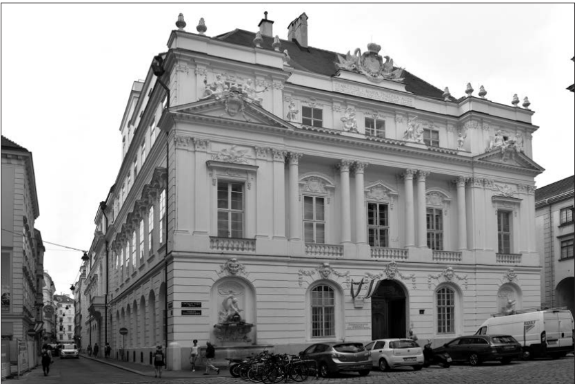
Abb. 13: Das Hauptgebäude der Österreichischen Akademie der Wissenschaften am Dr.-Ignaz-Seipel-Platz, ursprünglich die sogenannte Neue Aula der Universität Wien, beherbergt u. a. das ÖAW-Archiv.