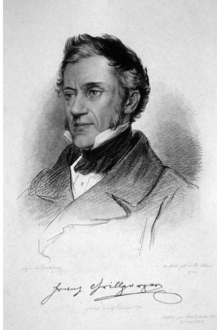
Abb. 2: Franz Grillparzer (1791–1872), österreichischer Dramatiker und Archivar, war in den Jahren 1832–1856 Direktor des Hofkammerarchivs bzw. des Archivs des k.k. Finanzministeriums (Porträtlithographie von Josef Kriehuber aus dem Jahr 1841).

sich wenig später neuerlich verselbständigte, wurde auch die Aufhebung des Hofkammerarchivs widerrufen, wodurch diese Institution zum dauerhaften Bestandteil des zentralen Archivwesens wurde.