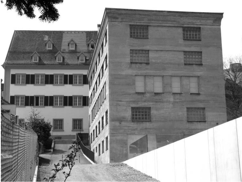
Abb. 10: Der Gebäudekomplex des Vorarlberger Landesarchivs in Bregenz.

tenden Auslieferungen; diese erfolgten jedoch in den 1980er Jahren aufgrund eines Abkommens mit Jugoslawien.