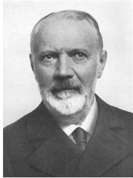
Abb. 5: Theodor von Sichel (1826–1908), österreichischer Historiker und Diplomatiker preußischer Herkunft, langjähriger Direktor des Instituts für Österreichische Geschichtsforschung (Foto: Wikimedia Commons).

Da Außenpolitik, Verteidigung und Finanzen zu gemeinsamen Agenden erklärt wurden, wurden Haus-, Hof- und Staatsarchiv, Kriegsarchiv und Hofkammerarchiv zu gesamtstaatlichen Institutionen, wobei das letztere in „k. u. k. Reichs-Finanzarchiv“ und später „Gemeinsames Finanzarchiv“ umbenannt wurde. Dagegen beschränkte sich das Archiv des Ministeriums des Innern (bis 1848 Hofkanzleiarchiv) ausschließlich auf Cisleithanien.