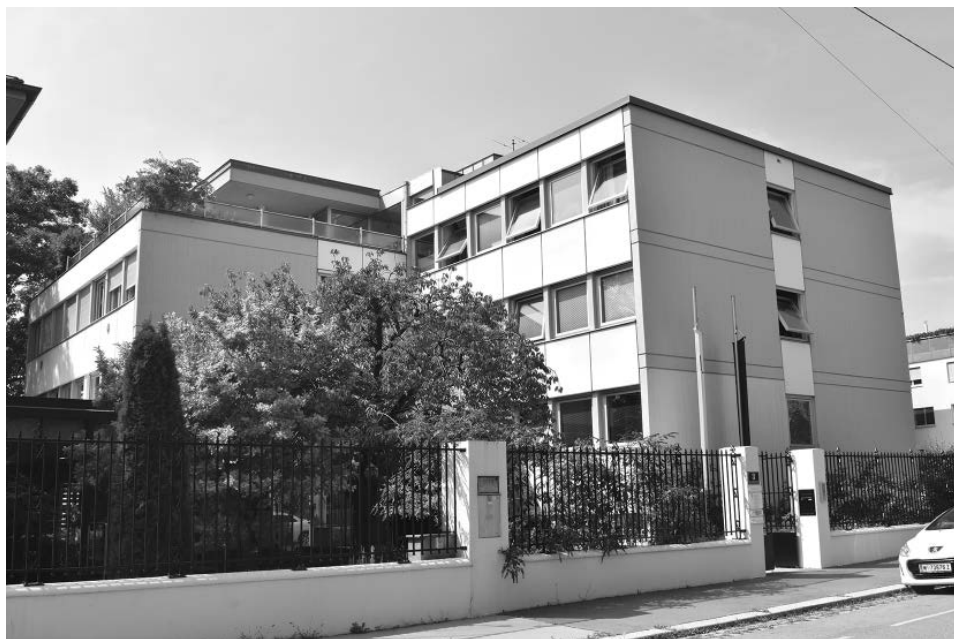
Abb. 15: Das Evangelische Zentrum im 18. Wiener Gemeindebezirk, Severin-Schreiber-Gasse 3, beherbergt den Sitz des Evangelischen Oberkirchenrates A. und H. B. in Österreich, einschließlich des zentralen evangelischen Archivs.