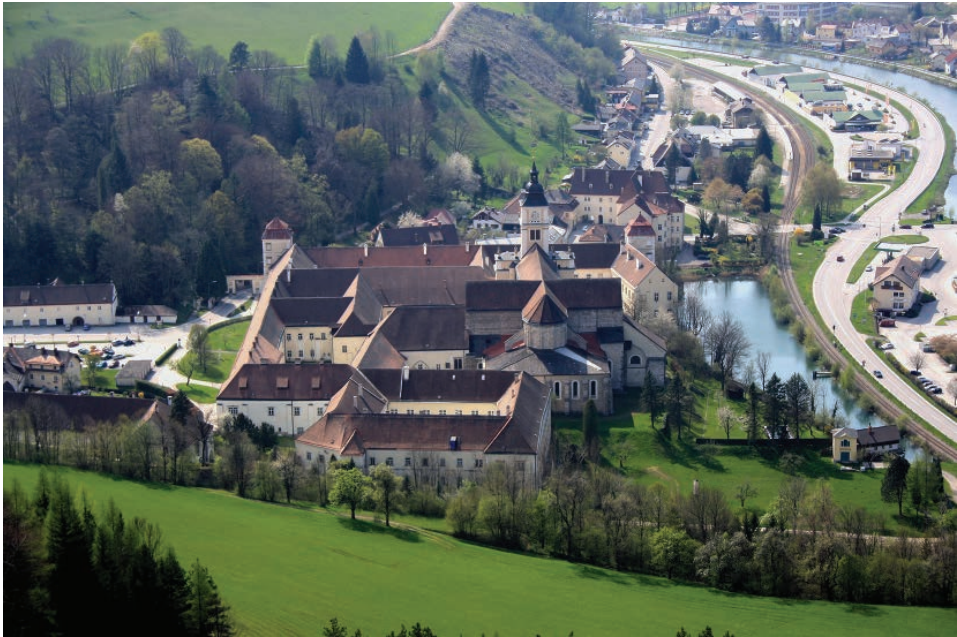
Abb. 1: Das niederösterreichische Zisterzienserstift Lilienfeld beherbergte in der ersten Hälfte des 14. Jahrhunderts das Hausarchiv der Herzöge von Österreich.

Ottokar II. und später an die Habsburger über, die es zusammen mit ihren eigenen Hausurkunden 1299 im Kloster Lilienfeld deponierten. Erst um die Mitte des 14. Jahrhunderts übersiedelte das Archiv in einen Turm der Wiener Hofburg.