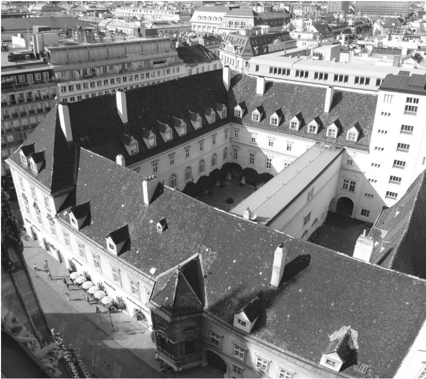
Abb. 14: Das Archiv der Erzdiözese Wien befindet sich im sogenannten Bibliotheksflügel im Innenhof des Erzbischöflichen Palais', das sich zwischen dem Stephansplatz und der Wollzeile erstreckt.

die Diözesen Trient und zum Teil auch Brixen an Italien abgetreten werden. Alles in allem befinden sich heute etliche Diözesanarchive, die für die ältere Kirchengeschichte Österreichs relevant sind, nicht auf österreichischem Staatsgebiet (Passau, Brixen, Trient, Chur).