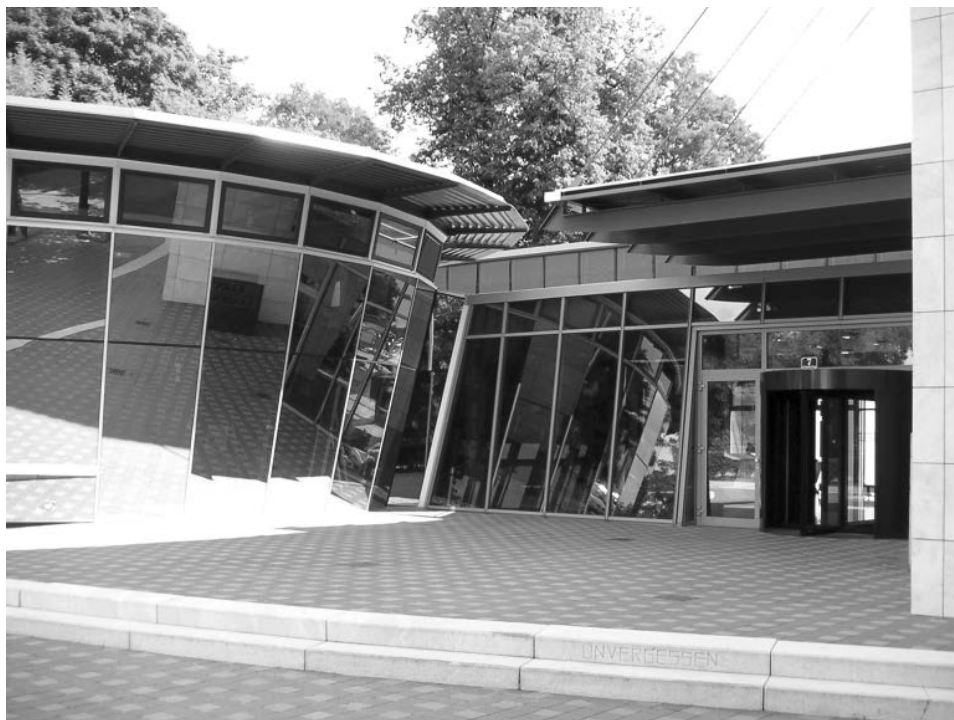
Abb. 9: Der architektonisch besonders wertvolle Neubau des Kärntner Landesarchivs in Klagenfurt aus dem Jahr 1996.

genständigen Landesarchiven zu „Landesarchiven neuen Typs“ zusammengelegt werden. In einigen Ländern ging diese Fusion zügig von Statten, z. B. in der Steiermark im Jahr 1927. In anderen Ländern zog der Prozess sich hin, etwa in Niederösterreich, wo die beiden Archive nach einem gescheiterten Versuch in den 1930ern erst 1940 im Zuge der Anlage von Reichsgauarchiven fusioniert wurden, um 1945 in ein Landesarchiv neuen Typs umgewandelt zu werden. Das regionale Archivwesen Österreichs wurde fast komplett „verändert“; 30 der Bund konnte nur mittels Archivamt eine Aufsicht über den Schutz der Archivalien ausüben, hatte aber keine Zugriffsmöglichkeiten auf die völlig autonomen Landesarchive.