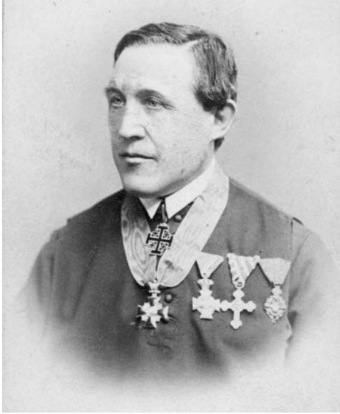
Abb. 4: Beda Dudík, OSB (1815–1890), mährischer Historiker und Archivar.