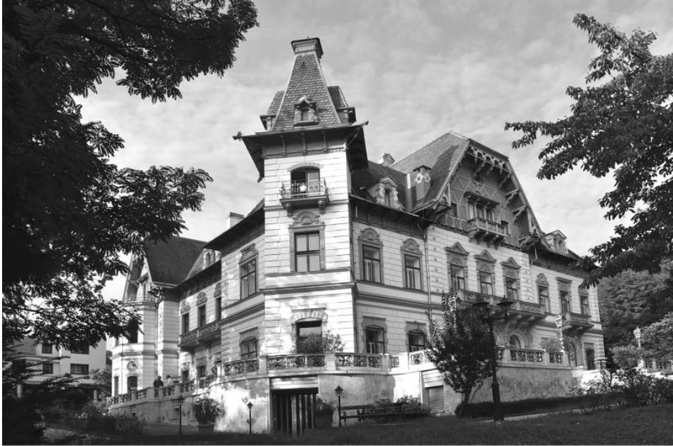
Abb. 17: Im Springer Schloß im 12. Wiener Gemeindebezirk, Tivoligasse 73, residiert die Politische Akademie sowie das Karl von Vogelsang-Institut der ÖVP.

Archiv. Ansonsten gibt es in Österreich noch das Archiv der Kommunistischen Partei Österreichs (KPÖ), das 1945 errichtet wurde, seit 2005 jedoch nur mehr ehrenamtlich betreut wird. 80