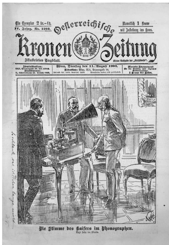
Abb. 18: Aufnahme der Stimme Kaiser Franz Josephs durch einen Phonographen der Phonogramm-Archiv-Kommission der Kaiserlichen Akademie der Wissenschaften (Zeichnung auf der Titelseite der Oesterreichischen Kronen-Zeitung vom 11. August 1903; für die freundliche Übermittlung des Scans sind wir dem Phonogrammarchiv der Österreichischen Akademie der Wissenschaften dankbar verpflichtet).

Was die audiovisuellen Medien betrifft, besitzt Österreich mit dem 1899 gegründeten, an der Kaiserlichen (heute Österreichischen) Akademie der Wissenschaften angesiedelten Phonogrammarchiv das älteste audiovisuelle Archiv der Welt; die zu seinen multidisziplinären Sammlungen zählenden Historischen Bestände 1899–1950 (zumeist die Ergebnisse ethnomusikologischer und linguistischer Feldforschung) gehören zum UNESCO-Weltdokumentenerbe. 81 Im Vergleich zu Deutschland oder auch Tschechien wurde hingegen in Österreich erst