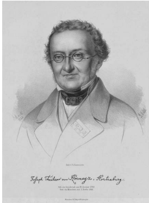
Abb. 3: Joseph Freiherr von Hormayr-Hartenburg (1781–1848), österreichischer Jurist, Historiker, Politiker und Archivar, war in den Jahren 1808–1813 Direktor des Haus-, Hof- und Staatsarchivs.

Die enge Anbindung des Hausarchivs an die Staatskanzlei und die Übernahme der Archive des Reichs stärkte dessen Position innerhalb des zentralen Archivwesens der Habsburgermonarchie und trug zur Umwandlung in ein tatsächliches „Staatsarchiv“ bei. Dieser Prozess fand seinen äußeren Niederschlag im neuen Namen „Haus-, Hof- und Staatsarchiv“, der unter Direktor Joseph Freiherr von Hormayr (1781–1848, Direktor 1808–1813) eingeführt wurde.