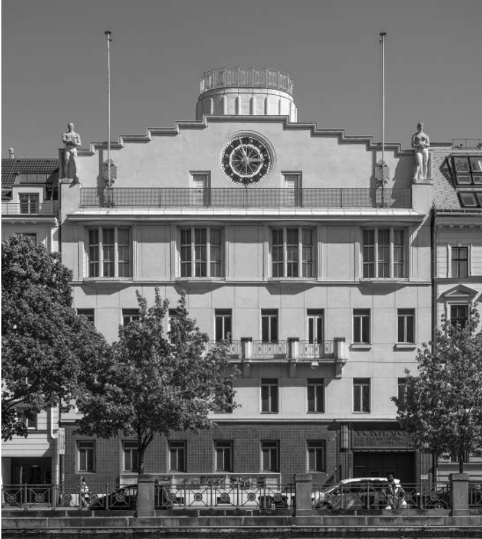
Abb. 16: Das sogenannte Vorwärts-Gebäude im 5. Wiener Gemeindebezirk, Rechte Wienzeile 97, beherbergt sowohl den Verein für Geschichte der Arbeiterbewegung (VGA), als auch die Bruno-Kreisky Stiftung – die beiden wichtigsten Archive der SPÖ (Foto: Thomas Ledl, Wikimedia Commons).

Staatsarchiv des Innern und der Justiz übergeben. Ähnlich erging es den Registaturen der aufgehobenen Großdeutschen Volkspartei sowie der (österreichischen) NSDAP-Hitlerbewegung, die 1936 eingezogen und in dasselbe Archiv verfrachtet wurden. Nach dem „Anschluss“ wurden auch die Archivalien der Christlichsozialen Partei, die an der Entstehung des Ständestaats beteiligt war und sich 1934 selbst aufgelöst hatte, enteignet und Großteils im selben Archiv deponiert.