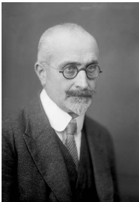
Abb. 6: Ludwig Bittner (1877–1945), österreichischer Historiker und Archivar, ab 1926 Direktor des Haus-, Hof- und Staatsarchivs, 1941–1945 Direktor des Reichsarchivs Wien (Foto: Bildarchiv Austria).

stizpalastes erwies sich jedoch als schicksalhaft, als das neue Archiv im Jahr 1927 durch den Justizpalastbrand größtenteils vernichtet wurde. Eine nicht sonderlich tiefgreifende Strukturveränderung war schließlich die Umwandlung des Eisenbahnarchivs in das breiter angelegte „Verkehrsarchiv“. 15