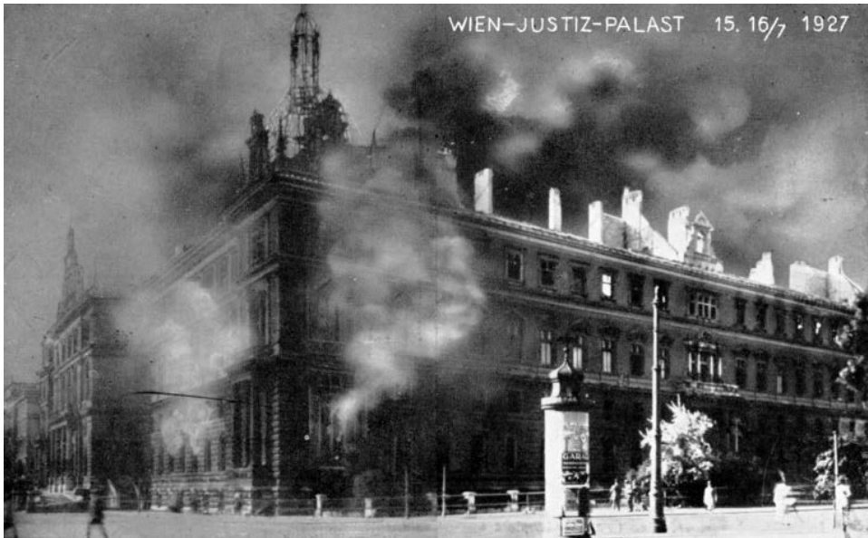
Abb. 7: Der Brand des Justizpalastes am 15. Juli 1927 stellt die größte Katastrophe der österreichischen Archivgeschichte dar.

Wien umbenannt wurde, sowie das Verkehrsarchiv blieben außerhalb dieser neuen Institution. Die Leitung des Reichsarchivs übernahm einer der einflussreichsten Männer des österreichischen Archivwesens der 1930er Jahre – Ludwig Bittner. 17