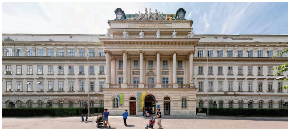
Abb. 1: Das historische Hauptgebäude der TU Wien am Karlsplatz, Standort des Universitätsarchivs der TU Wien

Wien in „Technische Universität Wien“ umbenannt sowie die Fakultätsgliederung wieder auf fünf erweitert (Technisch-naturwissenschaftliche Fakultät, Fakultät für Architektur und Raumplanung, für Bauingenieurwesen, für Maschinenbau, für Elektrotechnik und für Technische Chemie). Das Professoren- und das Gesamtkollegium wurden aufgelöst zugunsten eines vergrößerten Akademischen Senats und die bisher überhaupt nicht organisatorisch zusammengefassten zentralen Verwaltungsdienste einer neu eingerichteten Universitätsdirektion unterstellt.