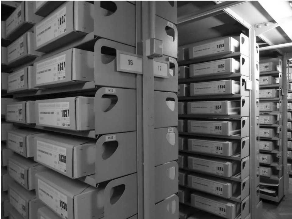
Abb. 2: Blick in das Magazin des Universitätsarchivs

gerten älteren Akten zusammenzuführen. Darüber hinaus bemühte er sich auch, wichtige Aktenüberlieferungen anderer Abteilungen (etwa der Studien- und Prüfungsabteilung) und der Fakultäten für das Archiv zu sichern. Unterstützt wurden seine Bestrebungen durch den damaligen Rektor Wilfried Nöbauer. So gelang es ihm 1988, die Betreuung der Privilegiensammlung sowie der Rigorosenakten und der Habilitationsakten wieder an das Archiv zurück zu holen. 1977 wurden erstmals die Altakten der Zentralen Verwaltung als „Archiv der Universität“ definiert und ihre Betreuung Dr. Lechner als Arbeitsfeld übertragen. 1979 erfolgte die Errichtung eines Universitätsarchivs als besondere Dienststelle gem. §82 Abs. 1 UOG 75 und die Betrauung Dr. Lechners mit der Leitung. 1991 wurde der Status des Archivs als besondere Dienststelle der Universitätsdirektion bestätigt. Seit 1. Januar 1999 ist es gem. UOG 1993 eine Abteilung der Zentralen Verwaltung der TU Wien, seit 1. Januar 2004 eine Abteilung der Universitätsverwaltung und einem Mitglied des Rektorats zugeordnet. Dies war 2005–2011 der Vizerektor für Lehre, 2011–2015 die Rektorin, und seit Herbst 2015 ist es der Vizerektor für Infrastruktur, seit März 2019 Vizerektor für Digitalisierung und Infrastruktur.