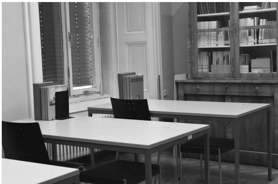
Abb. 3: Blick in den Benutzerraum des Universitätsarchivs

Fachschulen bzw. Fakultäten. Die ursprünglich ebenfalls vorhandenen Nationale wurden fast gänzlich vernichtet, mit Ausnahme der Nationale der a.o. Hörer 1906/07–1966/67. Zusätzlich haben sich, allerdings in unvollständiger Reihe, für das 19. Jahrhundert Prüfungs- und Hörerkataloge der Fachschulen sowie zu einzelnen Vorlesungen erhalten.